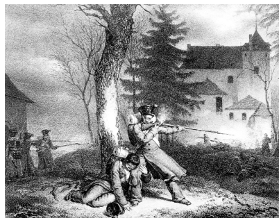
Schermsutelingen tijdens de Belgische Afscheiding. Op 19 januari 1831 probeerden soldaten van het Maastrichtse garnizoen het kasteel te veroveren op de Belgische compagnie die er gelegerd is. In het heetst van de strijd weet de moedige Maastrichtse fuselier Claude zijn gewonde compagnie te redden.

schermutselingen tijdens de Belgische Afscheiding. Op 19 januari 1831 probeerden soldaten van het Maastrichtse garnizoen het kasteel te veroveren op de Belgische compagnie die er gelegerd is. In het heetst van de strijd weet de moedige Maastrichtse fuselier Claude zijn gewonde compagnie te redden.