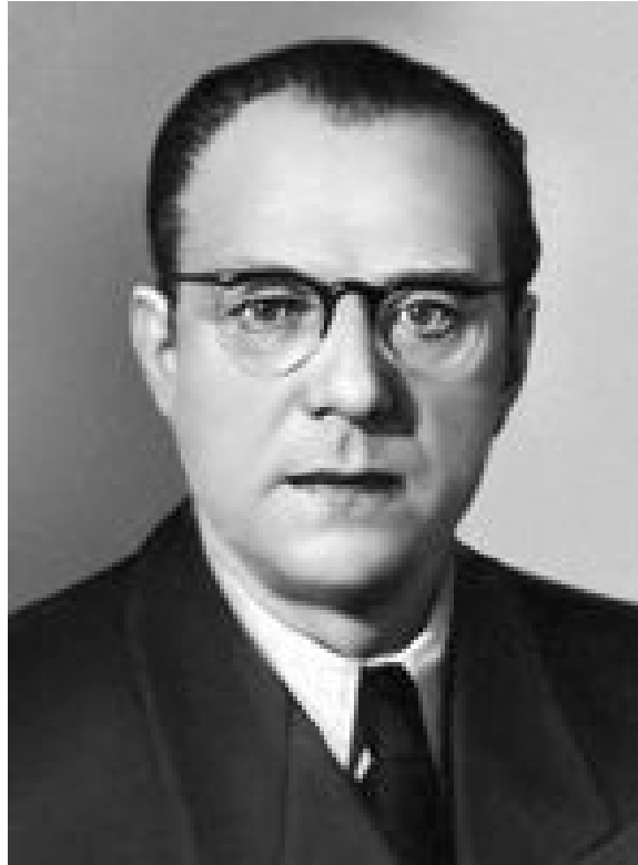
Отто Гротеволь (1894-1964)

В то время как западные оккупационные зоны стремились запретить любое новое политическое проявление национал-социализма, Сталин исследовал возможности интеграции таких элементов в новой советской Германии. Молчание, которое он получил в ответ от лидеров СЕПГ, основывалось на типично марксистской реакции. Однако марксизм используют для того, чтобы подрывать и разрушать нации и государства, а не строить их. Сталин, как правильно жаловался Троцкий, «предал» большевистскую революцию [2], полностью изменив – вплоть до полной противоположности – по возможности каждую марксистскую программу, которая была установлена Лениным, Троцким, Зиновьевым, Каменевым, Свердловым, и другими, кто был по большей части вычищен или ликвидирован Сталиным. [3]