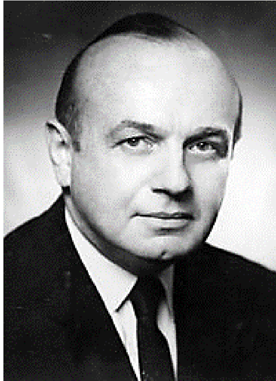
Йосеф Ткоа (1925-1991)

Восточногерманский режим никогда не брал на себя виновность за войну, которая была фундаментом боннского режима, и, следовательно, для него не было моральных препятствий, чтобы проводить антиссионистскую политику. Интересно, что первые комментарии о намерениях Бонна выплатить компенсации евреям и Израилю были опубликованы спустя три дня после публикации обвинительных актов против Сланского и других за «сионистскую измену». Статья в официальной газете СЕПГ Neues Deutschland описывала соглашение о компенсациях как договоренность, достигнутую между «западногерманскими и израильскими капиталистами». [37] Со смертью Сталина в 1953 году Израиль надеялся на изменения в этом направлении, включая и вопрос компенсаций, но ГДР ответила отказом.