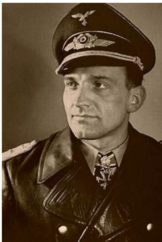
Ганс-Ульрих Рудель (1916-1982)

Следовательно, линия, которую приняли и Ремер и ГДР, ни в коем случае не была историческим отклонением или парадоксом. 23 октября 1952 года SRP была запрещена [48], после того, как она получила 16 мест в земельном парламенте (ландтаге) Нижней Саксонии и 8 мест в Бремене. За SRP последовали Немецкая имперская партия полковника Ганса-Ульриха Руделя, и Национал-демократическая партия ( NPD ), которую не следует путать с ее спонсируемой Советами тезкой НДПГ ( NDPD ).