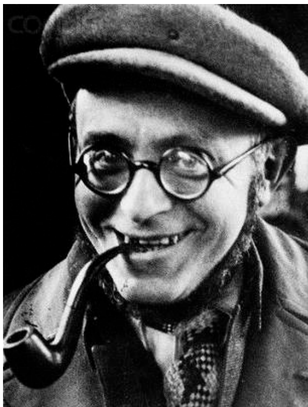
Карл Радек (1885-1939)

Движение «национал-большевиков» среди немецких правых в течение Веймарской эры видело в СССР естественного союзника Германии в противостоянии плутократии. Они выступали за восточную ориентацию для немецкой дипломатии, которая была отражена в Рапальском договоре 1922 года. Основными «национал-большевиками» был Эрнст Никиш и Карл О. Петель, вокруг которых собирались не только радикальные националисты и революционные консерваторы, такие как Отто Штрассер и Эрнст Юнгер , но также и коммунисты Бертольд Брехт и Эрнст Толлер. [43] Даже Освальд Шпенглер, консервативно-революционный философ-историк, который предупреждал о возможности лидерства России в «цветной мировой революции» под знаменем большевизма, [44] также видел возможность еще одного русско-немецкого союза. [45]