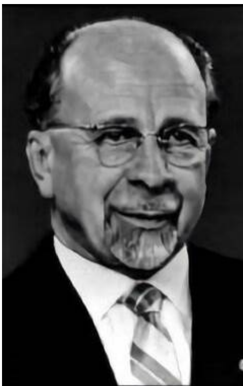
Вальтер Ульбрихт (1893-1973)

Пик, по-видимому, предполагая, что запланированную партию назовут «национал-социалистической» или «фашистской», возразил, что союзники не разрешат воссоздание такой партии. Сталин в ответ рассмеялся, и объяснил, что партии дадут название, которое было менее очевидным, такое как «национальные демократы». [11]