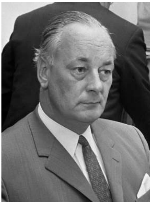
Адольф фон Тадден (1921-1996)

В то время как планам Йоки внезапно пришел конец с его смертью в тюрьме Сан-Франциско в 1960 году, где он ожидал суда по обвинению о мошенничестве с паспортом, его воинственная позиция была перенята новым поколением во главе с Михаэлем Кюненом, который основал Фронт действия национал-социалистов в конце 1970-х и в 1980-х годах. Под названием Северная ячейка Вервольфа, [55] в сотрудничестве с Wiking Jugend был организован рейд на базу НАТО в Нидерландах наряду с другими рейдами против баз НАТО и США в Западной Германии. [56]