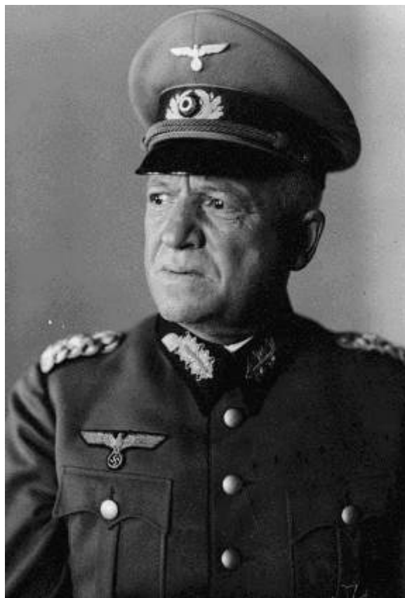
Вильгельм Адам (1893-1978)

1923 году, и его участия в Мюнхенском т.н. «пивном» путче. Он был членом консервативной Немецкой народной партии (DVP) в 1926-1929 годах. В 1933 году он вступил в союз фронтовиков «Стальной шлем» (Stahlhelm) и в Штурмовые отряды (SA). Попав в плен в 1943 году в Сталинграде, Адам присоединился к Национальному комитету «Свободная Германия». Вернувшись в Советскую оккупационную зону Германии в 1948, он стал советником регионального правительства Саксонии. В 1952 году он стал полковником в «Казарменной народной полиции» (Kasernierte Volkspolizei, KVP), которая в будущем превратилась в Национальную народную армию ГДР. В 1968 году его наградили орденом «Знамя труда», а в 1977 году, за год до его смерти, Адаму присвоили звание генерал-майора.