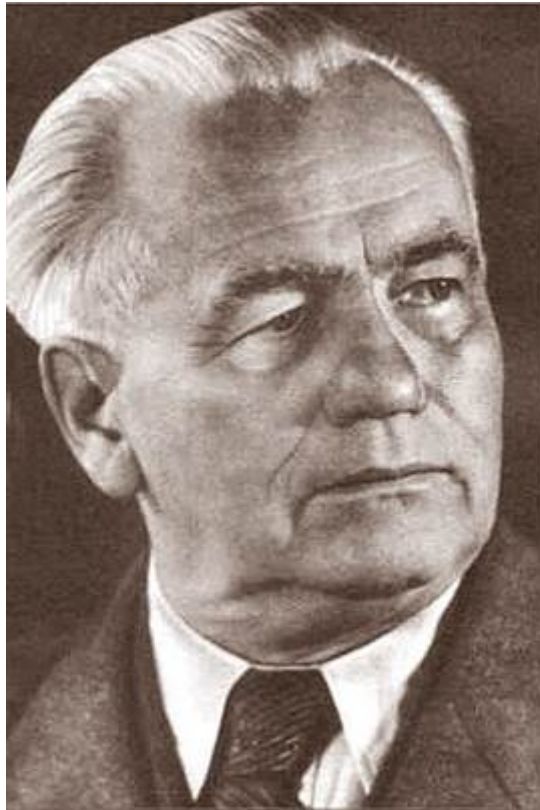
Вильгельм Пик (1876-1960)

это создаст у них положительное впечатление, что «не все они будут уничтожены». Пик оценил эту идею как «невозможную», в то время как Сталин не видел причины, почему этого нельзя было бы достигнуть. Он хотел завербовать на свою сторону «патриотические элементы» «фашистской партии» особенно среди «второстепенных фигур прежней нацистской партии». Не было бы ничего реакционного в основании такой партии, так как многие «нацисты» «вышли из простого народа». [4]