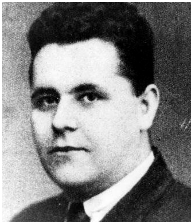
Пауль Меркер (1894-1969)

ГДР ни на какой стадии не устанавливала дипломатические отношения с Израилем. ГДР также непреклонно отказывалась платить любые компенсации Израилю или «пережившим Холокост».