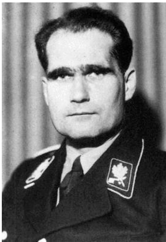
Рудольф Гесс (1894-1987)