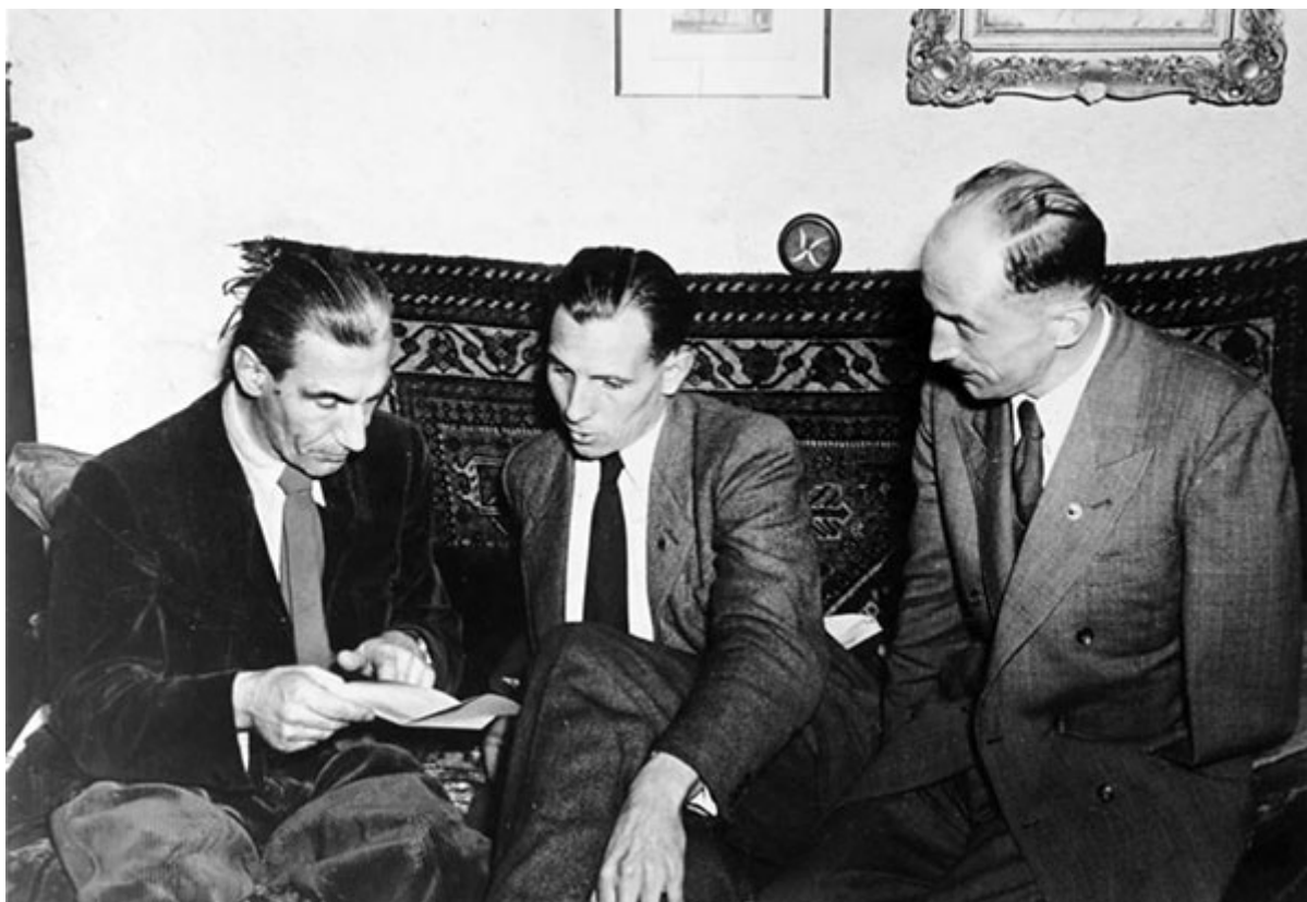
Руководство SRP (Социалистическая имперская партия); председатель SRP доктор Фриц Дорльс, бывший генерал-майор Отто Эрнст Ремер, второй председатель SRP и бывший член СС и лидер Гитлерюгенда граф Вольф фон Вестарп. Фотография от 14 августа 1952 года.

Когда США выбрали политику включения Германии в западную систему обороны, Ремер начал кампанию под лозунгом « Ohne Mich! » («Без меня!»), которая быстро вызвала положительную реакцию со стороны ветеранов войны, обиженных из-за их послевоенного затруднительного положения в западной зоне. Ремер пошел дальше и заявил, что в случае войны немцы не должны будут прикрывать американское отступление, если русские прогонят их назад. Он заявил, что «покажет русским путь к Рейну», и что члены SRP «займут места регулировщиков на дорогах, показывая руками направление, чтобы русские смогли найти свой путь через Германию как можно быстрее». [28]