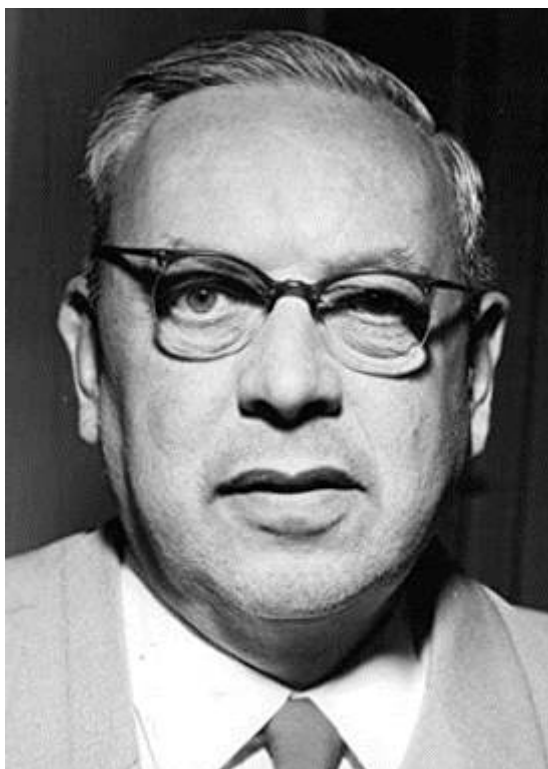
Лотар Больц (1903-1986)

Программа НДПГ была резко националистической; настолько же националистической, как и программа Социалистической имперской партии, которая была объявлена вне закона в Федеративной Республике: