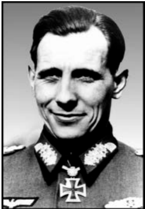
Отто Эрнст Ремер (1912-1997) во время войны National-Demokratische Partei Deutschlands (NDPD)

Самое большое послевоенное национал-социалистическое формирование в западной зоне, Социалистическая имперская партия (Sozialistische Reichspartei, SRP) во главе с генерал-майором Отто Ремером, было быстро подавлено союзниками, когда оно добилось значительных успехов на выборах. Больше всего союзников беспокоила «нейтралистская позиция» Социалистической имперской партии, в то время, когда США полностью отменили План Morgenthau, направленный на уничтожение немецкой государственности и национальности, [14] и стремились восстановить Германию как союзника против нового противника, Сталина. Сэр Освальд Мосли, комментируя арест доктора Вернера Наумана, назначенного Гитлером преемником Геббельса, и немногих других, за то, что они предположительно составили заговор, чтобы внедриться в Свободную демократическую партию (FDP), отметил относительно послевоенной политики Запада по отношению к Германии, что «Спустя годы после того, как русские предлагали немецким ученым любое материальное вознаграждение, которое может потребоваться в жизни, союзники заставляли таких людей убирать каменные обломки на улицах по причине их прежних политических симпатий». [15]