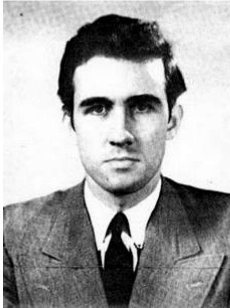
Фрэнсис Паркер Йоки (1917-1960)

Йоки написал продолжение Imperium , работу Der Feind Europas ( «Враг Европы» ), в качестве инструкции для SRP, хотя этот документ был конфискован оккупационными властями. [31]