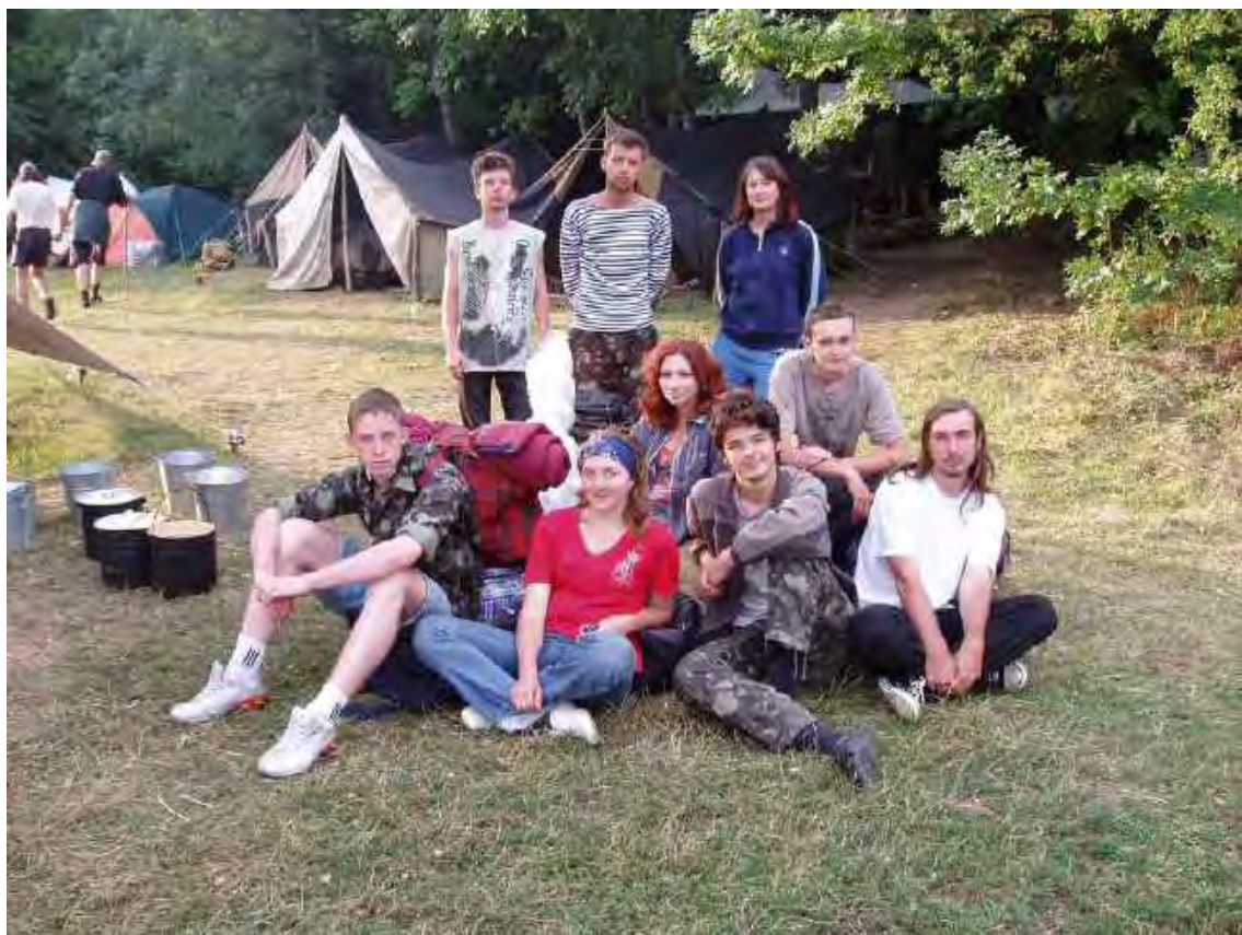
Первокурсники на археологической практике. Мангуп. 2006 г.

Три вида студенческих практик. Археологическая практика традиционно проводилась на крымских памятниках. Студенты работали на средневековых городищах Мангуп, Эски-Кермен, позднескифском городище у с. Дружное, позднеантичном могильнике у с. Баланово. Археологическая практика – самая любимая у студентов, воспоминания о ней сохраняются многие годы после окончания учёбы в университете. На раскопках первокурсники быстрее, чем в аудиториях, узнают друг друга и