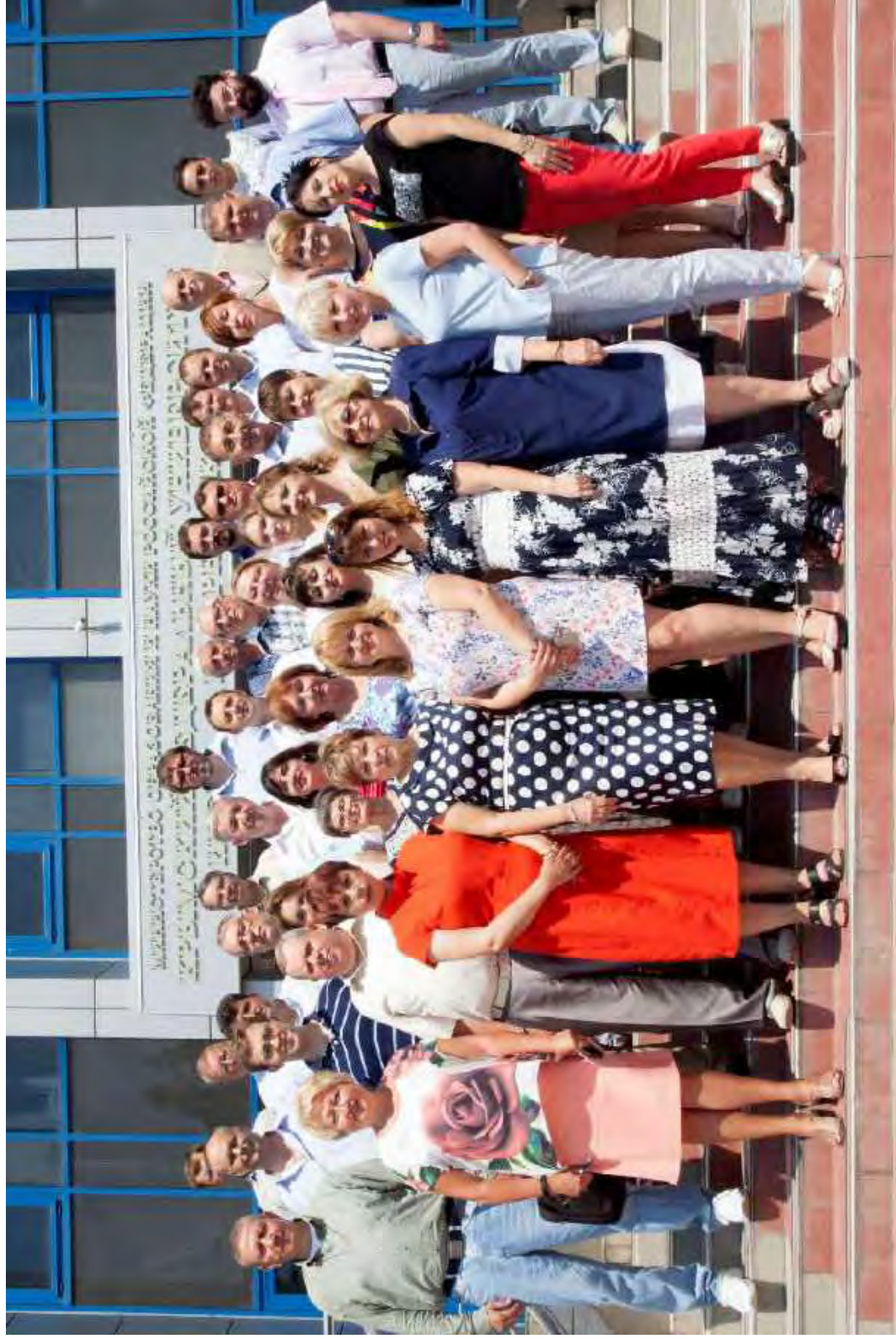
Мы – истфак! Коллектив сотрудников исторического факультета Таврической академии КФУ им. В. И. Вернадского. 2018 г.