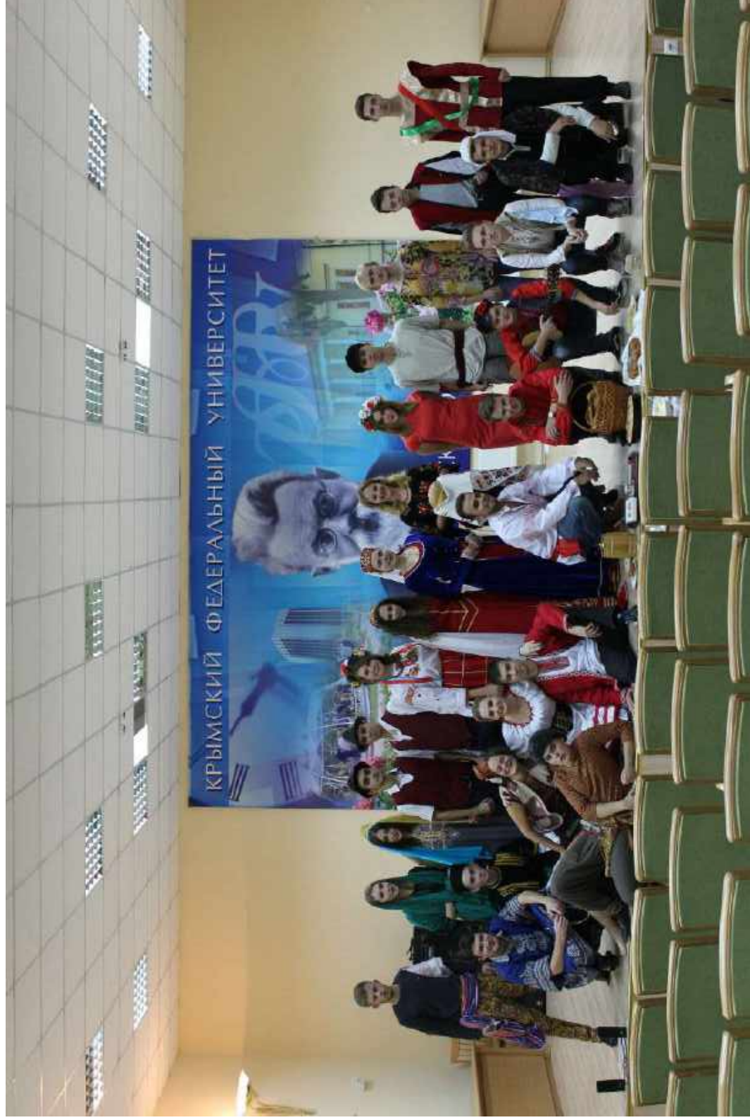
Студенты истфака на фестивале «Культура народов Крыма». 2017 г.