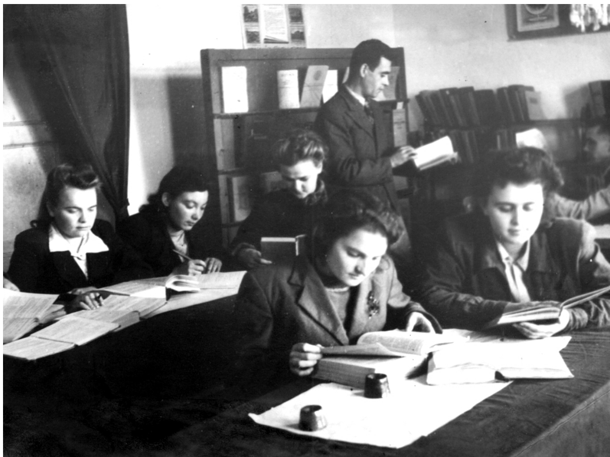
Студенты-историки Крымского государственного педагогического института в читальном зале. 1947 г.

русским полководцем, студенты физмата считали Н. И. Пирогова известным русским хирургом и педагогом XVII века. Часто приходилось преподавателям сталкиваться на экзаменах и зачётах с анекдотическим невежеством студентов в области географии, литературы. Об этом открыто писалось в отчётах института. Но повышающиеся требования профессорско-преподавательского состава к знаниям и речевым навыкам студентов постепенно приводили к положительным результатам.