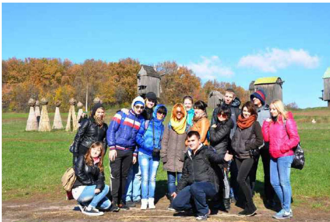
Поездка в Национальный музей народной архитектуры и быта Пирогово (г. Киев). 2013 г.

Два раза в год на факультете проводились “Дни открытых дверей”, в которых участвовали представители каждой кафедры, деканата, студенческого самоуправления. Силами студентов и преподавателей был изготовлен фильм о факультете, создан рекламный буклет. Регулярно осуществлялись поездки по городам и сёлам Крыма, во время которых происходили встречи со старшеклассниками, их родителями, администрацией школ».