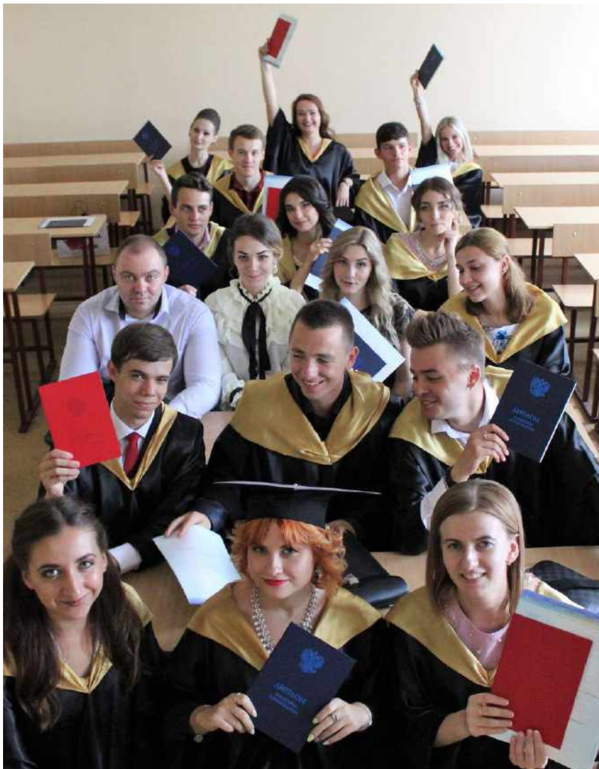
Выпускники кафедры документоведения и архивоведения. 2018 г.