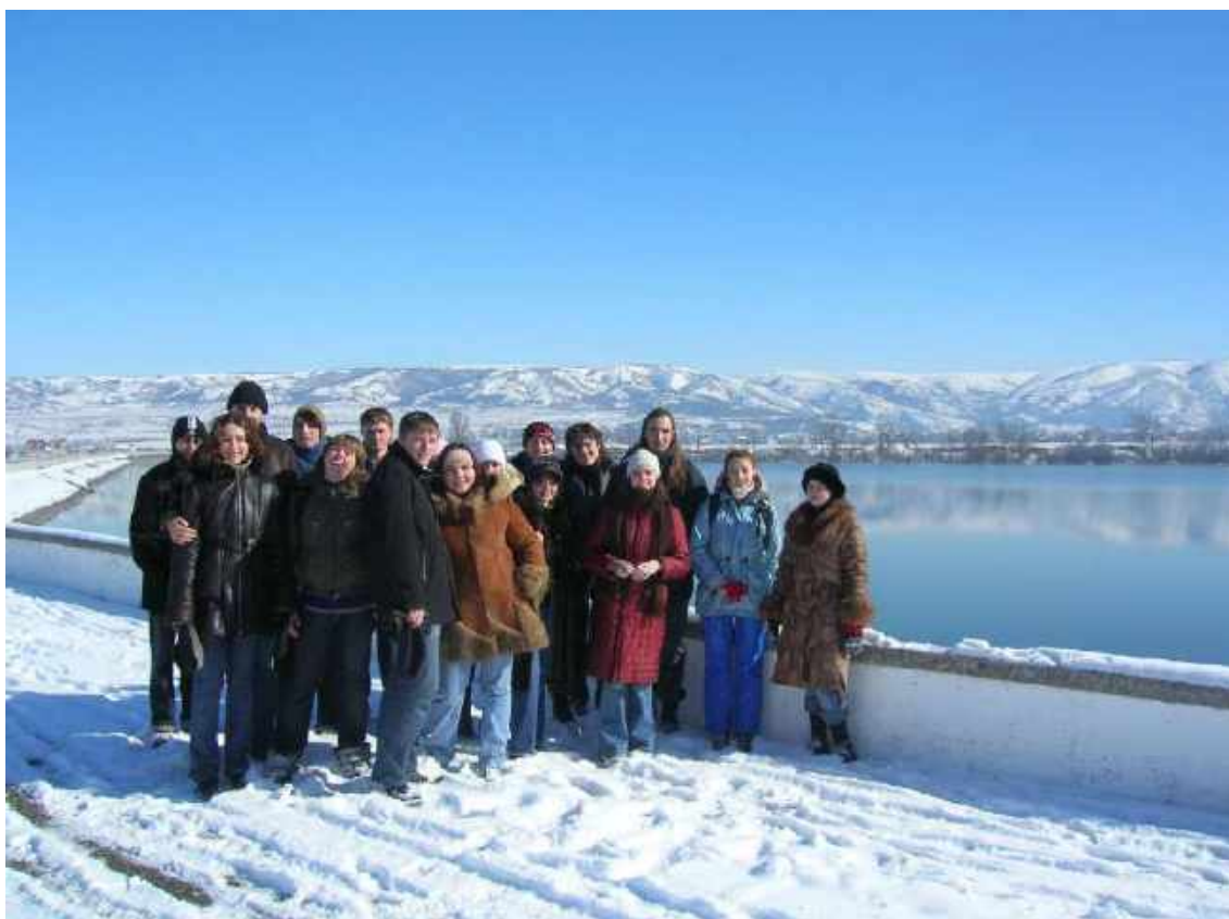
Поход на Аянский источник. 2007 г.