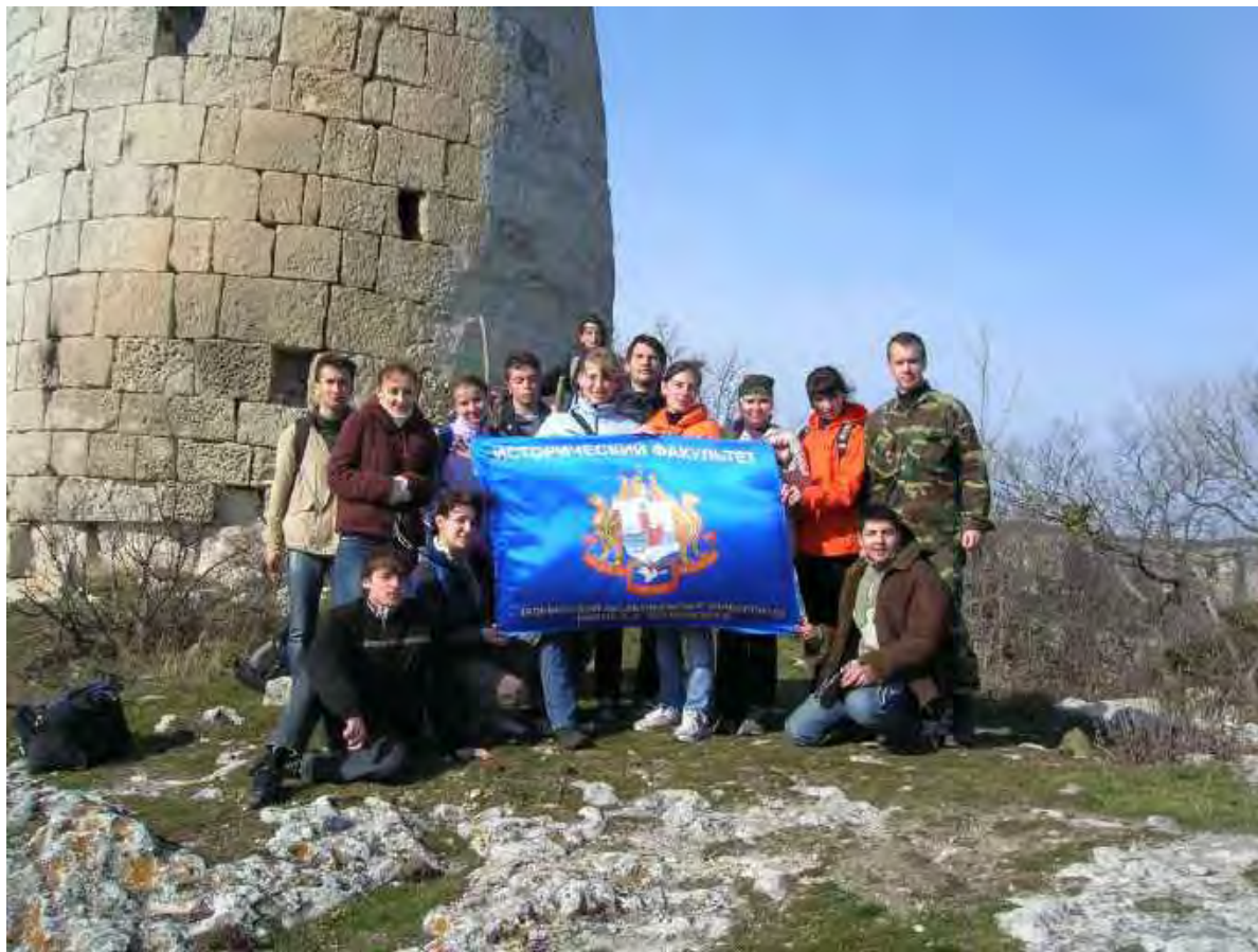
Экскурсия истфаковцев на Сюйренскую крепость. 2008 г.