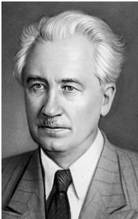
Борис Дмитриевич Греков

историко-филологическом факультете Императорского Варшавского университета. В 1905–1907 обучался на историко-филологическом факультете Московского университета. В 1914 году в Петроградском университете защитил магистерскую диссертацию «Новгородский дом Святой Софии: опыт изучения организации и внутренних отношений крупной церковной вотчины». В 1905 работал в Женской гимназии г. Холм; с 1907 жил в Петербурге, где преподавал в гимназии Гуревича, Императорском коммерческом училище и Екатерининском училище; приват-доцент, с 1914 – профессор Петроградского университета; в 1910–1913 – директор библиотеки Шереметевых в с. Михайловском (Подольский уезд Московской губернии); с 1913 – сотрудник Императорской археографической комиссии; в 1916–1918 – приват-доцент, ординарный профессор, заведующий кафедрой русской истории историко-филологического факультета Пермского отделения Петроградского университета; в 1918 – профессор, заведующий кафедрой русской истории историко-филологического факультета Таврического университета; в 1919 – заведующий Крымского центрального архива. В июне 1921 года учёный вернулся в Петроградский университет, где совмещал преподавательскую деятельность с работой в Академии наук, Центральном историческом архиве и Археографической комиссии.