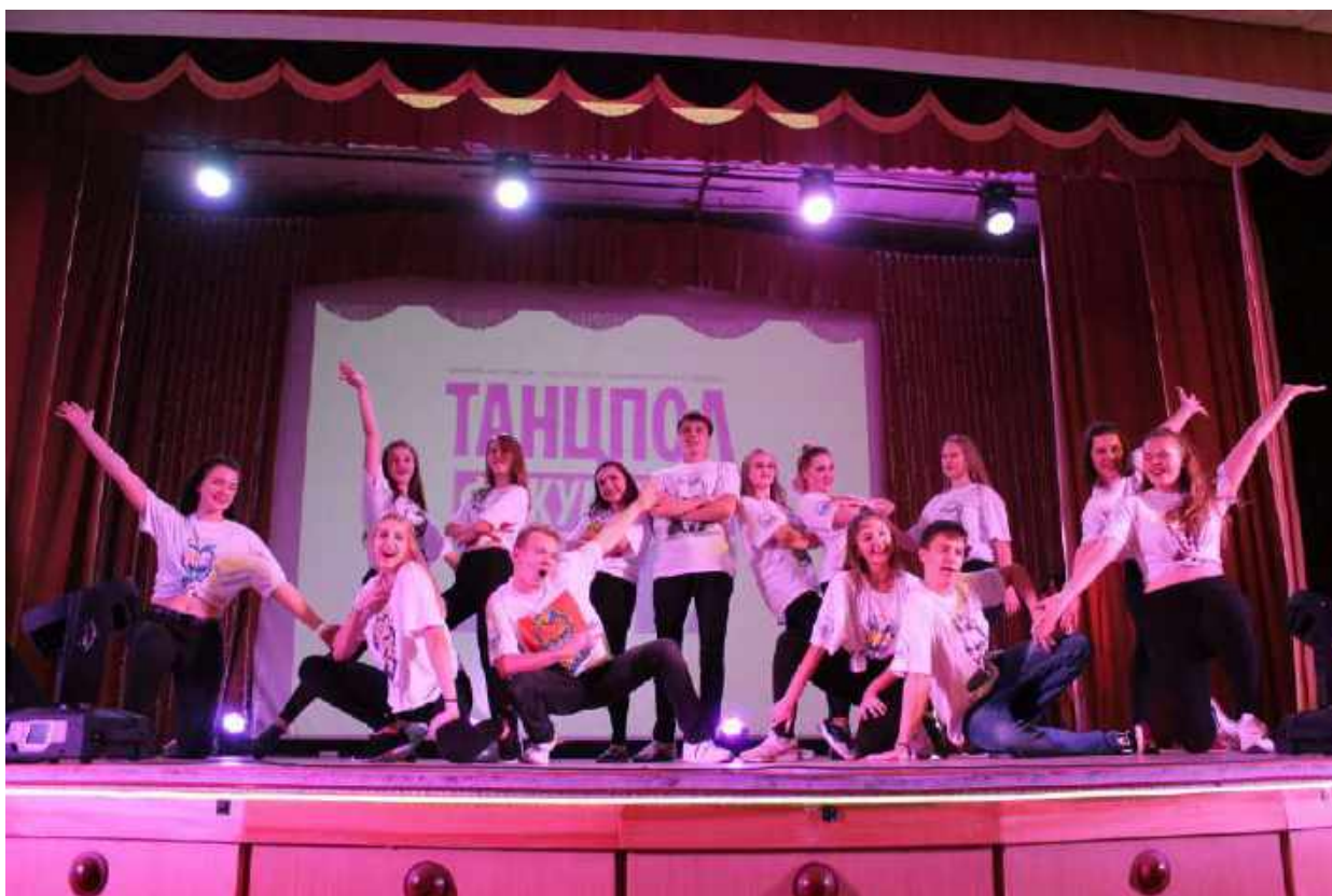
Танцпол факультетов. Команда истфаковцев – победители! 2017 г.

ВКонтакте, Instagram. Информация о прошедших на факультете мероприятиях публикуется на новостном сайте Таврической академии.