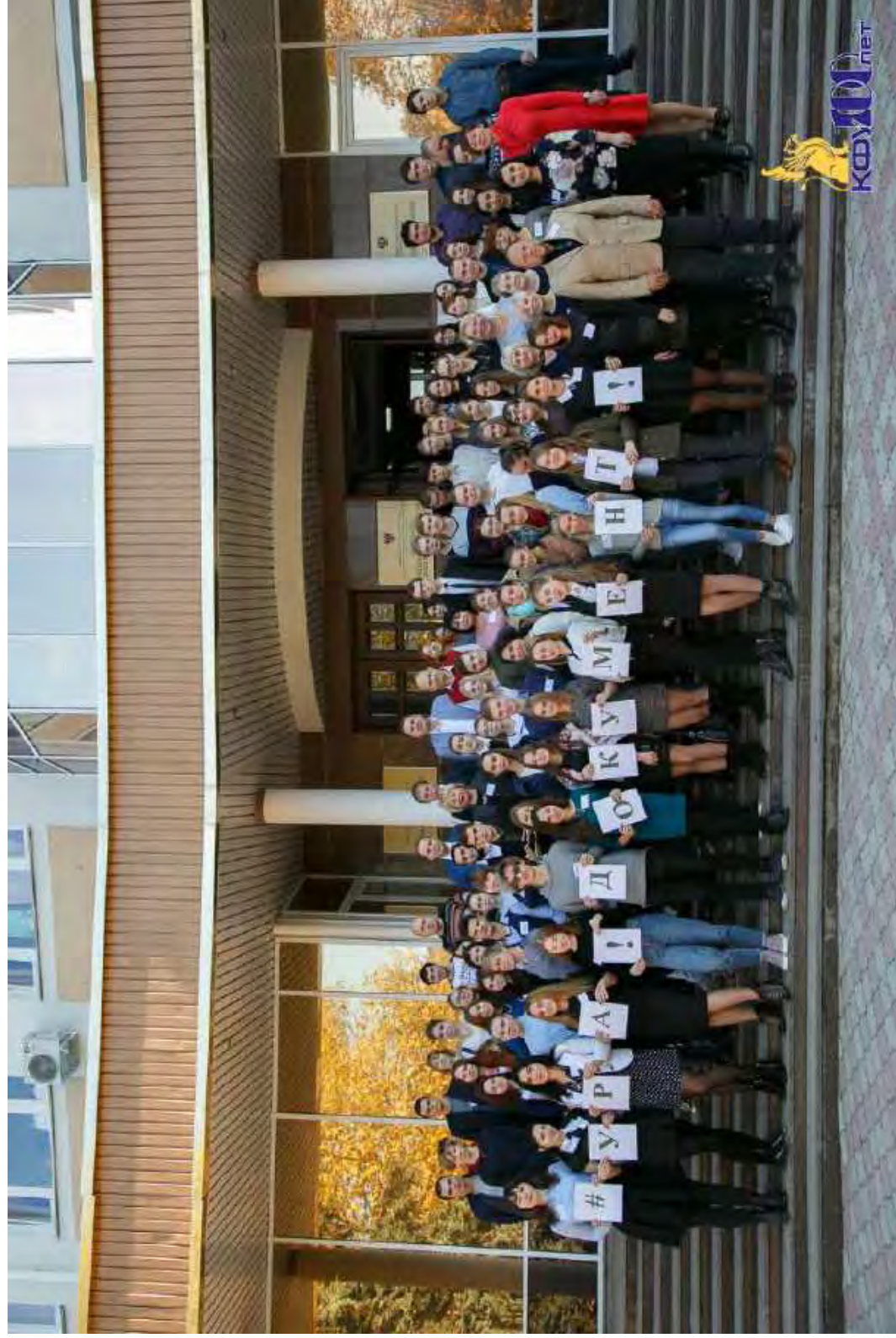
Преподаватели и студенты-специализанты кафедры документоведения и архивоведения – участники Межрегиональной конференции «Документ в современном обществе». 2017 г.