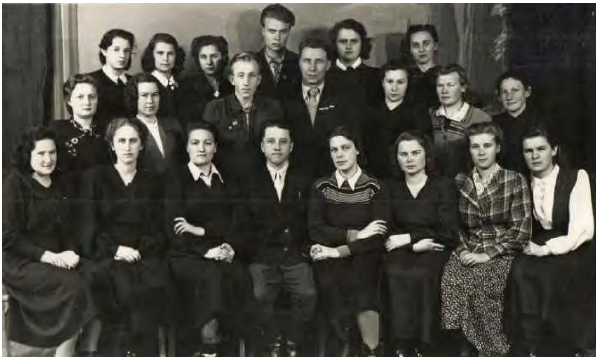
Выпуск историков Крымского пединститута. 1956 г.