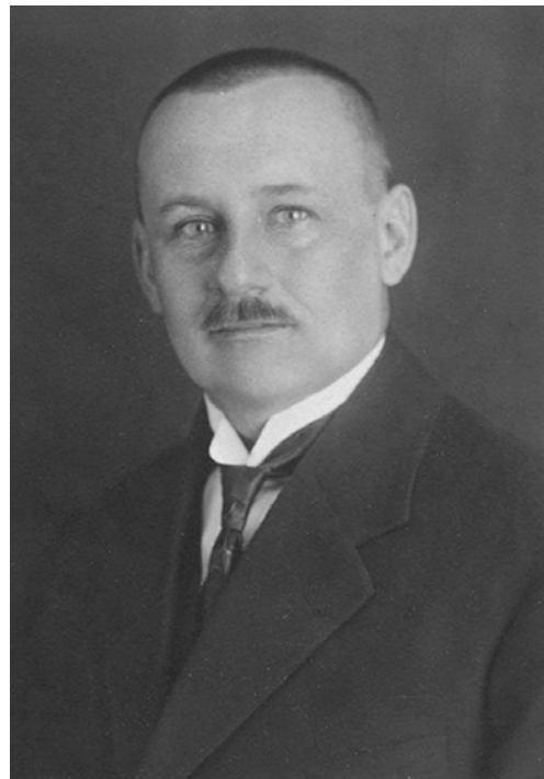
Георгий Владимирович Вернадский

Франции, работал также в Греции и Османской империи (Стамбул) (1894, 1898), на Афоне (1896). В 1890–1900 годах он – приват-доцент, в 1900–1902 – экстраординарный, 1902–1903 – ординарный профессор Казанского университета; в 1903–1915 – ординарный, в 1915–1917 – заслуженный ординарный профессор кафедры теории и истории искусств историко-филологического факультета, заведующий Музеем искусств и древностей (с 1906 г.) историко-филологического факультета Петроградского университета. В 1906–1917 – профессор кафедры истории искусств историко-филологического факультета Высших женских курсов.