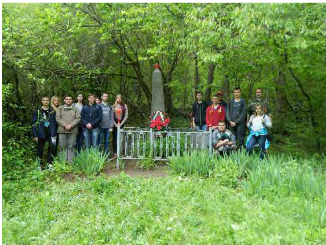
По местам боевой партизанской славы. Джалманская балка. 2016 г.

учебного года осуществляют походы на природные, археологические, историко-культурные памятники Крыма, экскурсии в музеи, театры, организовывают беседы и праздники в школах и детских домах, увлекаются историческими реконструкциями, ставят спектакли. В декабре 2016 года преподаватели кафедры истории России и студенты исторического факультета провели ряд мероприятий под названием «Неделя Карамзина», посвящённых 250-летию юбилею известного русского историка. В 2017 году ко Дню народного единства на факультете прошёл первый конкурсный фестиваль «Культура народов Крыма». Блестящие победы одерживает истфаковская команда в университетской игре «Что? Где? Когда?». Наши отличников чествуют на Ректорском балу выпускников. Как и ранее, самые любимые праздники на факультете – сентябрьское посвящение первокурсники, весенний «День факультета» и летний «День археолога». А ещё студенты вместе празднуют весёлую масленицу («Студенческий разгуляй»). Сами готовят регулярно выходящую газету – «ИСТ.ФАКТЫ».