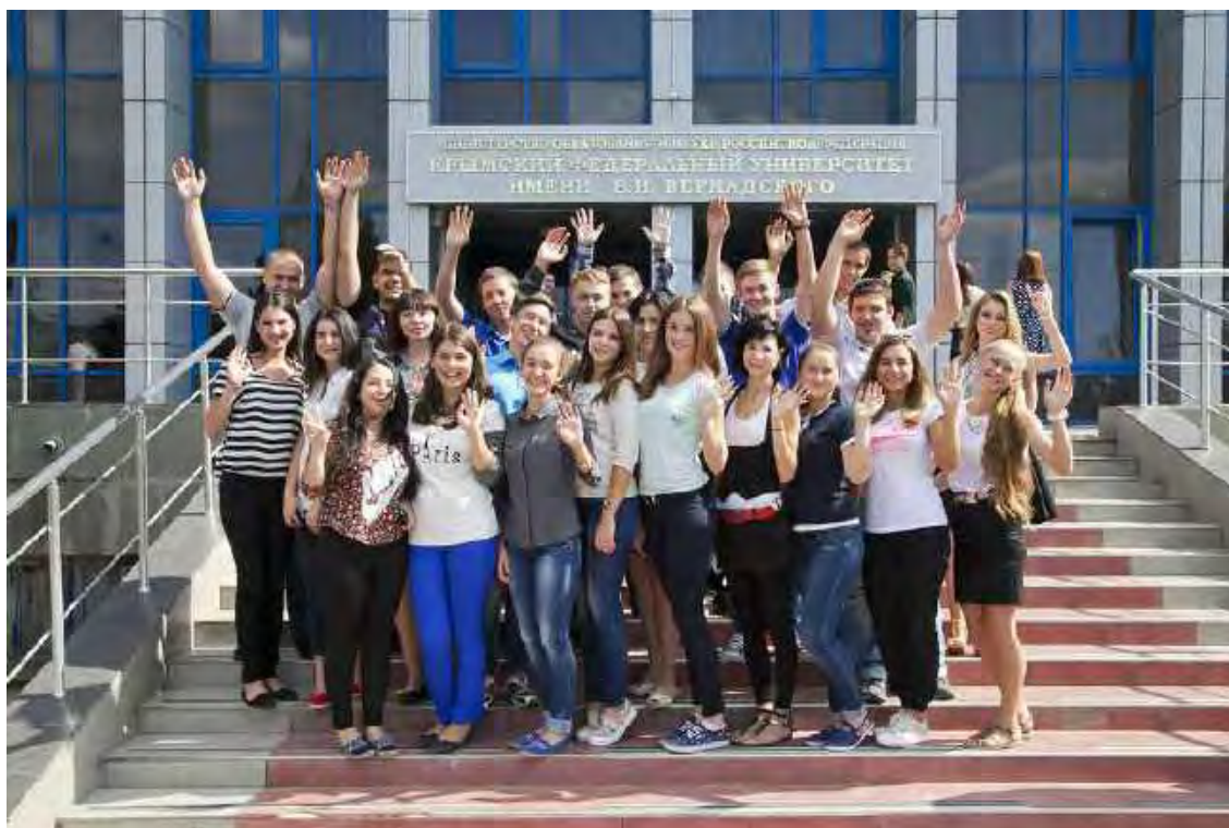
Студенты 3-го курса специальности документоведения и архивоведения. 2015 г.

Сегодня перед университетом стоит задача максимально приблизить подготовку студентов к потребностям конкретного работодателя. В архивной работе, как в любой другой деятельности, есть своя специфика, профессиональные тонкости. Прохождение практик непосредственно на предприятии позволит студентам расширить представление о выбранной профессии, изнутри познать все тонкости специальности, чтобы после завершения вуза молодые специалисты сразу смогли эффективно выполнять ту работу, которая от них требуется. Открытие базовой кафедры даёт университету возможность качественно улучшить подготовку молодых специалистов.