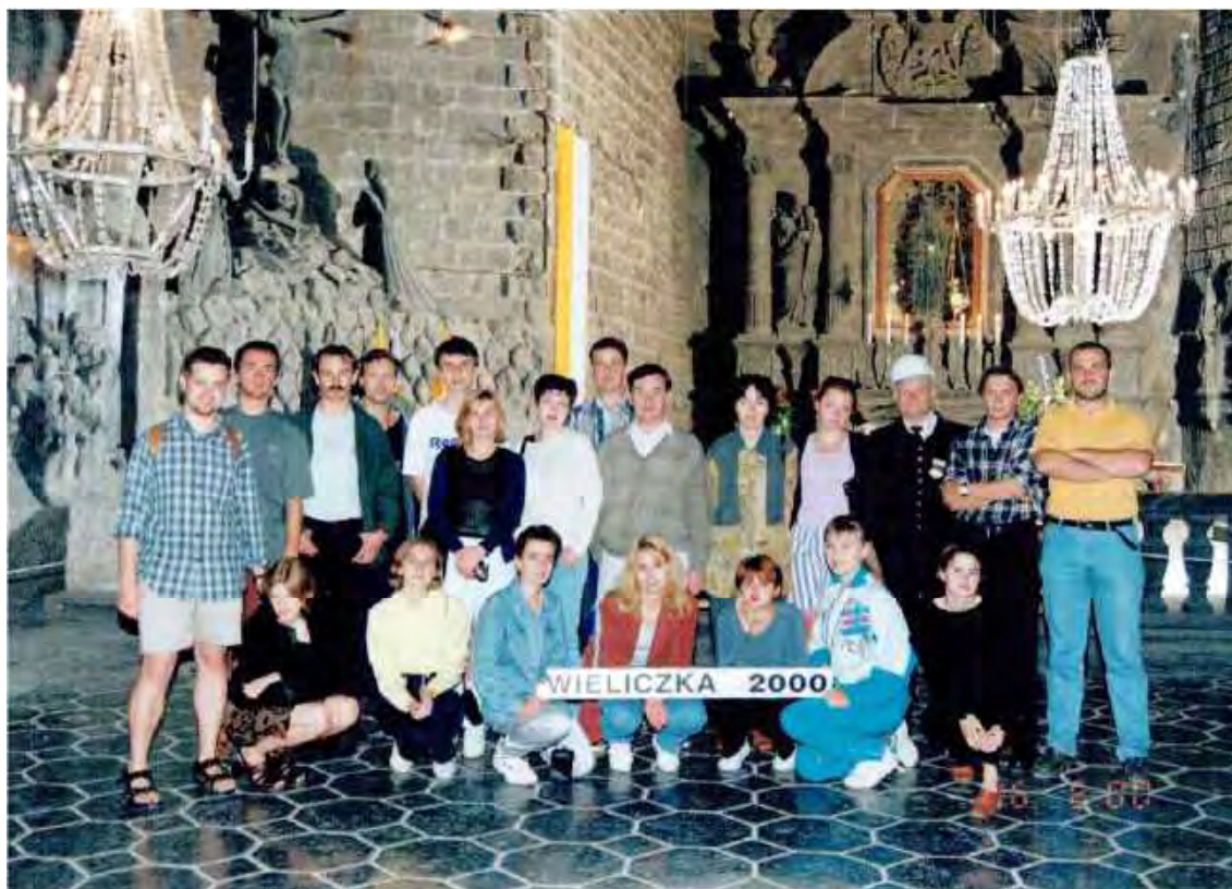
Студенты-историки на музейной практике в Польше по приглашению Института истории Краковского университета. 2000 г.