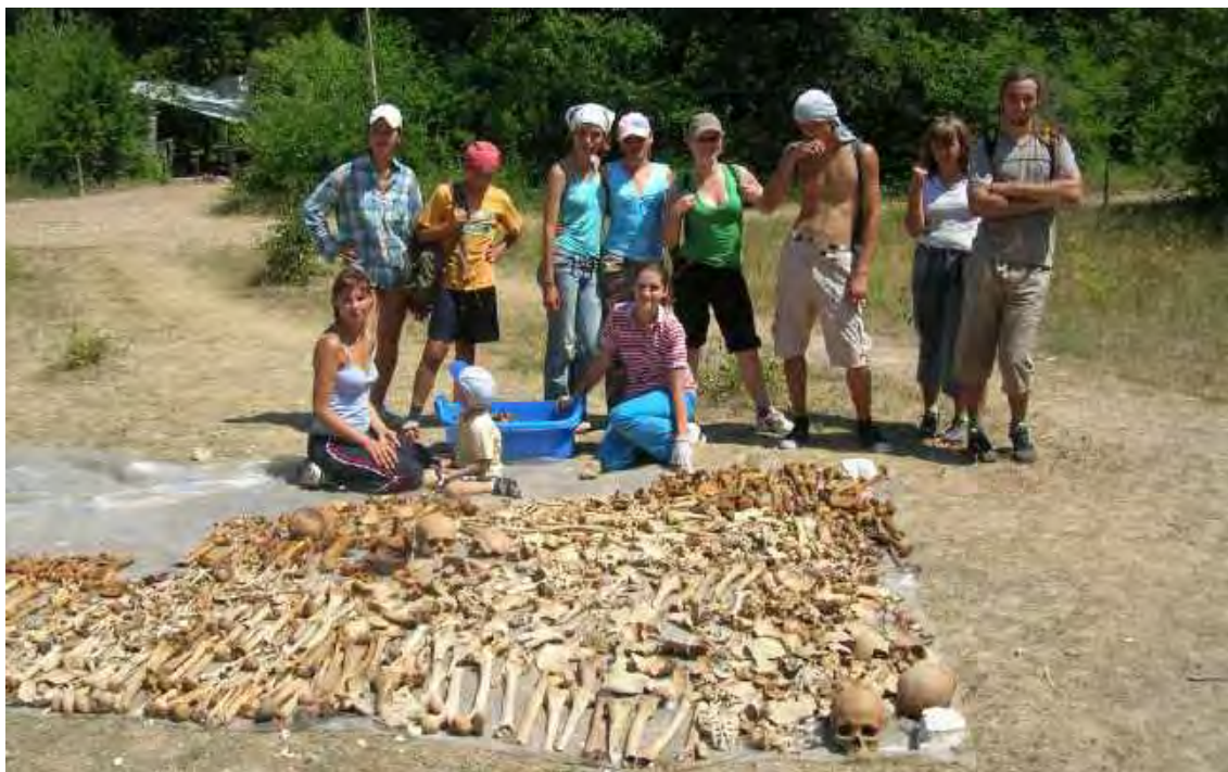
Археологическая практика студентов 1-го курса на Эски-Кермене. 2007 г.

своих преподавателей. Работают с 6-7 часов утра, пока ещё не так жарко, главные инструменты – лопата, кирка, нож, тачка; господствуют полное самообслуживание и строгая дисциплина; вечером – посиделки у костра с гитарой, археологические песни. Смех, передевания и раскованность – главные атрибуты посвящения в археологи на Дне археолога.