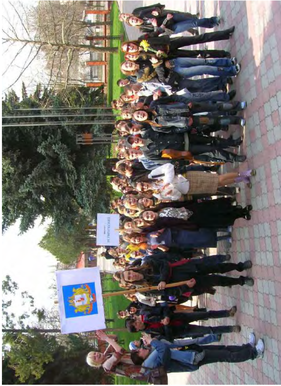
Студенты-историки на Дне факультета. 2007 г.