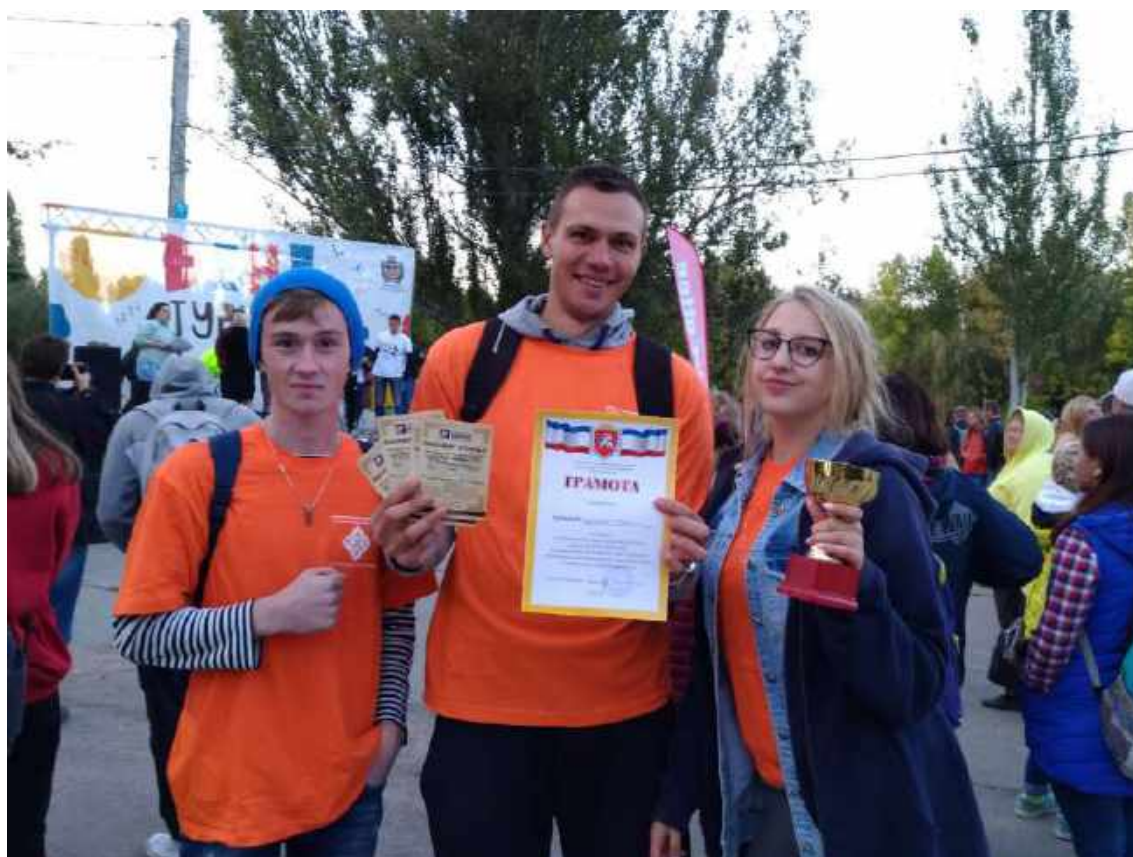
Команда истфака на Дне туризма. 2017 г.

Только в 2017/18 учебном году студенты-истфаковцы приняли участие более чем в 30 различных мероприятиях факультетского, университетского и городского уровней. А 14 апреля 2018 года совершили поход на Чатыр-Даг и покорение самой его высокой вершины Эклизи-Бурун (1527 м) в честь приближающегося 100-летнего юбилея исторического факультета КФУ им. В. И. Вернадского. Этому же событию посвятили «День факультета», к которому долго и серьёзно готовились и который прошёл на ура.