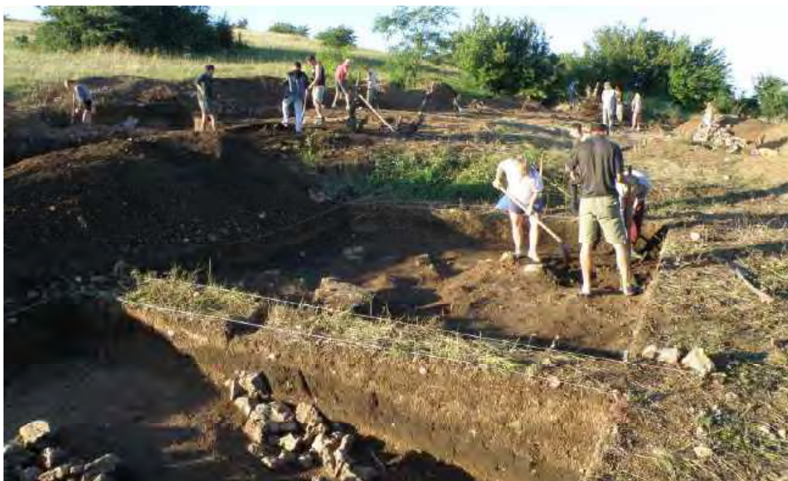
На археологической практике. Опушки. 2016 г.