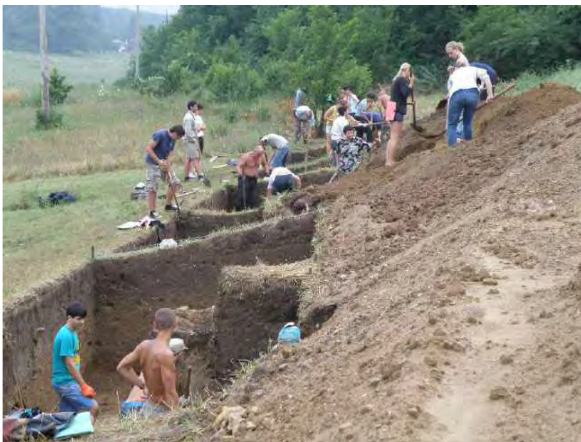
Студенты 1-го курса на археологической практике. Нейзац. 2015 г.

Основным научным направлением кафедры было и остаётся комплексное исследование этнокультурных и социально-политических процессов, протекавших в Евразии, преимущественно в причерноморском регионе, в древности и средневековье. Получены новая информация об исторических процессах в Западной Евразии в каменном, бронзовом, раннем железном веке, в античных государствах Северного Причерноморья и средневековых государствах черноморского региона, новые данные по этнической истории Северного Причерноморья. Успешно разрабатывается тема, связанная с изучением Крыма в конце XVIII – начале XX века. Результаты исследований представляются в научных монографиях и статьях, научно-популярных книгах, апробируются на научных и научно-практических конференциях в России, на Украине, за рубежом.