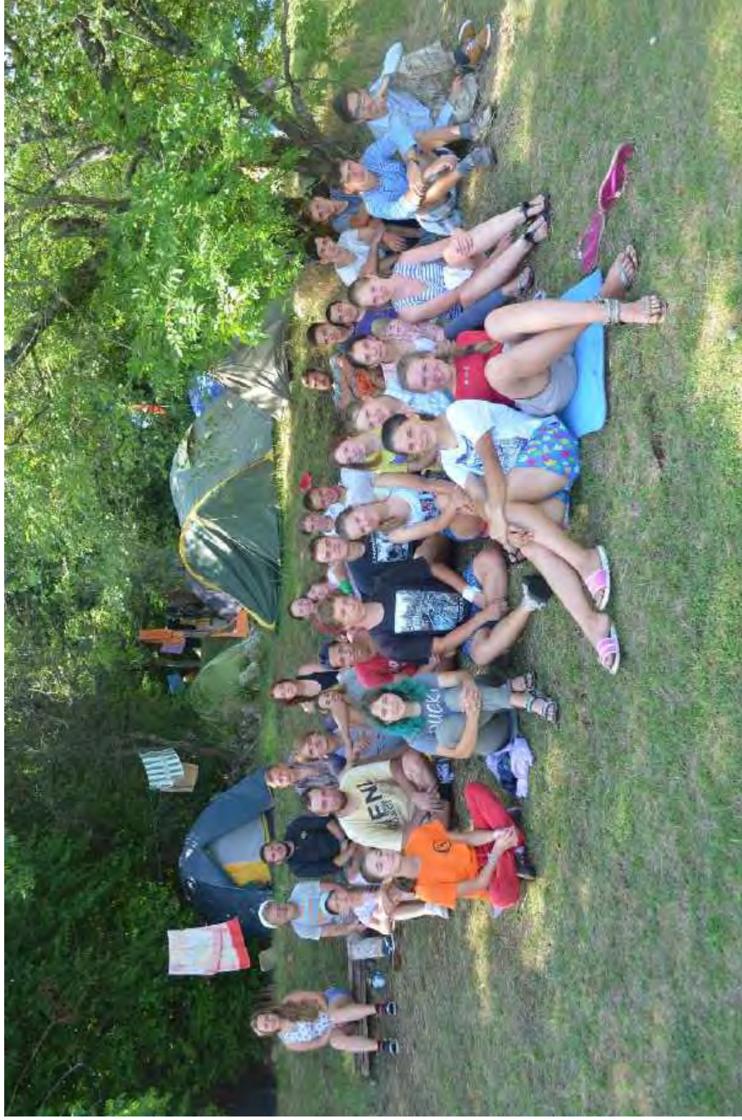
Первокурсники на археологической практике. Мангун. 2018 г.