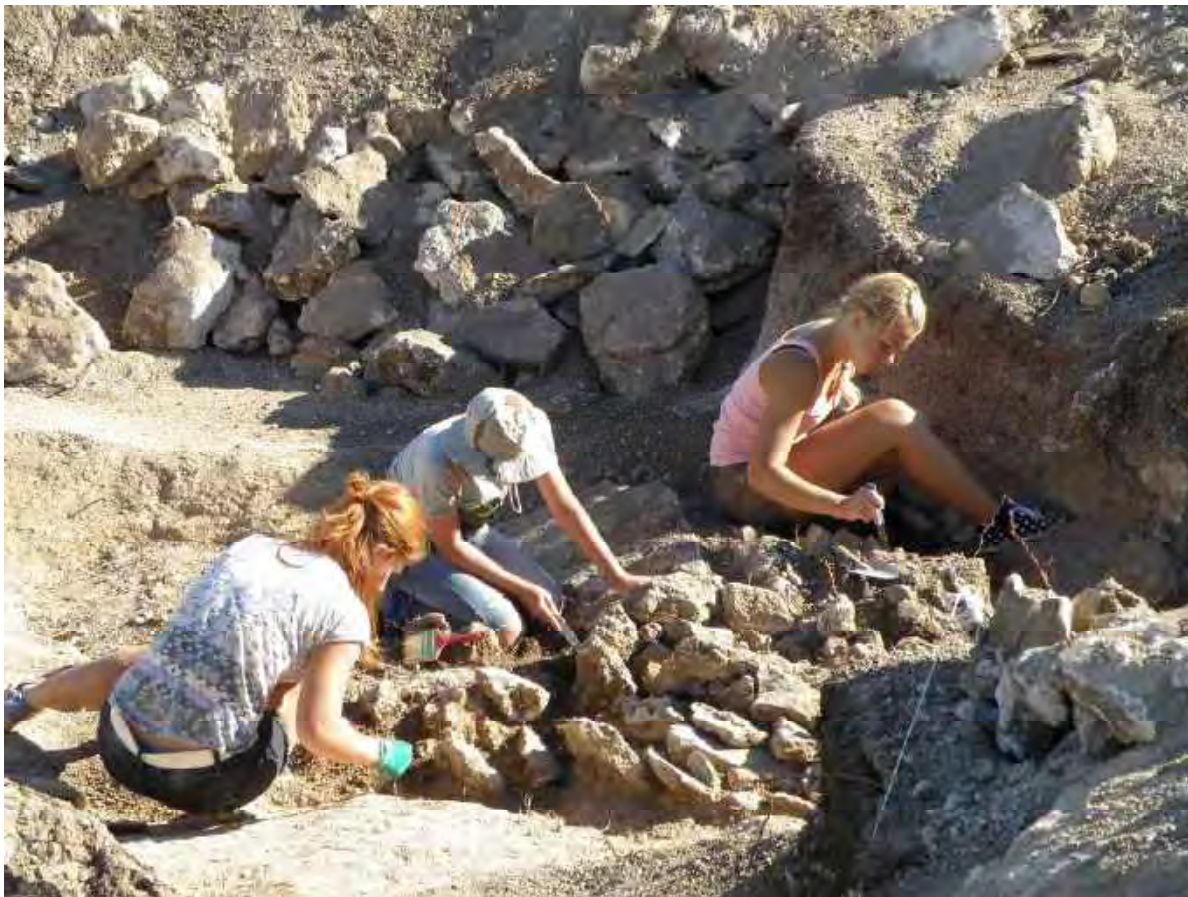
Первокурсники на археологической практике. Опушки. 2016 г.

Археологами проведены охранные археологические работы на могильниках и городищах Алуштинского, Симферопольского, Бахчисарайского районов, что позволило уточнить ряд вопросов, связанных с изучением материальной культуры позднеантичного и раннесредневекового населения Таврики, спасти от разрушения и расхищения ценные в научном и материальном отношении памятники, поступившие в государственные музейные собрания. В работе экспедиций участвовали студенты исторического факультета ТНУ, сотрудники Института востоковедения НАНУ, а также добровольцы из стран СНГ. Добытые материалы демонстрировались на выставках в Симферополе, Германии, Италии, Франции.