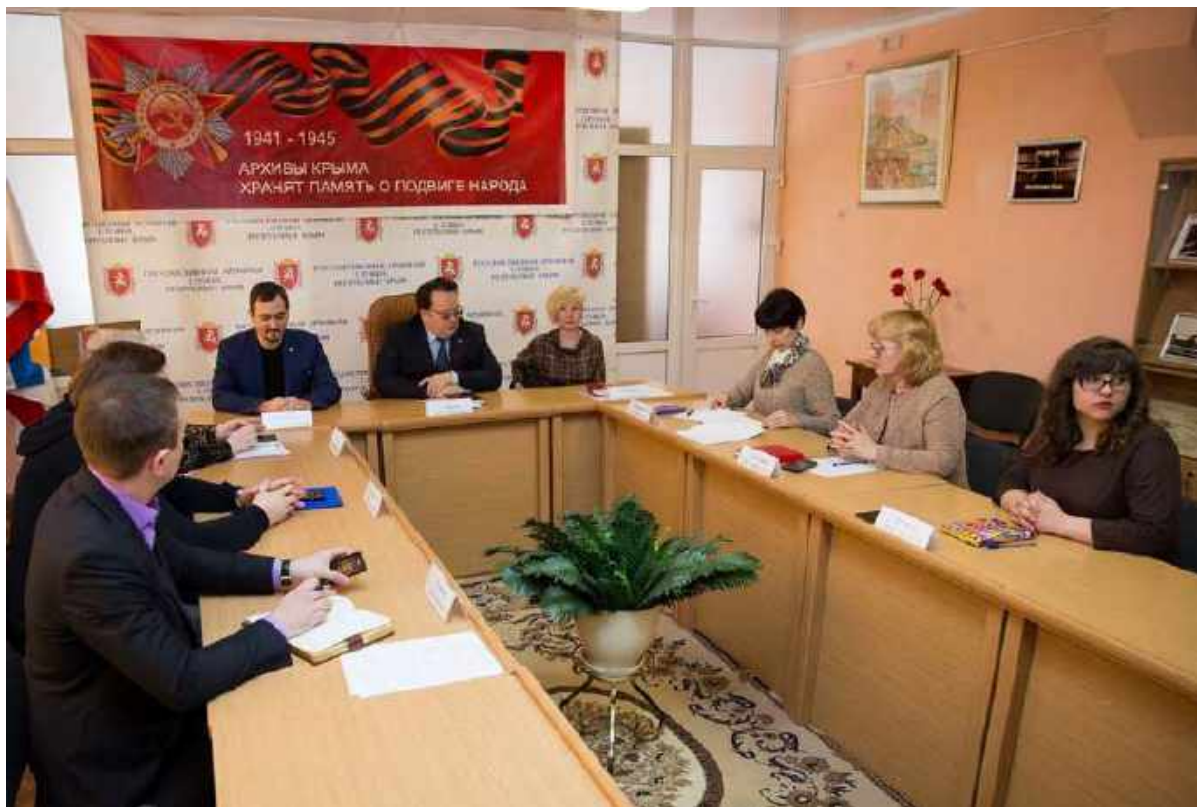
На заседании Круглого стола «Перспективы развития генеалогических исследований в Республике Крым». 2017 г.