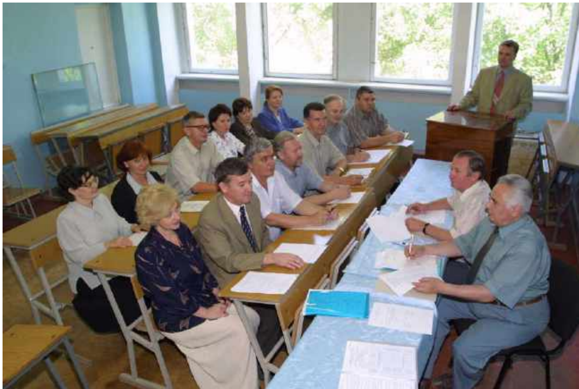
Подведение итогов работы Государственной экзаменационной комиссии. 2004 г.

Как и раньше, в установленные сроки проводились аттестации студентов дневного отделения. Их результаты анализировались методической комиссией, в своих отчётах рекомендовавшей педагогам требовать от студентов более глубокого изучения источников, специальной литературы, серьёзнее готовиться к семинарским занятиям.