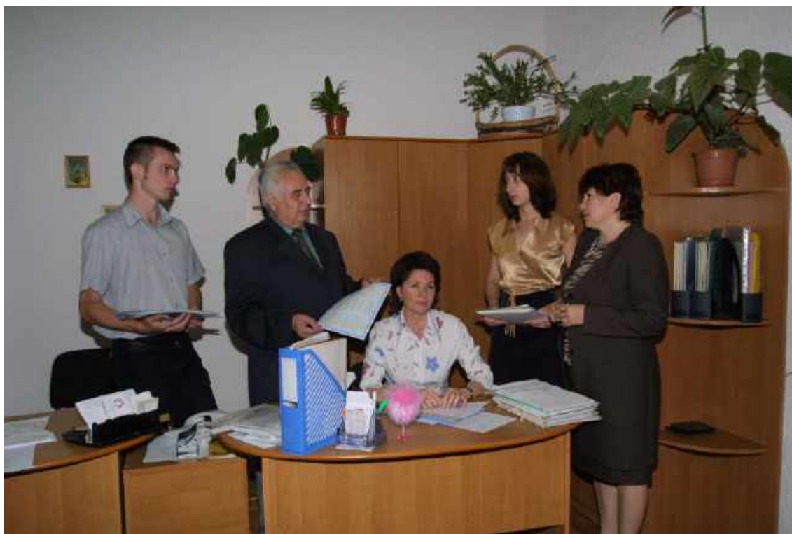
Рабочие будни деканата. 2004 г.