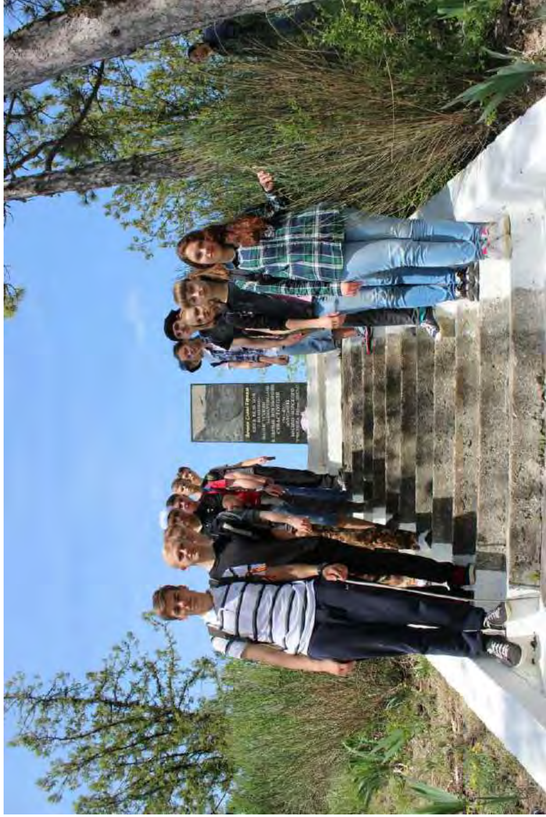
Студенты-историки у памятника курсантам военно-морского училища береговой охраны. Село Мостовое (Бахчисарайский район). 2017 г.