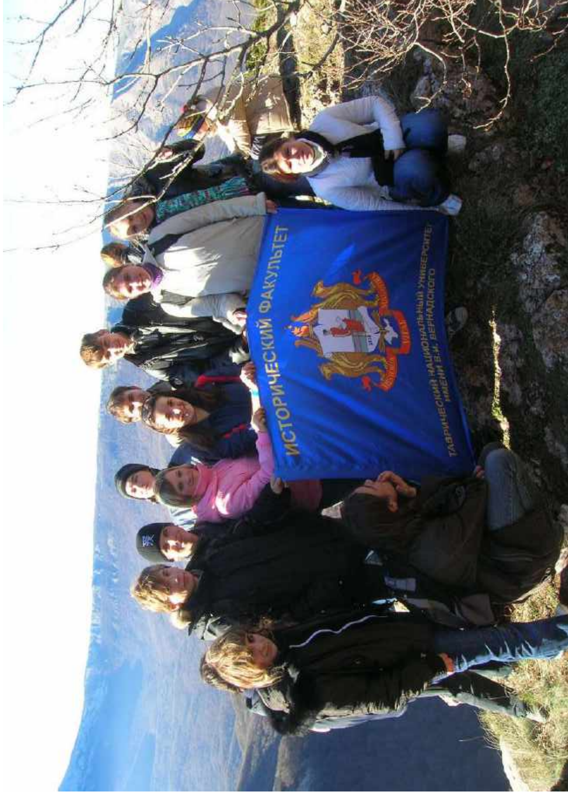
Поход студентов истфака на гору Демирджи. 2007 г.