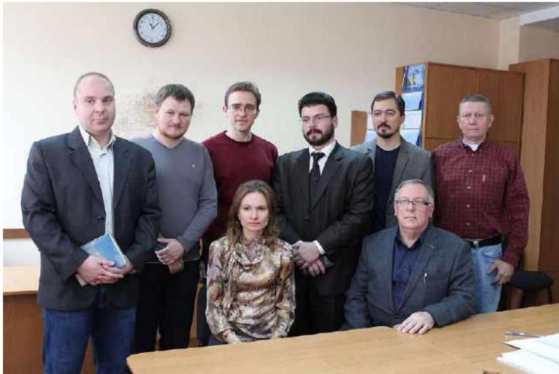
Сотрудники кафедры новой и новейшей истории.

С 2015 года в структуре Таврической академии КФУ кафедра новой и новейшей истории вышла на новую траекторию своей эволюции. На её основе происходит становление академического центра по изучению региона «Большой Ближний Восток».