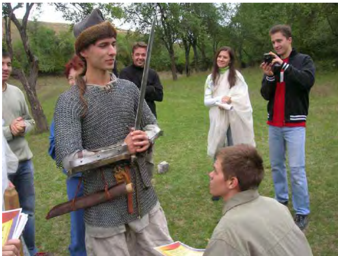
Посвящение первокурсников в историки. 2008 г.