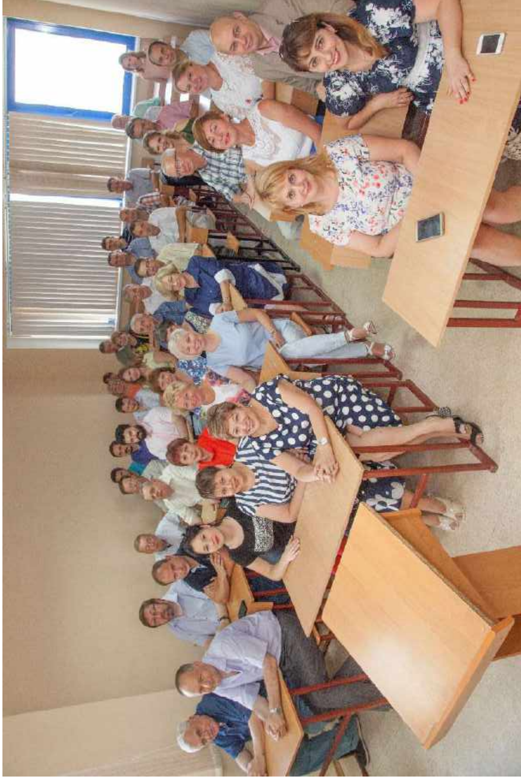
На расширенном заседании Учёного совета исторического факультета. 2018 г.