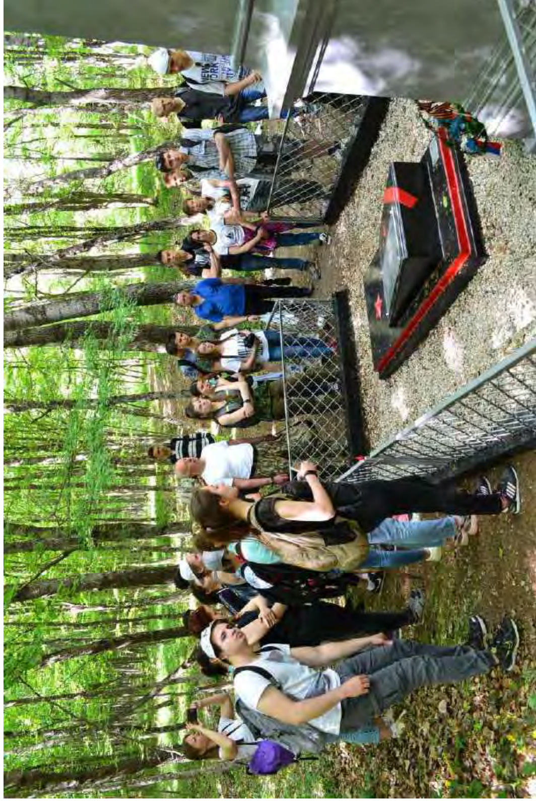
Студенты истфака на возложении венка к братской могиле партизан. Район села Соколиное (Бахчисарайский район). 2018 г.