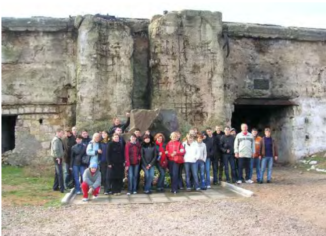
Экскурсия на 35-ю батарею в Севастополе. 2006 г.