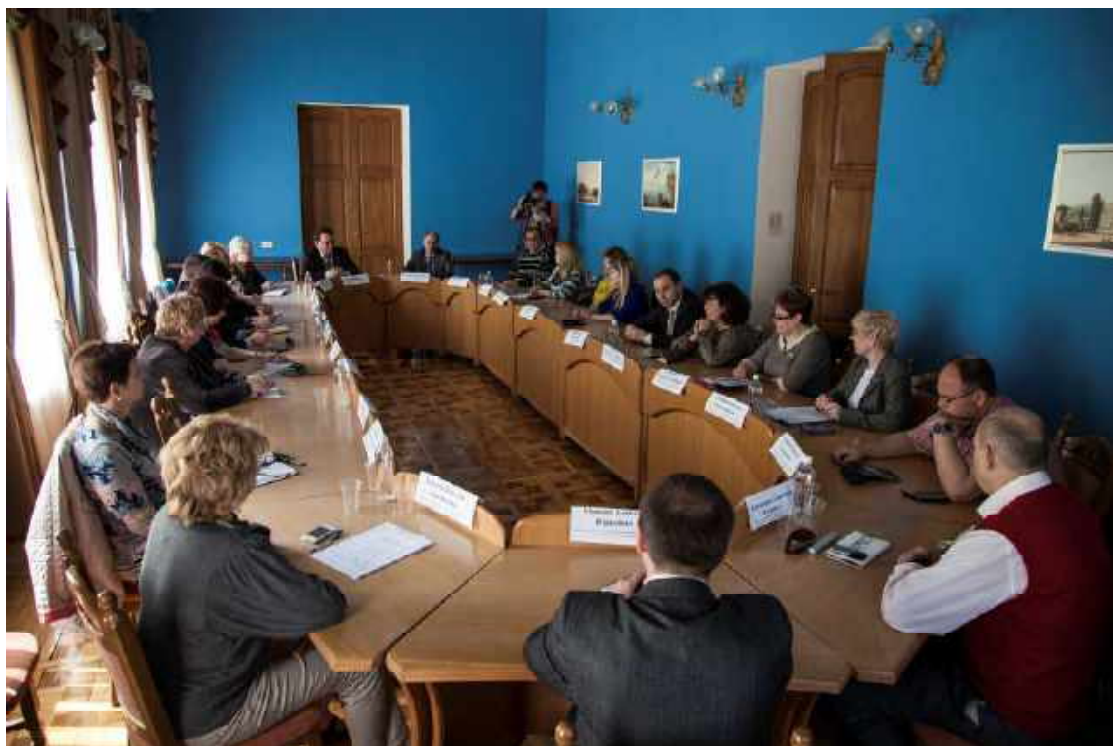
На заседании Круглого стола «Проблемы и перспективы подготовки специалистов в области архивоведения». 14 апреля. 2016 г.