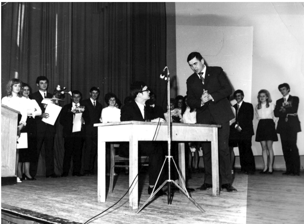
Студенты представляют шутливую сценку на празднике День факультета. 1970-е гг.