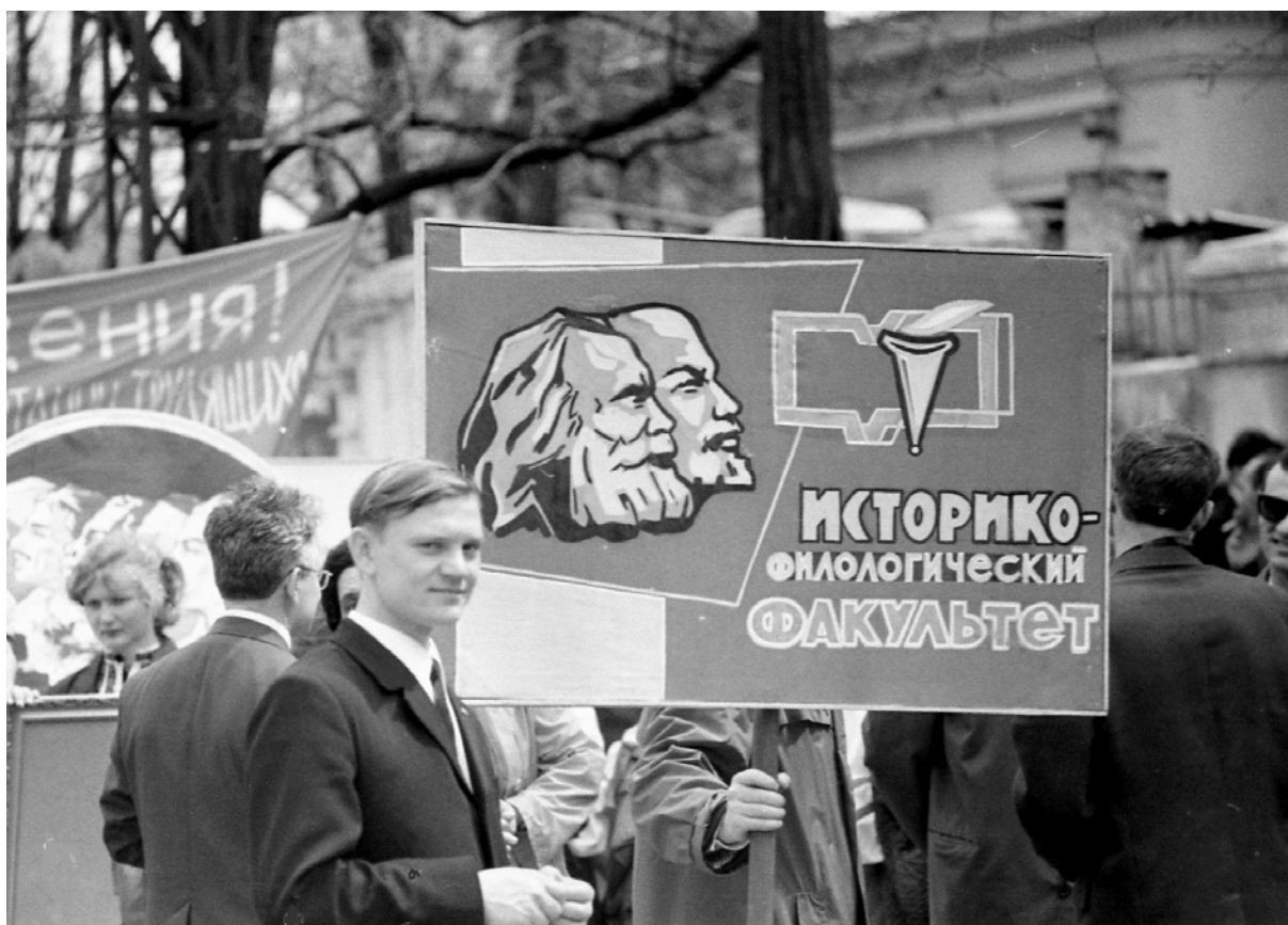
Студенты-историки на первомайской демонстрации. Конец 1960-х гг.