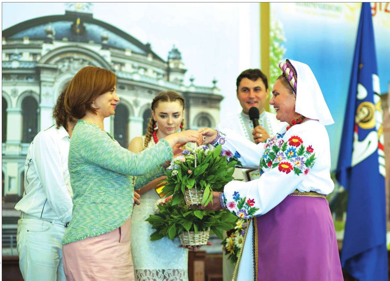
3 нагоди Всеукраїнського дня родини в Колонній залі столичної мерії привітали творчі та багатодітні сім'ї міста

■ У столичній адміністрації вшанували творчі та багатодітні сім'ї міста