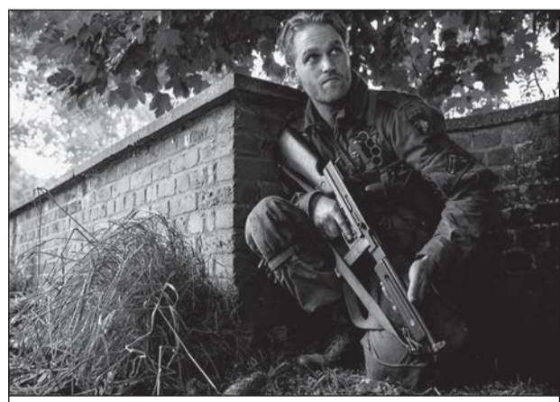
Уайт Рассел в фильме «Оверлорд»