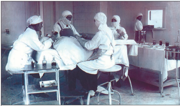
Новое хирургическое отделение 1-й горбольницы, операционная. 1934 год