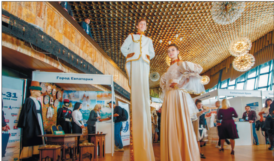
ЛЮДИ, ЧЕЛОВЕКИ. ДОБРЫЕ НЕСКАЗКИ

По информации туристско-информационного центра Евпатории.