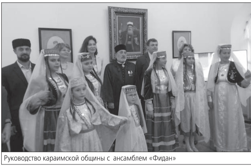
Руководство караимской общины с ансамблем «Фидан»