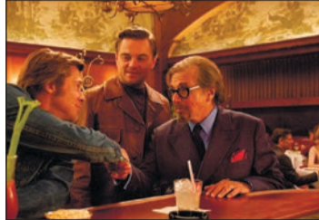
Кадр из фильма «Однажды в... Голливуде»