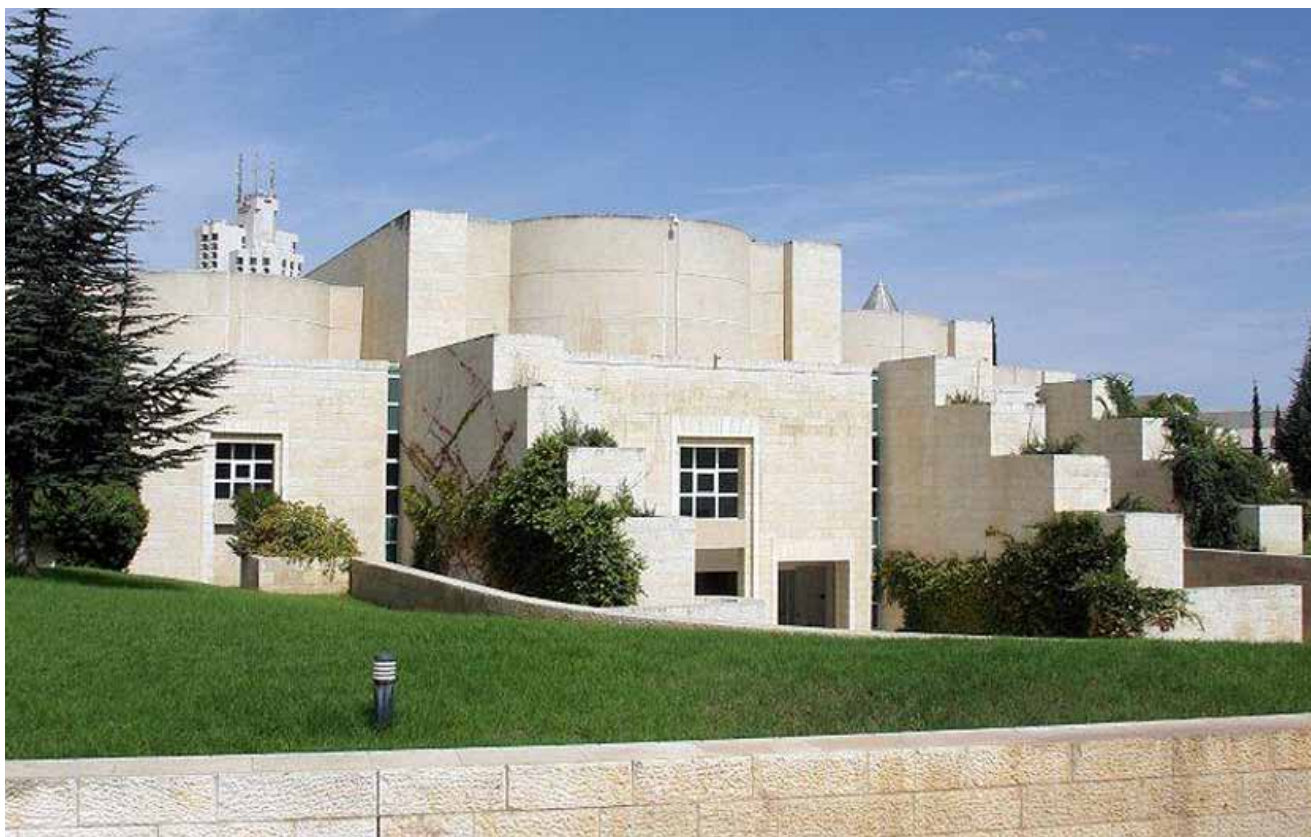
בית המשפט העליון בירושלים. "יש לנו מערכת שיפוטית יציבה וחזקה מאד"