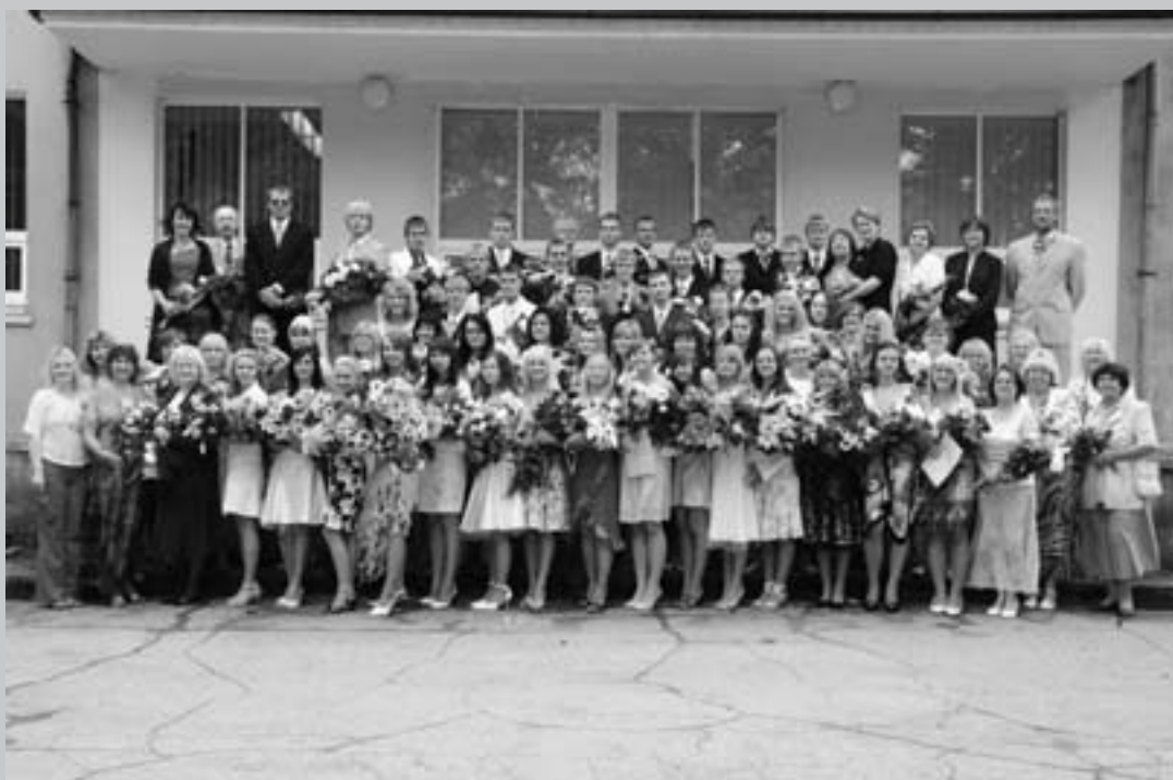
Kose Gümnaasiumi lõpetajad