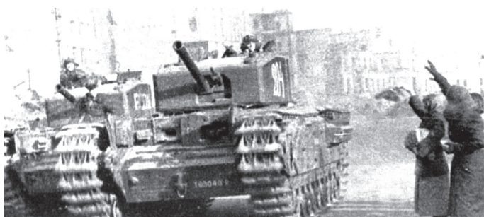
Танки «Черчилль III» британського виробництва з 48-го полку важких танків рухаються вулицями Києва, листопад 1943 р.