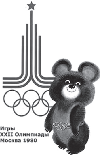
Ігри XXII Олімпіади Москва 1980

Швидка індустріалізація світу, відтак різко зрослий попит на паливо, значить, на нафту, несподівано дали Радянському Союзу гігантські доходи – «нафтодолари», пізніше – споріднені з ними доходи й від продажу газу. Втім, життєвий рівень населення Союзу і далі залишався злидним.