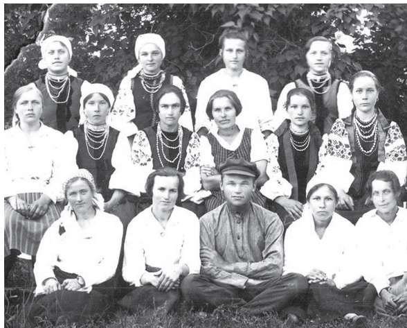
Святковий день. Журавка. Варвинщина. 1929 рік.

Сайт журналу «Прилуки.Фортиця». Pryluky.Fortress.