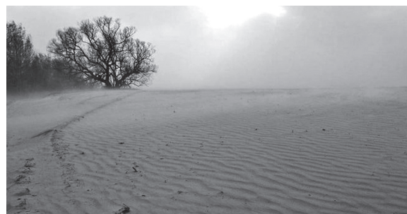
Це не пустеля Сахара в Африці. Це поле на околиці райцентру Семенівка на Чернігівщині – після недавньої пилкової бурі.

давно збудовані водосховища для промислових об'єктів у Брянській області, на кордоні з Чернігівщиною, Україною.