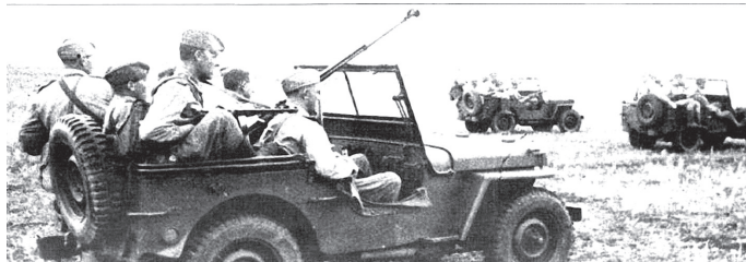
Радянська механізована частина, оснащена американськими джипами «Вілліс», Центральний фронт, липень 1943 р.