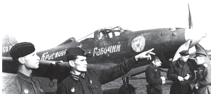
Льотчики 21-го гвардійського винищувального авіаполку біля американського винищувача Р-39 «Аерокобра», травень 1943 р.

Назавгал ленд-ліз, як пише І. Дерейко, забезпечував потреби Червоної армії та радянської промисловості на 16% у бронетанкової техніці, 15,3% — у літаках, 32,4% — у бойових кораблях, 18,4% — у зенітній артилерії, понад 80% — у радіолокаційній апаратурі, 20,6% — у тракторах, 23,1% — у металообробних станках, 42,1% — у паровозах, 66,1% — у вантажних і легкових автомобілях, 80% — у медикаментах і медичному устаткуванні, біль-