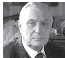
Олег БАСИЛАШВИЛІ, актор театру і кіно