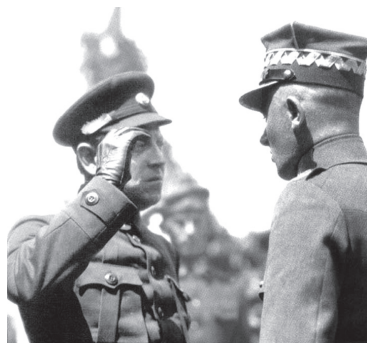
Симон Петлюра вітає польського генерала Ридз-Смігли у визволеному від російських більшовиків Києві. 10 травня 1920 року.

Угода викликала невдоволення значної частини українського політикуму, особливо в Західній Україні. Згодом Симон Петлюра так пояснює