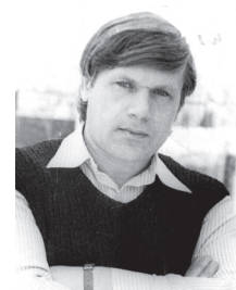
Автор цих рядків у 1980-му