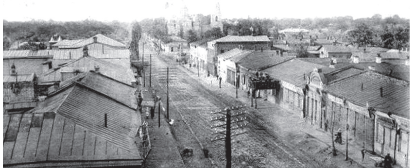
Конотоп.—Конотоп. № 1. Общий видъ города.

контрибуцію на місто, а перед відступом вимагали ще 100 тисяч карбованців, які необхідно було зібрати за кілька годин, бо через наближення німців місто «доживає останні дні свободи й контрибуція, що її накладено, як видно, буде для нього останньою, а тому про пониження суми контрибуції не може бути й мови. Гроші надто потрібні для виплати платні солдатом, що обороняють країну від німців». Втім, вся «оборона» полягала в намаганні вивезти якнайбільше нагробованого і панічної втечі.