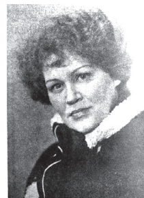
Ліна Костенко: фото в книжці «Неповторність»