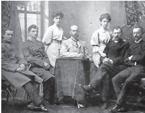
Родина Горільченків. Варвинщина. 15 листопада 1908 року.