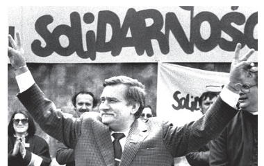
Польща, «Солідарність», Лех Валенса

...У серпні 1980-го в Польщі відбувся страйк на судноверфі у Гданську, який поширився країною.