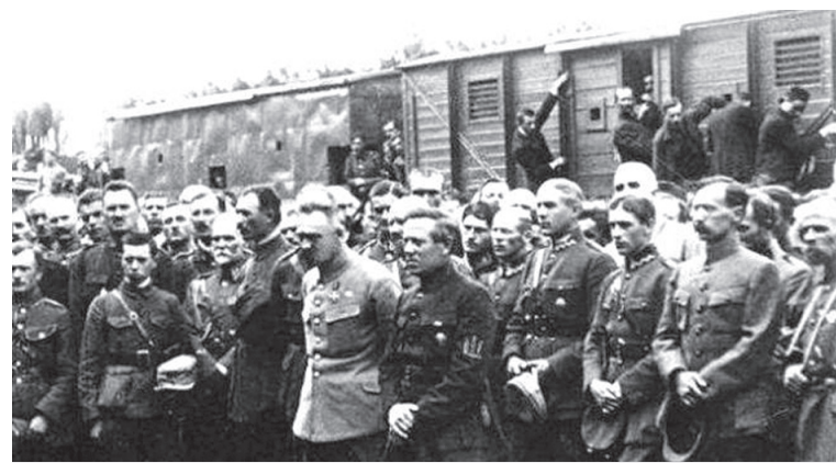
Юзеф Пілсудський і Симон Петлюра на вокзалі в Станіславі (Івано-Франківську). 1920 рік.

Та все ж завдяки українсько-польському союзу Польська держава змогла відстояти незалежність, була знята більшовицька загроза