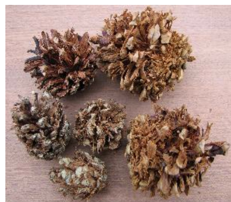
grote bonte specht

Volg het pad en ga circa 25 meter na het begin van het 2e bosperceel aan de linkerkant naar rechts. Vervolgens nog een keer rechts en dan links het pad in dat naar beneden loopt. Ga rechtdoor tot aan het kruispunt.