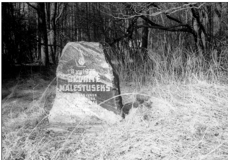
Letipea ohvrite mälestuskivi.

Apelli autoriteks on peetud Eesti geograafe ja ökolooge, kes olid mures Põhja-Ees-