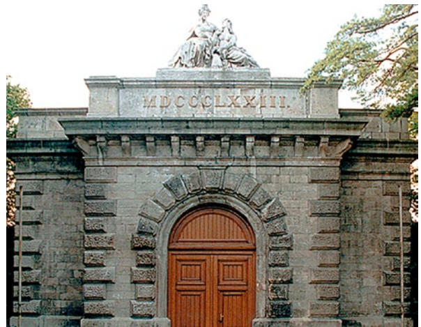
Eingangportal des Wasserbehälters Rosenhügel

Für die Reinheit des Quellwassers ist es außerordentlich wichtig, das Einzugsgebiet vor Verunreinigungen zu schützen. Aus diesem Grund wurde das Rax-Schneeberg-Schneealpen-Massiv 1965 unter wasserrechtlichen Schutz gestellt.