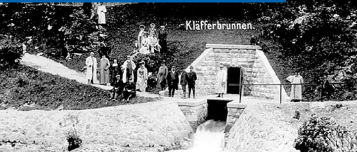
Besuch des Bürgermeisters Lueger bei der Kläfferquelle