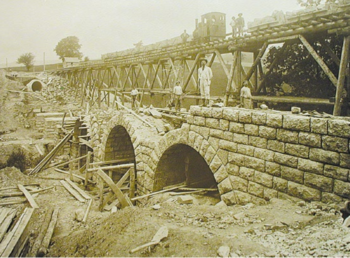
Bau eines Aquäduktes an der II. Hochquellenleitung

Das rasante Ansteigen der Bevölkerungszahl Wiens nach 1890 machte es notwendig, neue Wasserreserven zu erschließen. Im Jahr 1900 beschloss der Wiener Gemeinderat auf Initiative von Bürgermeister Dr. Karl Lueger, eine zweite Hochquellenleitung zu errichten. Der städtische Ingenieur Oberbaurat Dipl.-Ing. Dr. Karl Kinzer „entdeckte“ die dafür notwendigen Quellen und deren Wasserreichtum im Hochschwabgebiet.