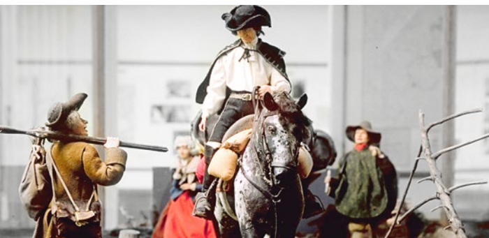
Wasserreiter brachten das Quellwasser an den kaiserlichen Hof

Aus dem Raum südlich von Wien ließen die Römer Quellwasser ins Legionslager Vindobona leiten. Die Tagesleistung betrug etwa 5.000 Kubikmeter. Das Mittelalter brachte, wie in allen technischen Bereichen, auch einen Rückschritt in der Wasserversorgung. Bis ins 16. Jahrhundert versorgte sich die Bevölkerung über Hausbrunnen mit Trinkwasser. Im Jahr 1525 brach in Wien ein Großbrand aus.