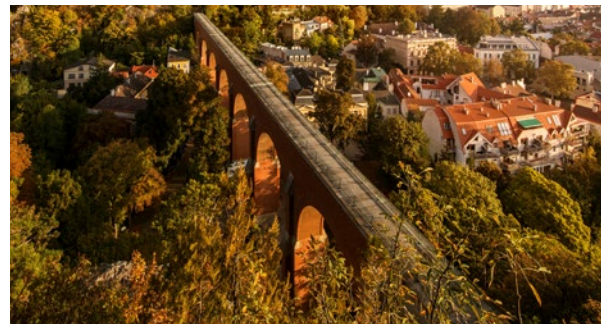
Aquädukt an der I. Hochquellenleitung in Mödling

Durch intensive Kontrollen der Hausinstallationen und die Sanierung des Rohrnetzes konnte eine wesentliche Reduzierung des Wasserverbrauchs erreicht werden. Nach Behebung der beanstandeten Undichtheiten liegen die Wasserverluste in Wien heute zwischen 8 und 10 Prozent, was im internationalen Vergleich sehr niedrig ist. Die Gesamtlänge der öffentlichen Rohrstränge in Wien beträgt heute mehr als 3.000 km.