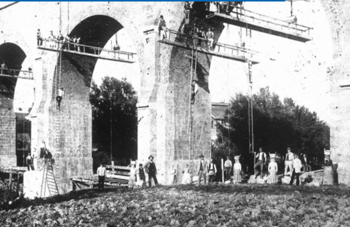
Arbeiterinnen und Arbeiter beim Bau der I. Hochquellenleitung

Um die Mitte des 19. Jahrhunderts hatte die Versorgung Wiens mit mangelhaftem Trinkwasser Typhus- und Choleraepidemien zur Folge. Ein Vorschlag war, Wasser aus den ufernahen Grundwasserströmen der Donau und ihrer Nebenflüsse oder aus stadtnahen Quellen zu gewinnen. Die Idee wurde jedoch verworfen. Am 12. Juli 1864 fasste der Wiener Gemeinderat den Beschluss zum Bau der I. Wiener Hochquellenleitung.