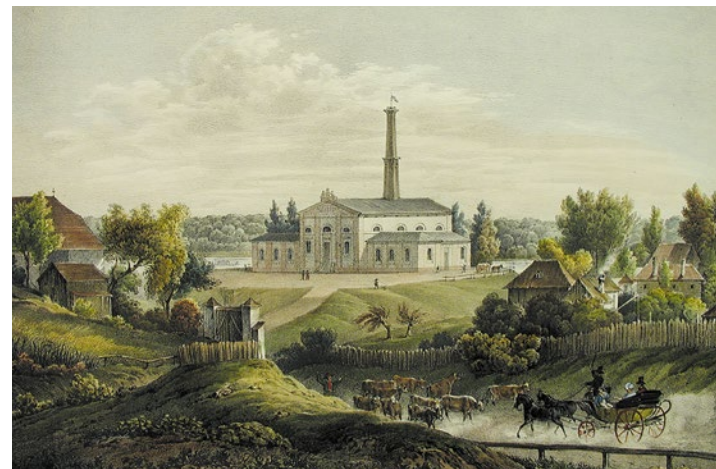
Maschinenhaus der Kaiser-Ferdinands-Wasserleitung

Mitte des 19. Jahrhunderts gab es nur 4 bis 5 Liter Wasser pro Tag und pro Kopf für die 326.000 Einwohnerinnen und Einwohner Wiens. Der Großteil der Bevölkerung versorgte sich noch immer über Hausbrunnen. Die „Albertinische Wasserleitung“ (1804) bildete den Auftakt zu einer umfassenderen Lösung der Wiener Wasserversorgungsprobleme. Mit dem Bau der „Kaiser-Ferdinands-Wasserleitung“ (1841) versuchte die Stadtverwaltung der drückenden Wasserknappheit zu begegnen.