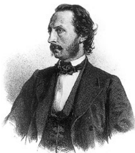
Prof. Eduard Suess

Um die Mitte des 19. Jahrhunderts hatte die Versorgung Wiens mit mangelhaftem Trinkwasser Typhus- und Choleraepidemien zur Folge. Ein Vorschlag war, Wasser aus den ufernahen Grundwasserströmen der Donau und ihrer Nebenflüsse oder aus stadtnahen Quellen zu gewinnen. Die Idee wurde jedoch verworfen. Am 12. Juli 1864 fasste der Wiener Gemeinderat den Beschluss zum Bau der I. Wiener Hochquellenleitung.