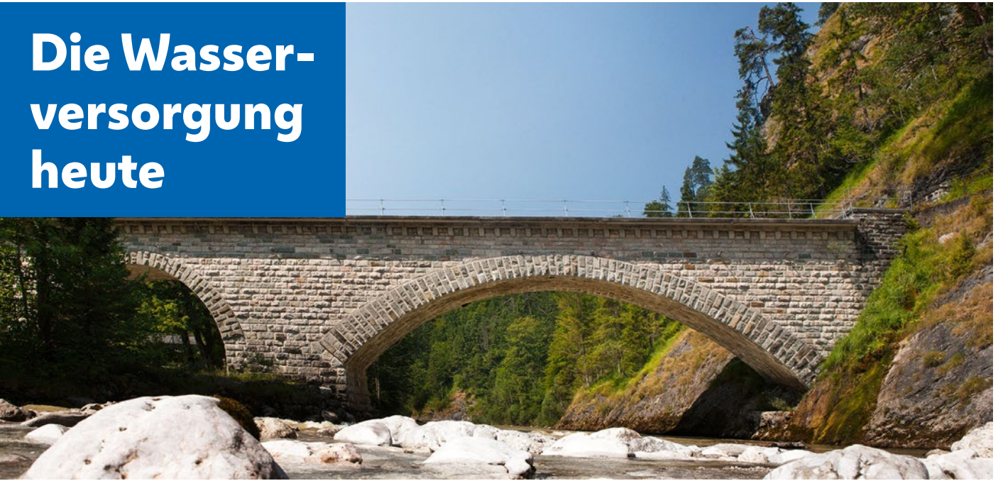
Aquädukt der II. Hochquellenleitung an der Salza

Die Stadt Wien wird im Normalbetrieb flächendeckend mit Hochquellwasser versorgt. Tag für Tag sind das durchschnittlich rund 400 Millionen Liter. Alle Wiener Haushalte sind an die öffentliche Wasserversorgung angeschlossen. Das Trinkwasser stammt aus der I. und II. Hochquellenleitung. Nur im Falle eines extrem hohen Wasserverbrauchs in Hitzeperioden oder während Wartungsarbeiten an den Hochquellenleitungen ist eine zusätzliche Einleitung von Grundwasser nötig.