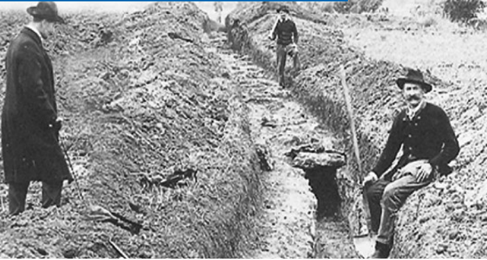
Ausgrabung einer römischen Wasserleitung 1907

Aus dem Raum südlich von Wien ließen die Römer Quellwasser ins Legionslager Vindobona leiten. Die Tagesleistung betrug etwa 5.000 Kubikmeter. Das Mittelalter brachte, wie in allen technischen Bereichen, auch einen Rückschritt in der Wasserversorgung. Bis ins 16. Jahrhundert versorgte sich die Bevölkerung über Hausbrunnen mit Trinkwasser. Im Jahr 1525 brach in Wien ein Großbrand aus.