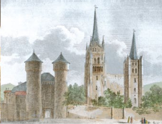
Gravure de la cathédrale XVIII e