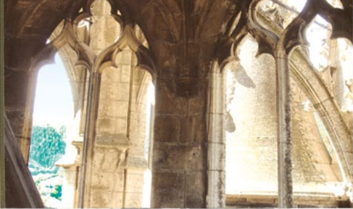
Le grand clocher et son architecture