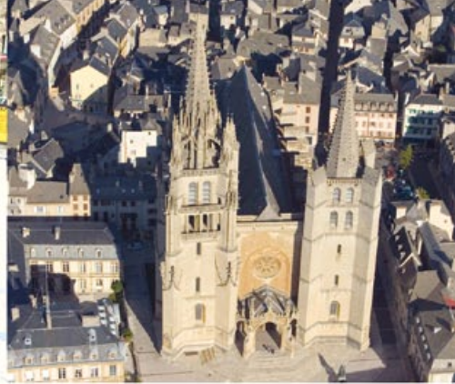
Cathédrale vue du ciel