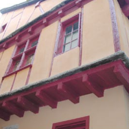
Maison à pans de bois, rue de l'Arjal

Au XIX e siècle, Mende est le premier chef-lieu à s'équiper de l'éclairage électrique public (1888), dans le même temps, elle voit son industrie textile décliner, pour disparaître au XX e siècle. La ville reste principalement le centre administratif du département. Cette petite ville au charme provincial suranné est entrée dans le XXI e siècle en gardant sa sérénité. Elle séduit de plus en plus de privilégiés. Nous vous invitons à découvrir pourquoi les hommes ont choisi ce site depuis des millénaires pour y inscrire leur histoire.