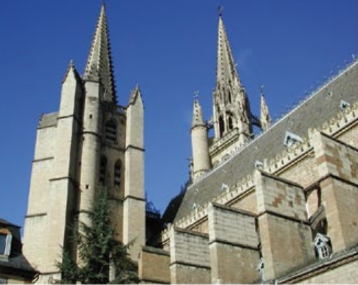
Cathédrale vue de la place Chaptal