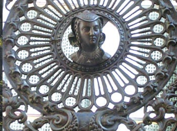
Balcon ouvragé du XIX e siècle, rue de la Liberté