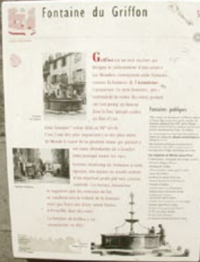
Une des 28 bornes du circuit