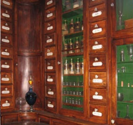
Pharmacie de l'ancien hôpital