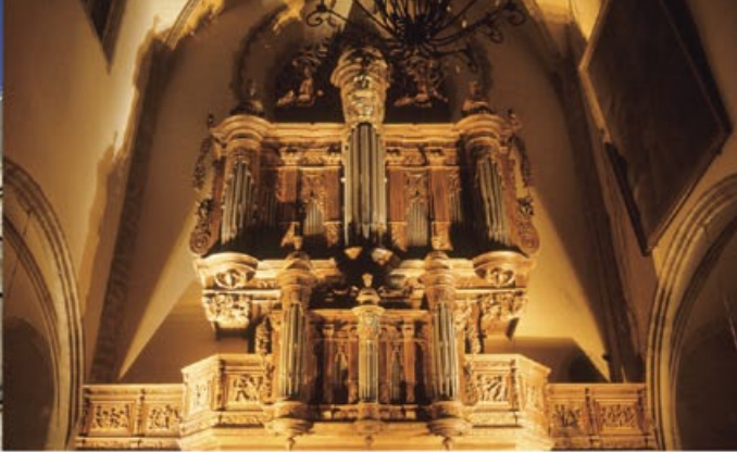
Orgue de la cathédrale, XVII e siècle