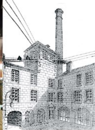
Affiche de l'usine d'électricité, XIX e s.