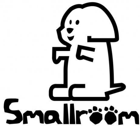
รูปที่ 3.1 ตราสัญลักษณ์บริษัท สมอลล์รูม จำกัด