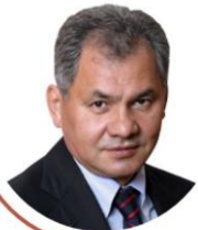
СЕРГЕЙ ШОЙГУ Министр обороны Российской Федерации