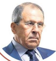
СЕРГЕЙ ЛАВРОВ Министр иностранных дел Российской Федерации