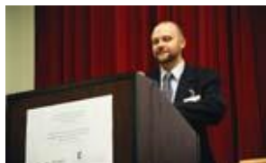
Московская конференция по нераспространению