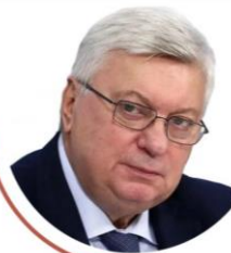
НИКОЛАЙ ТОРШОВ , ректор МГИМО МИД РФ