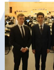
Участие молодежи в процессе ДНЯО