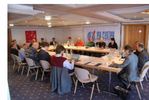
Российско-американский семинар по ИЯП, Гштаад