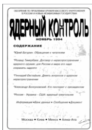
Ядерный контроль – Индекс Безопасности (с 1994 года)