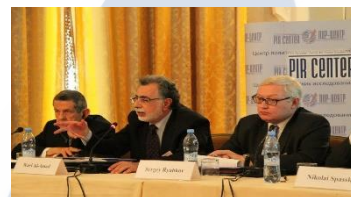
Конференция ПИР-Центра по ЗСОМУ на Ближнем Востоке