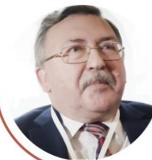
МИХАИЛ УЛЬЯНОВ , постоянный представитель РФ при международных организациях в Вене