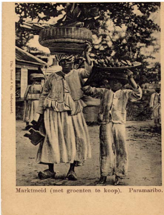
Marktmeid (met groenten te koop). Paramaribo.

Sommige marktverkoopsters waren blootvoets anderen droegen een tiptip van hout met een rubberenband erover of nagemaakte Hollandse boerenklompen. Hun kleding bestond uit een wojokoto.