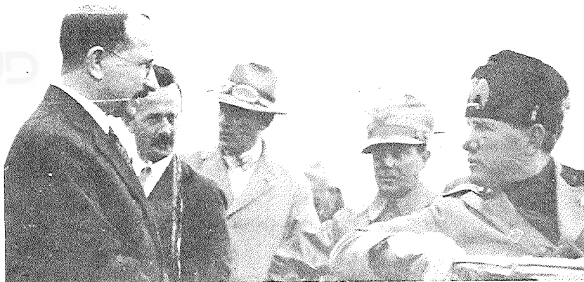
מוסוליני בלוב בשנת 1926, בביקור בחווה החקלאית של חלפאלה נחום (ראשון משמאל)