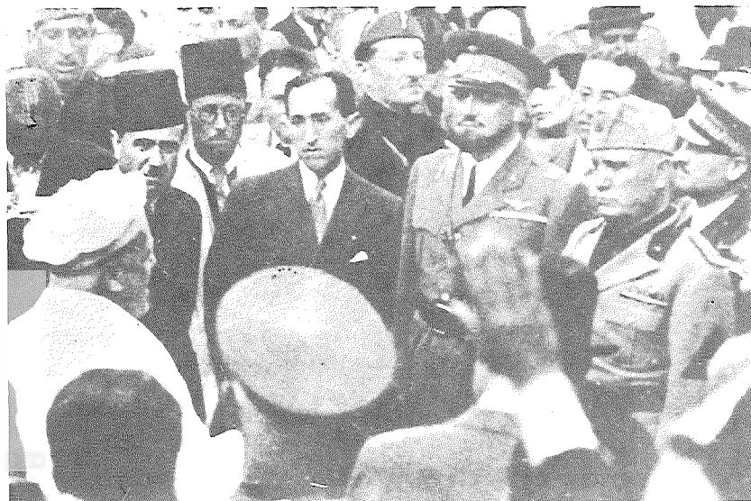
למעלה: מוסוליני ולידו מושל לוב, מארשאל איטאלו באלבו, בפגישה עם הרב הראשי של לוב, הרב אלדו לאטס (עם הגב למצלמה). למטה: הרובע היהודי בטריפולי לקראת ביקור מוסוליני ב-1937