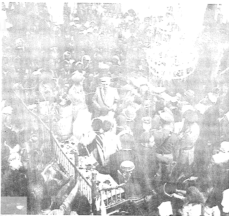
חיילים מא"י בבית-הכנסת 'צלא כבירה' בטריפולי, באחרון של פסח תש"ג, כ-3 חודשים לאחר שחרורה

ששהו במחנות-הסגר ובמחנות-עבודה פיתחו בדרך-כלל יחסים תקינים עם שומריהם האיטלקים, וסבלם נבע בעיקרו מתנאים סביבתיים קשים ומתזונה לקויה, אבל כמעט לא מהתעללות מכוונת מצד האיטלקים. הסבל גבר כאשר נקלעו יהודים לובים לשליטתם של גרמנים בתוניסיה ובאירופה, אך במקומות גירושם באירופה הם זכו ליחס מועדף בזכות נתינותם הבריטית ורובם ניצלו.