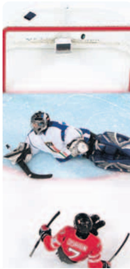
Gold ist die einzige Farbe, die zählt für Kanada. Zum Auftakt des Sledgehockey-Turniers kamen die Kanadier vor 7000 Zuschauern in der UBC Thunderbird Arena zu einem 4:0.