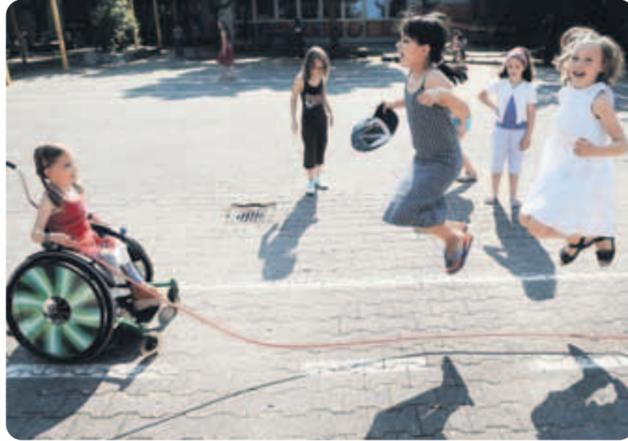
Gemeinsam durch das Leben. Die körperbehinderte Jalina spielt in der Römerstadtsschule in Frankfurt am Main in der Pause mit Klassenkameraden Seilhüpfen. Grundschulen prüfen im ganzen Land immer häufiger die Vorteile inklusiver Unterrichtsformen.

Dabei ist Integration gar nicht so schwierig. Die 19-jährige Jana Majunke ist Schülerin der Lausitzer Sportschule, Spastikerin und Doppelweltmeisterin im Radfahren. Die Sportschule bemüht sich, Men-