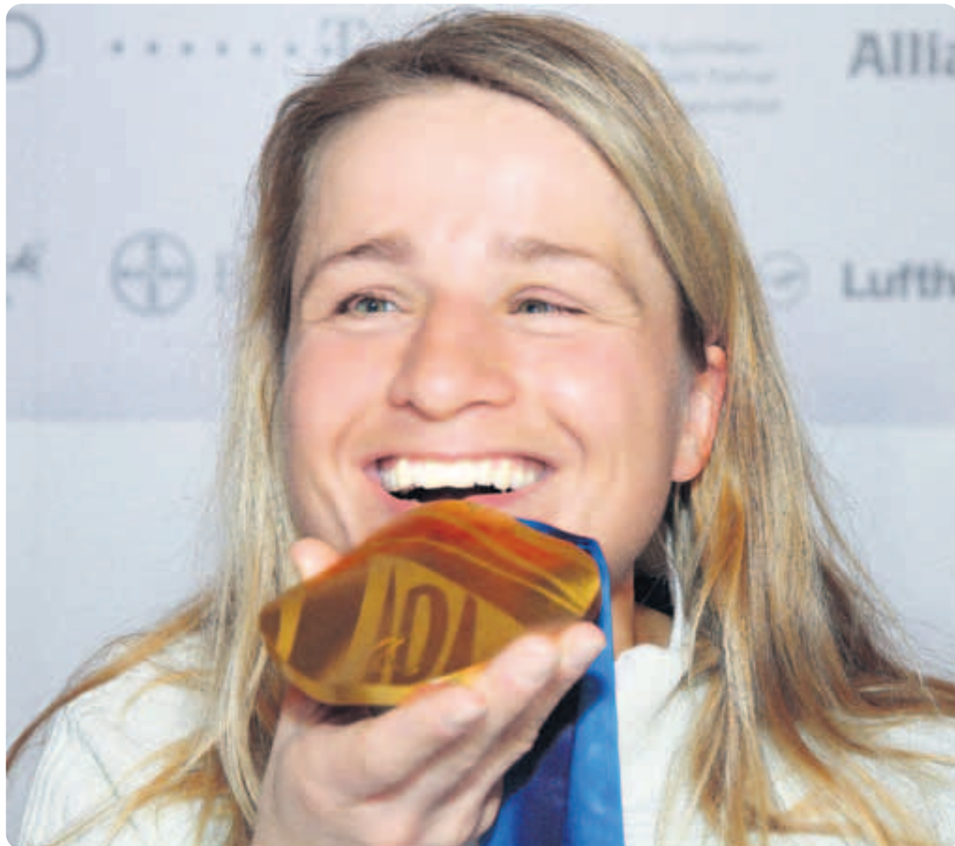
Das Strahlen der Siegerin. Die blinde Biathletin und Langläuferin Verena Bentele holt das erste Gold für Deutschland.

Kurz vor dem Abflug nach Vancouver fuhr sie noch einmal zum Trainingslager ins österreichische Toblach. Um sich den „letz-