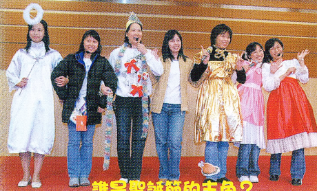
誰是聖誕節的主角？