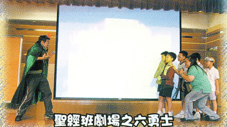
聖經班劇場之六勇士