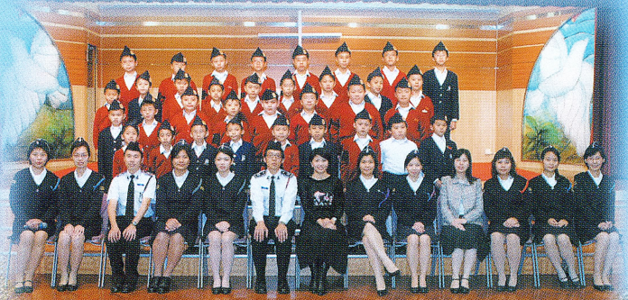
基督少年軍英姿颯颯！