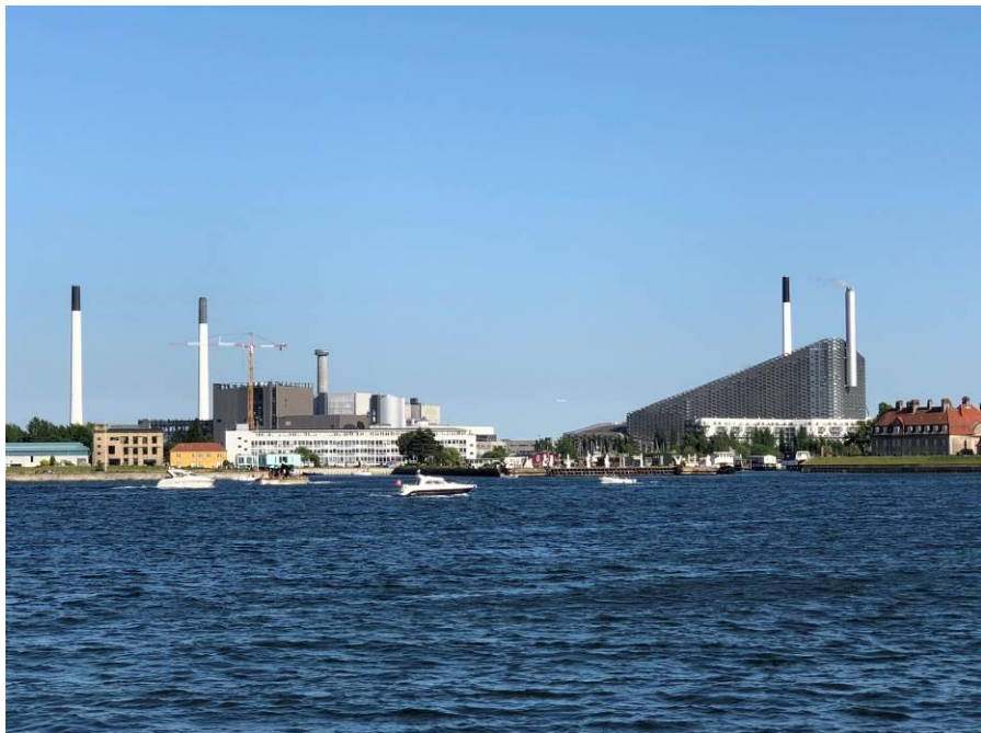
丹麦阿迈厄岛资源中心

丹麦的风力发电、秸秆发电、垃圾发电等可再生能源技术，超临界清洁高效燃煤及热电联产技术世界闻名。