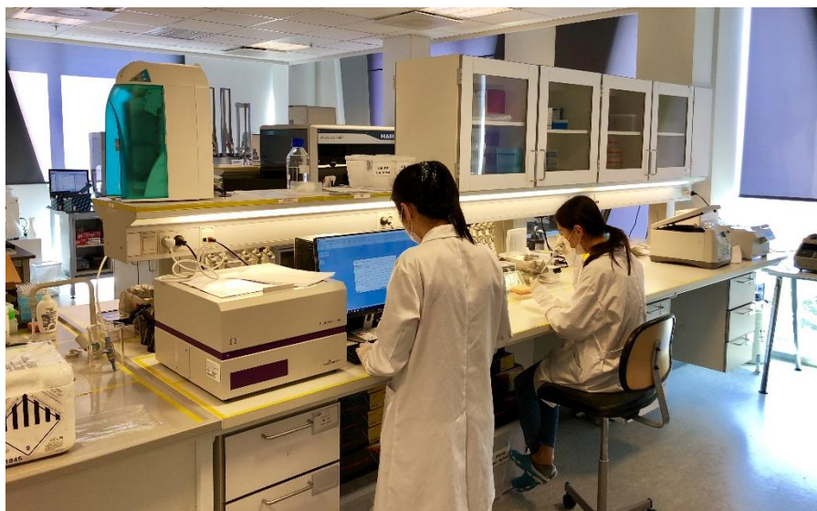
欧洲华大基因有限公司实验室

【引进项目】丹麦在可再生能源、制药等领域拥有世界领先技术，双边科技合作潜力巨大。截至2019年底，中国自丹麦引进技术和设备项目数1012个，合同金额52.5亿美元。2019年，中国自丹麦引进57个技术合同项目，合同金额2亿美元。投资领域涵盖航空、电子、通讯、有色和化工等。