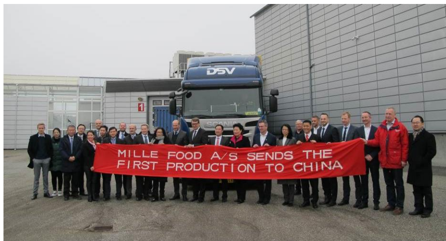
蜜儿乐儿食品有限公司

中国对丹麦投资规模不大，企业数量不多，但近年来呈现积极发展态势，民营企业主动参与，投资领域进一步拓宽，投资方式呈现多样化。据中国商务部统计，2019年中国对丹麦直接投资流量6026万美元；截至2019年末，中国对丹麦直接投资存量2.95亿美元。