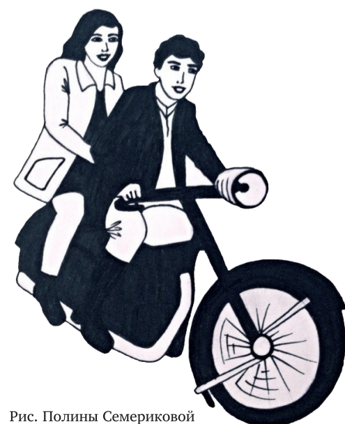
Рис. Полины Семериковой

А мы уже час ходим по этой поляне, а вокруг лес дремучий. И никаких тропок, как и попали — непонятно. В общем, на-