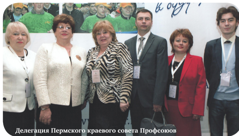
Делегация Пермского краевого совета Профсоюзом

— Это довольно сложный вопрос, и я разделил бы его на части. Во-первых, программа развития Профсоюза принимается на пять лет. То, что невозможно в нынешних условиях, вполне может быть реализовано в ближайшем будущем, когда кризис закончится. Поэтому ссылка на экономические трудности как повод отказаться от социальных обязательств перед работниками некорректна.