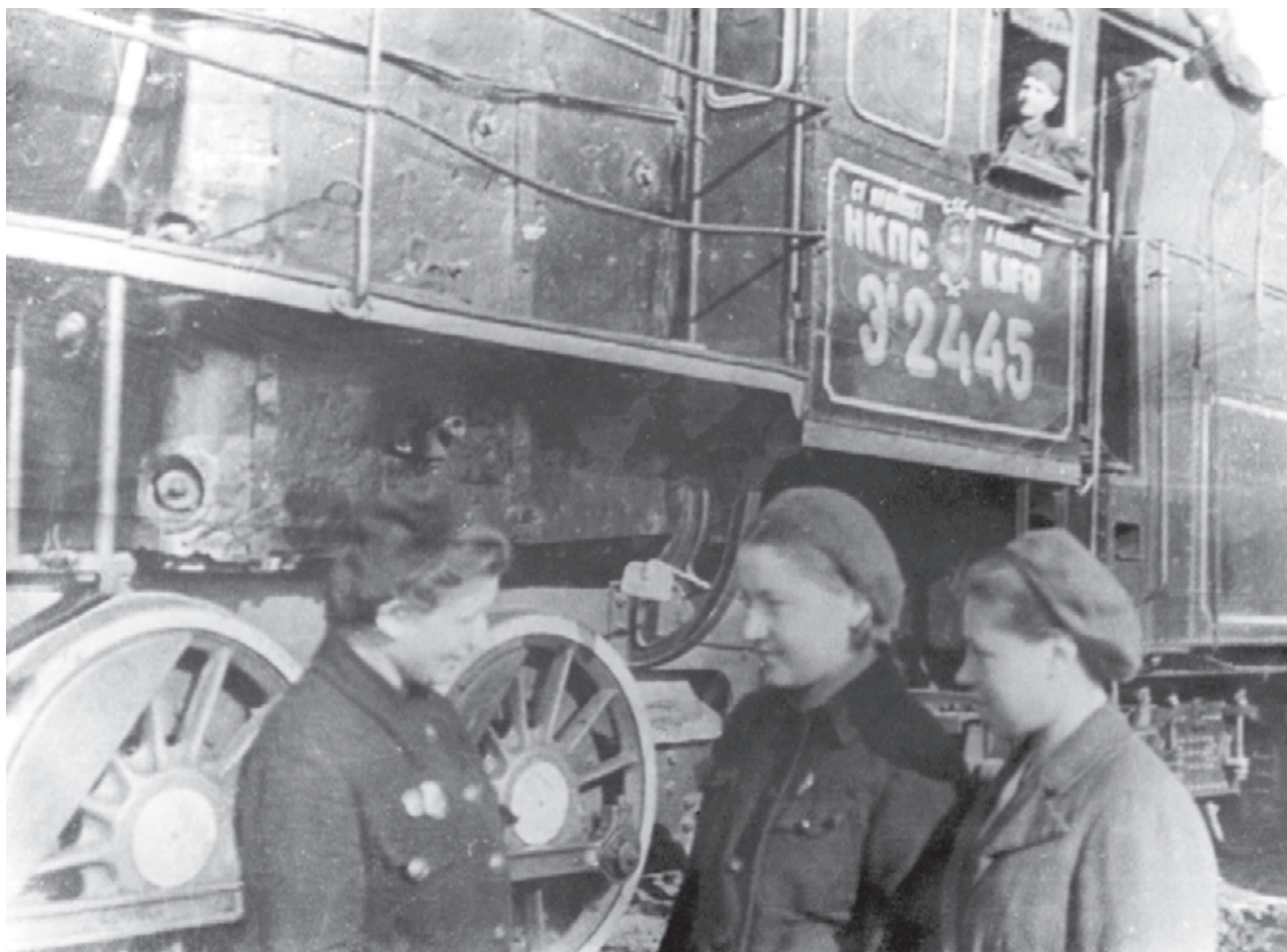
Иллюстрация 8. Женская комсомольская паровозная бригада депо «Тула». Тула. 1943 г.

ГАТО. Ф. П-5682. Оп. 1. Д. 845. Копия. Фотография ч/б.