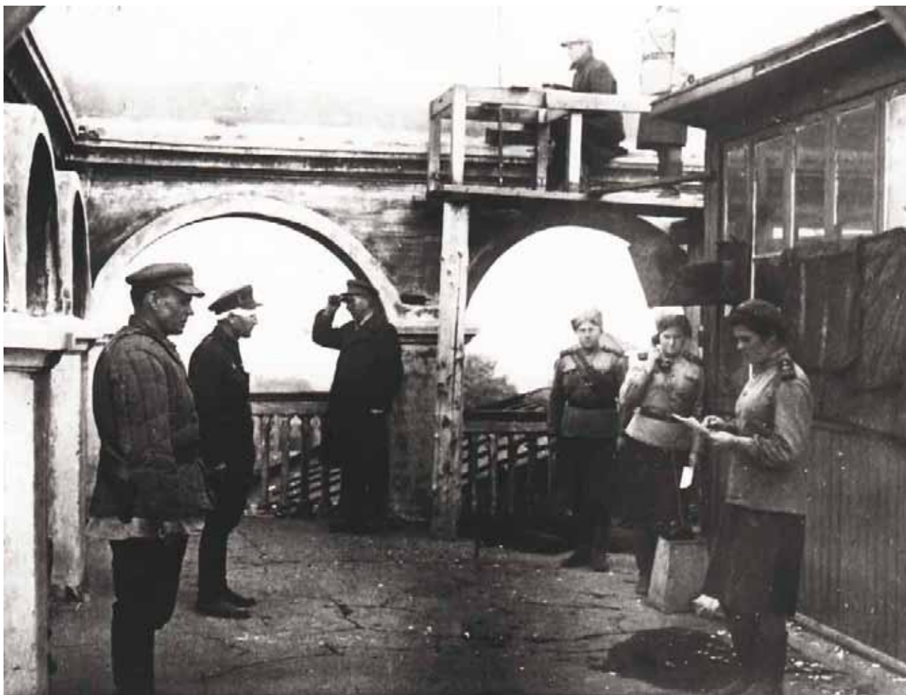
Иллюстрация 3. Бойцы и командиры МПВО Центрального района г. Тулы на боевом посту. Тула. 1943 г.

ГАТО. Ф. П-5682. Оп. 1. Д. 449. Копия. Фотография ч/б.