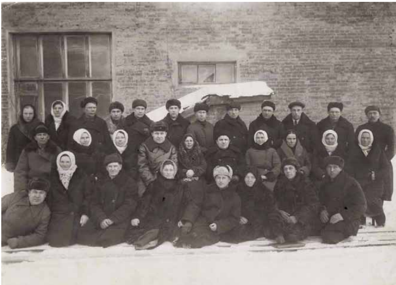
Иллюстрация 10. Делегация, сопровождающая на фронт танковую колонну «Тульский колхозник». Тула. 1943 г. ГАТО. Ф. П-5682. Оп. 1. Д. 607. Копия. Фотография ч/б.