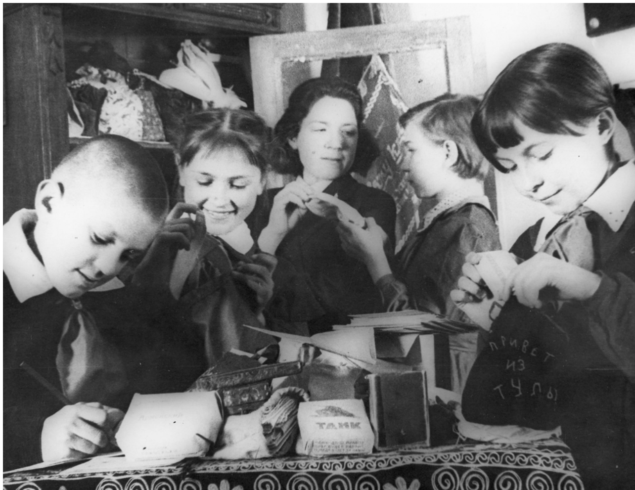
Иллюстрация 11. Пионеры-отличники 1-й средней школы г. Тулы изготавливают подарки бойцам Красной Армии. Тула. 1943 г.

ГАТО. Ф. П-6. Оп. 1. Д. 335. Л. 11-11-об. Подлинник. Рукопись. Публикуется впервые.