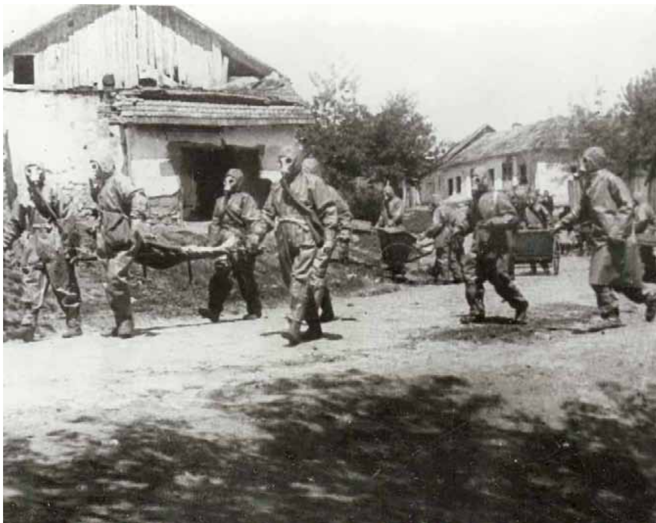
Иллюстрация 1. Занятия бойцов МПВО. Тула. 1943 г. ГАТО. Ф. П-5682. Оп. 1. Д. 852. Копия. Фотография ч/б.