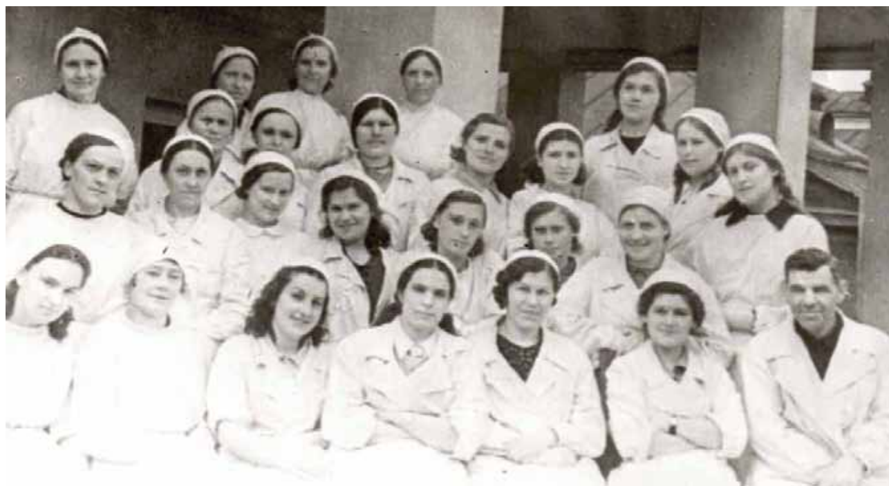
Иллюстрация 4. Врачи и медицинские сестры областной станции переливания крови, среди которых большинство являлись донорами. Тула. 1943 г. ГАТО. Ф. П-5682. Оп. 1. Д. 466. Копия. Фотография ч/б.

Коммунар (Тула). – 1943. – 21 марта. – № 65 (8176). – С. 2.