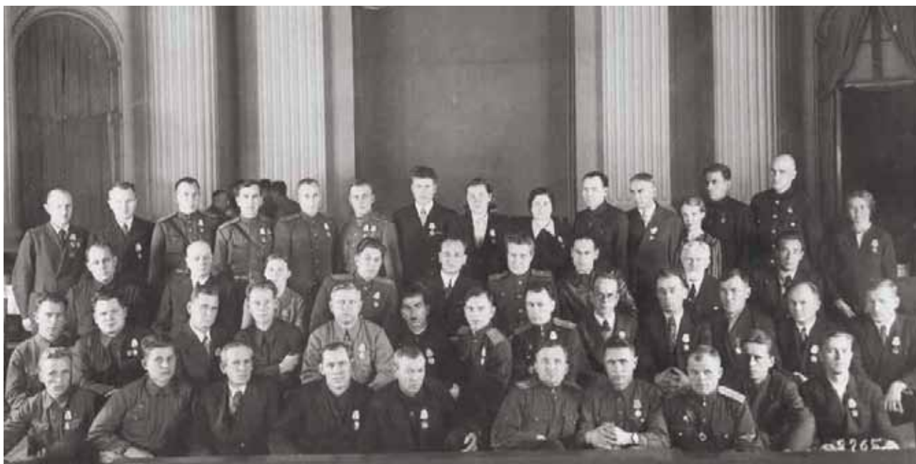
Иллюстрация 9. Группа награжденных горняков и партийных работников Подмосковского угольного бассейна. Москва. Кремль. 1943 г. ГАТО. Ф. П-5682. Оп. 1. Д. 709. Копия. Фотография ч/б.

Коммунар (Тула). – 1943. – 16 ноября. – № 232 (8333). – С. 1.