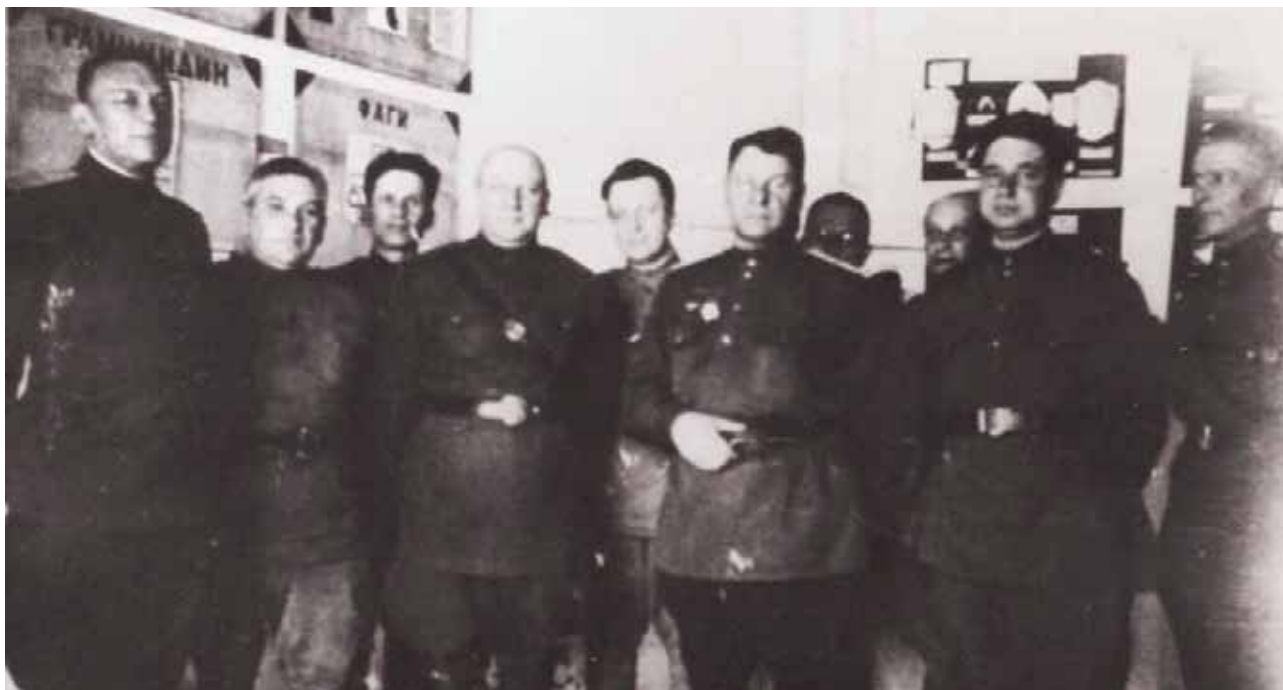
Иллюстрация 5. Врачи и руководители Тульской госпитальной базы 1942-43 гг. Тула. 1943 г. ГАТО. Ф. П-5682. Оп. 1. Д. 849. Копия. Фотография ч/б.

ГАТО. Ф. Р-2235. Оп. 2. Д. 9. Л. 204. Подлинник. Машинопись. Публикуется впервые.