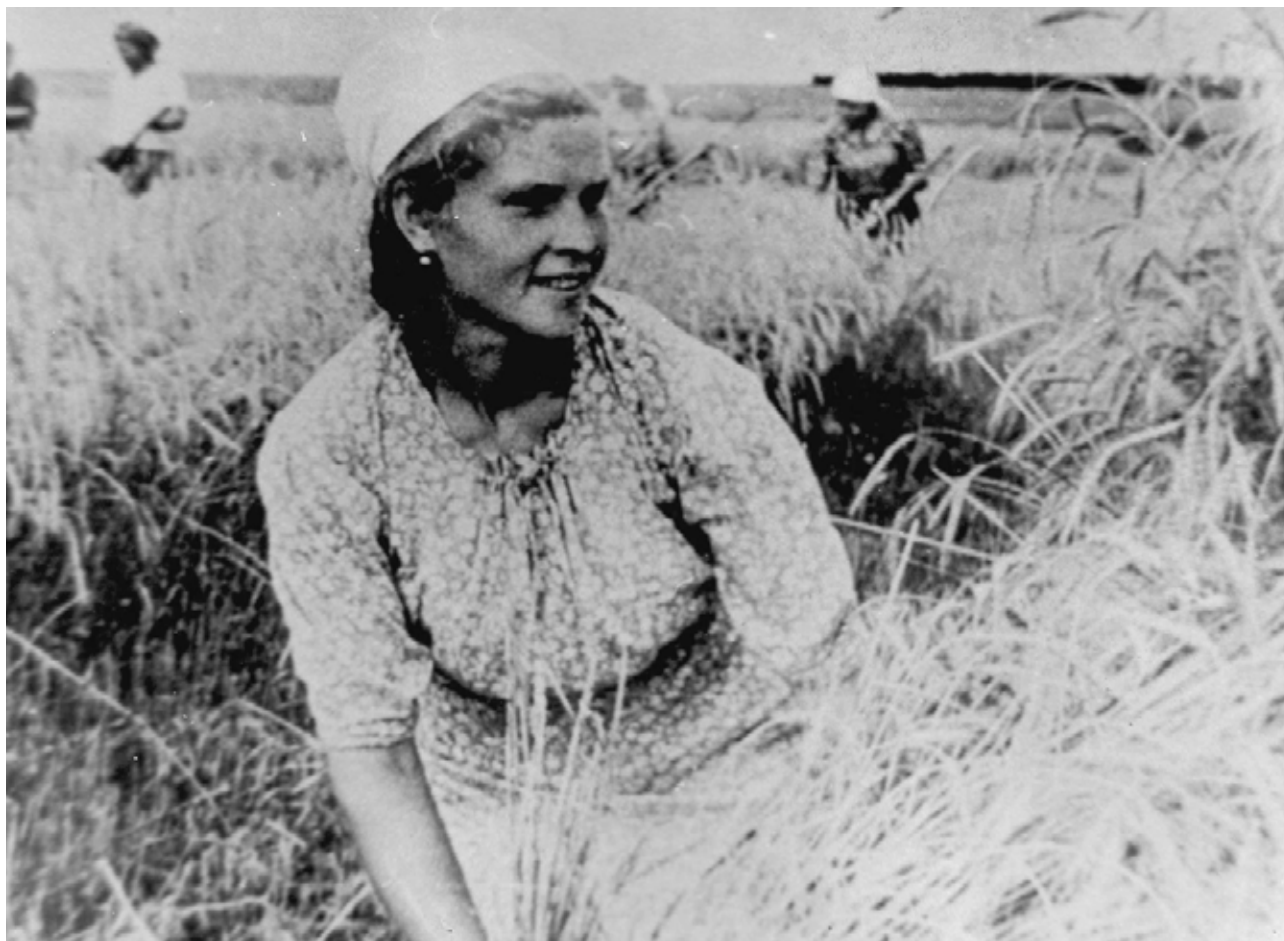
Иллюстрация 12. Женщины колхоза «Единство» Ефремовского района на косьбе ржи. Тульская область, Ефремовский район. 1943 г. ГАТО. Ф. П-5682. Оп. 2. Д. 172. Копия. Фотография ч/б.

Колхозный тыл, фронтовым урожаем бей врага! На призыв партии отвечали делом Жизнь туляков входит в нормальное русло Охране здоровья – все внимание Учебные аудитории принимают пополнение Школы Институты Культурный фронт расширяет свои границы Борьба за порядок и безопасность Местная промышленность вновь на плаву Промтоваров на прилавках становится больше Продовольственный рынок множит свой ассортимент Социальная поддержка – дело важное Служба в православных храмах вселяет веру в Победу