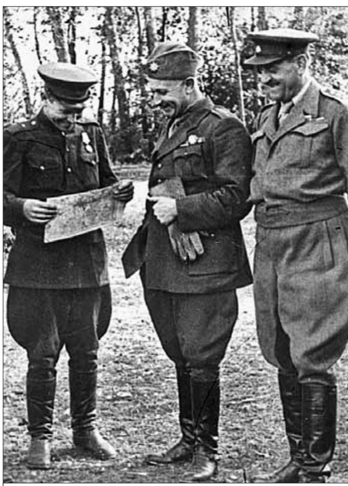
● С генералом Людвиком Свободой (он в центре снимка), будущим президентом Чехословакии. 1943 г.

Это письмо датировано 1 октября 1943 года. С пометкой: «близ Киева». Но до этого немало надо будет проехать, пройти, пережить! Войну вместе с семьёй он встретит под бомбами в Минске, куда тремя месяцами раньше прибудет в качестве собственного корреспондента «Правды» по Белорусской ССР. И уже 22 июня передаст в редакцию по телефону первый свой военный материал. Очень был огор-