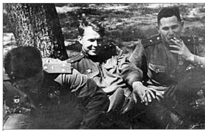
● Майор Пётр Лидов и подполковник Александр Твардовский, тоже военкор. 1943 г.