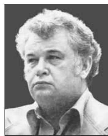
Литературной, общественной и политической жизни страны. В 1970-е годы руководил

Он вырос в Ленинграде. Школьником пережил там все 900 дней блокады. Вслед поэтам старшего поколения — Н. Тихонову, Э. Берггольцу — с потрясающей силой отразил этот беспримерный подвиг народа в своих стихах, рассказах, публицистике. Пережитое в блокаду обострило его восприятие жизни, интерес к человеку-труженику, к вопросам нравственности, к темам любви, дружбы и верности. Стал одним из постоянных авторов «Правды».