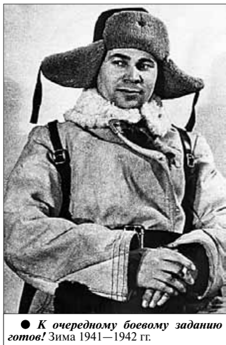
● К очередному боевому заданию готов! Зима 1941—1942 гг.