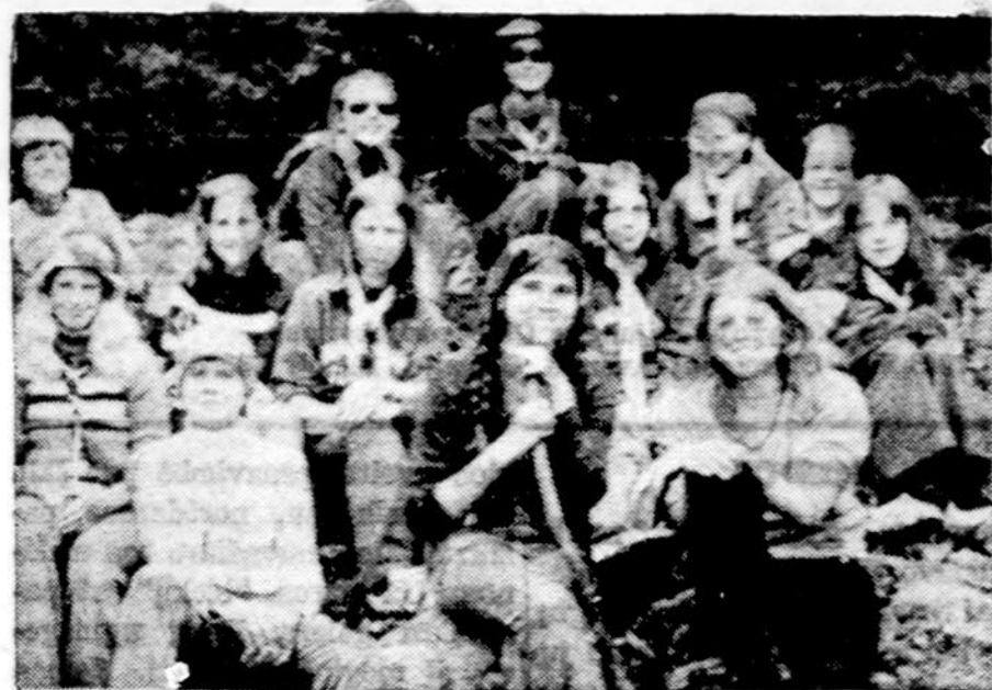
Montrealio lietuvės skautės savo stovykloje.