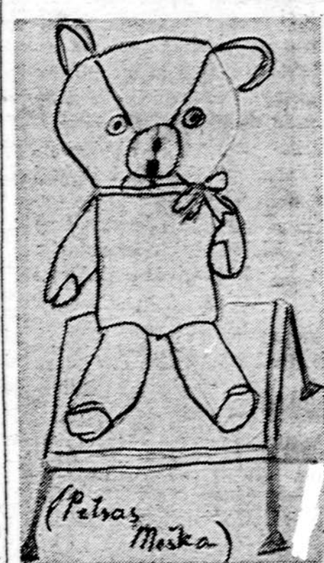
Piešė Darius Pavilionis, Marquette Parko lit. m-la

Vasaros laikas man labai patinka. Nereikia šiltai rengtis. Saulutė pašildo. Visi medžiai žaliai pasipuošę. Darželiuose ir parkuose žydi gėlės. Parkas pil-