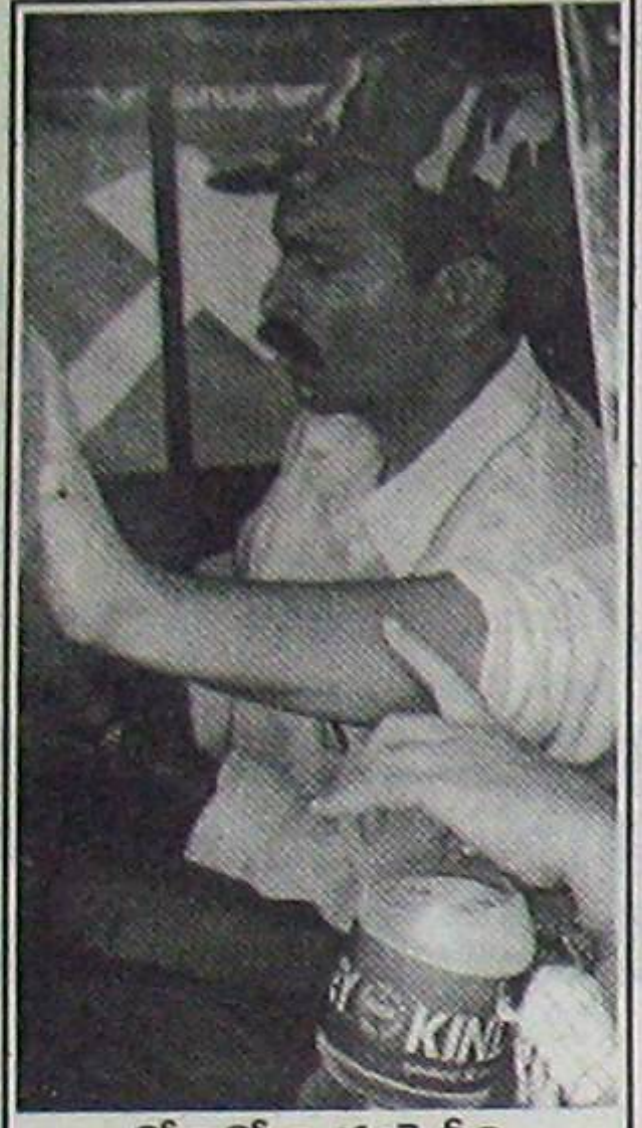
కోకాకోలా కంపెనీని నిషేధించాలని ఉద్యమం చేసే అన్నలు అదే కంపెనీ నీళ్లు తప్ప వేరేమీ త్రాగలేక పోవడం న్యాయమా?

మా అంతిమ లక్ష్యం ప్రాంతాల వారిగా రాజ్యాధికారం; అందుకు మారం సాయుధ పోరాటం; నూతన ప్రజాస్వామిక విప్లవ విజయంతో ఏర్పడే ప్రజా ప్రభుత్వ స్థాపన కోసం మేము కృషి చేస్తాము. ముందుగా పల్లెల్లో పట్టు సాధిస్తాము; ఆ తర్వాత పల్లెల మిడుగా