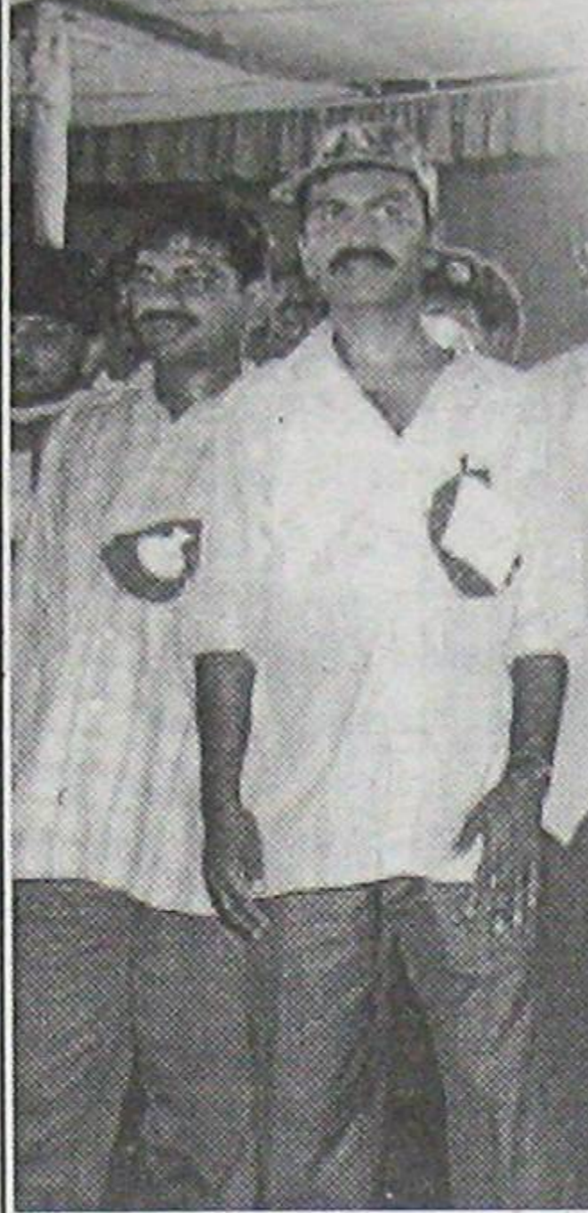
గుత్తి కొండ సభలో నక్కల్ నేతలు

పదికన సమ సమాజ స్థాపన, విప్లవం, సాయుధ పోరాటంతో రాజ్యాధికారం సాధ్యమని నమ్మేవారి పట్ల జాలి పడడం తప్ప ఎవరూ ఏమీ చేయలేరు. నక్కల్లెట్లు అంటే మేధావుల క్రింద లెక్క. ప్రపంచ రాజకీయ పోకడలను అధ్యయనం చేయడంలో వారికి వారే సాటి అని పేరు.