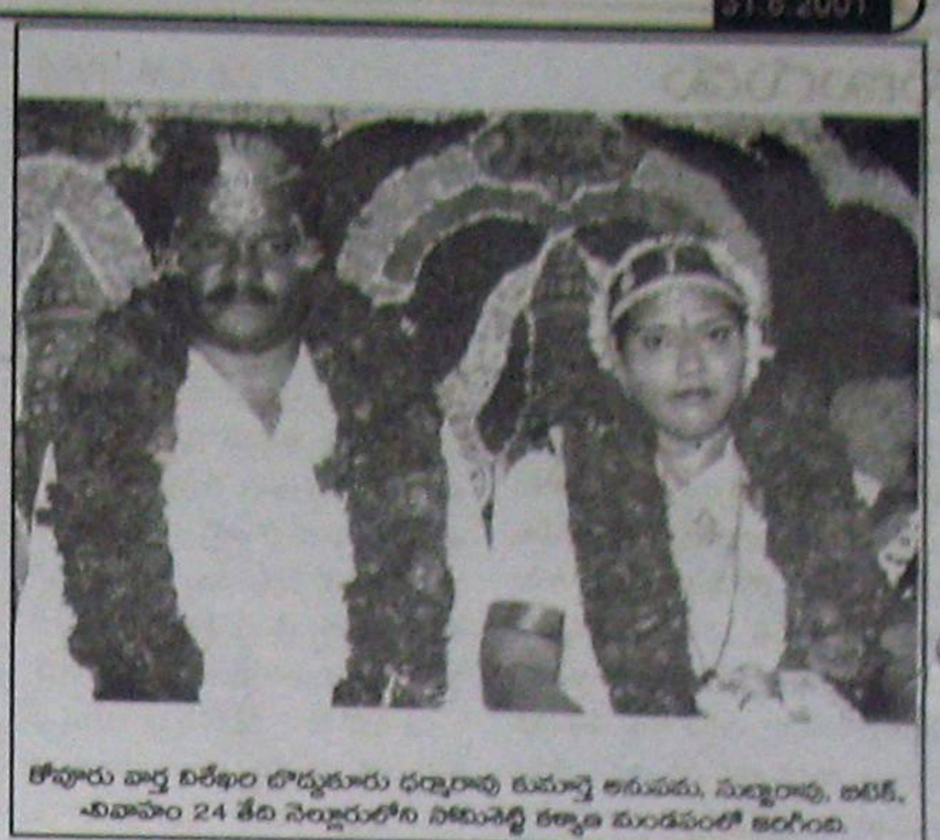
కోవ్వూరు వార్డు విశేషం పొద్దుకూరు ధర్మాపు కుమార్తె అరువము, సుబ్బారావు, ఇరికి. చిదాపాం 24 తేది నెల్లూరులోని నిమిసెన్ శిల్పాల కుండపంజీ అంగింది.

పరంబ్యోతా బ్యోతిం పరబ్రహ్మ స్వరూపం పరబ్రహ్మన దీపం నమోస్తుతే.