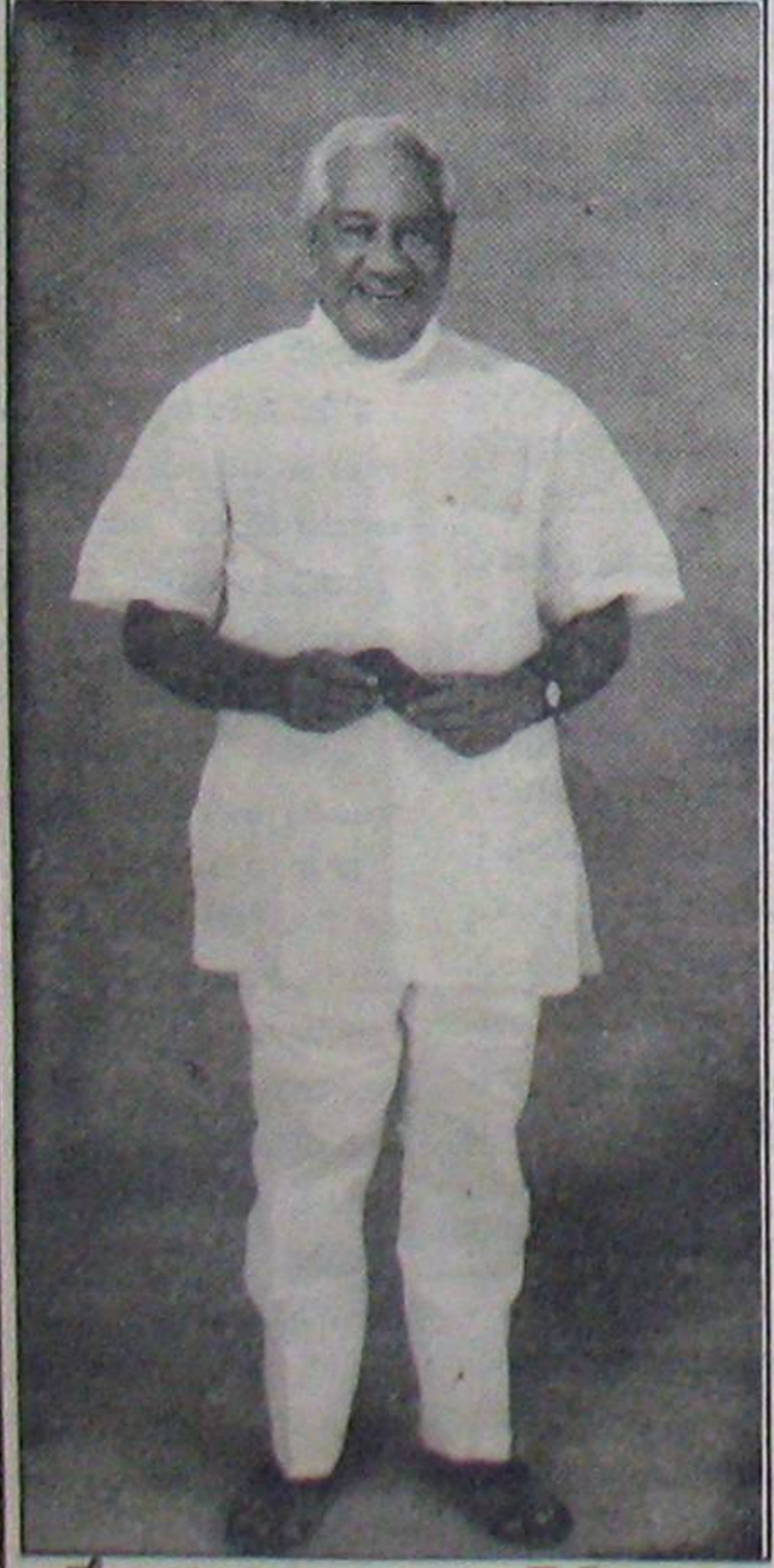
నేదురుమల్లి జనార్దన రెడ్డి, M.P. వరసారావుపేట