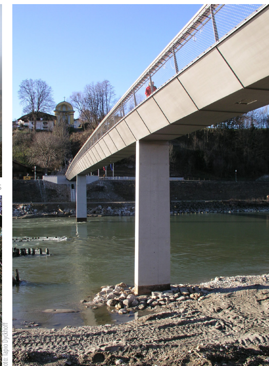
Blick vom Ufer