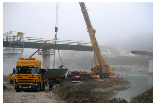
Einheben des letzten Brückenelements