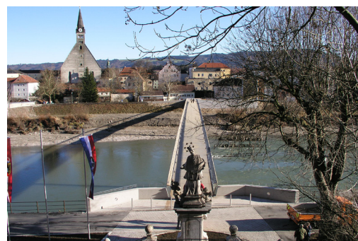
Blick von Oberndorf auf die Stiftskirche in Laufen