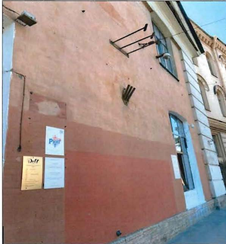
3. Фрагмент северного фасада объекта культурного наследия.