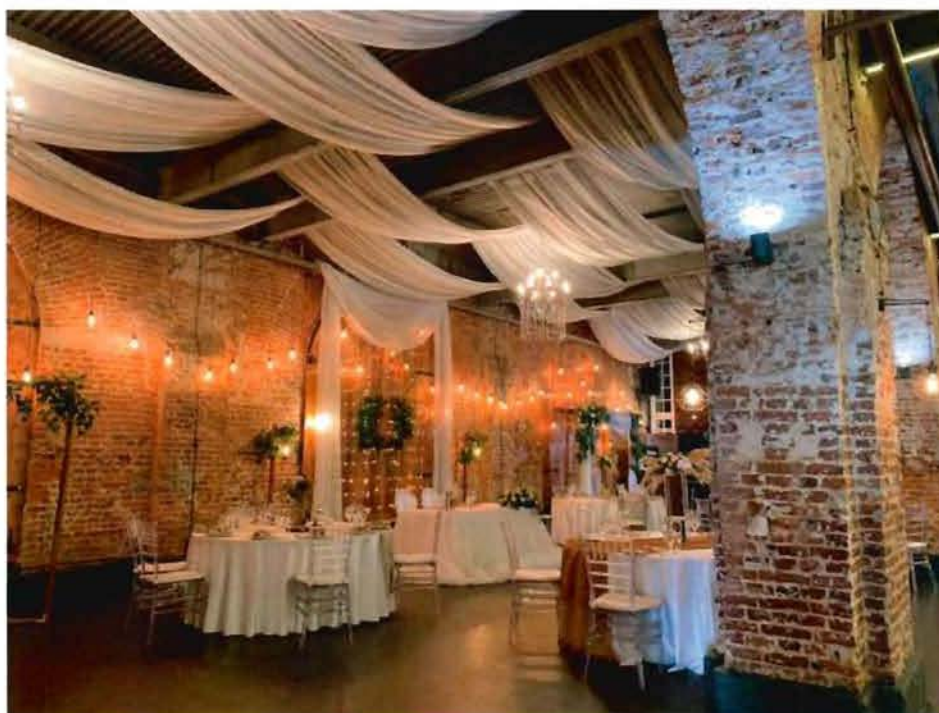
6. Интерьер помещения № 1-Н(50) объекта культурного наследия.