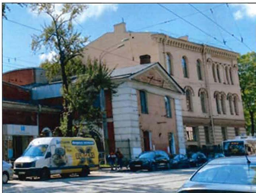
2. Северный и восточный фасады объекта культурного наследия.