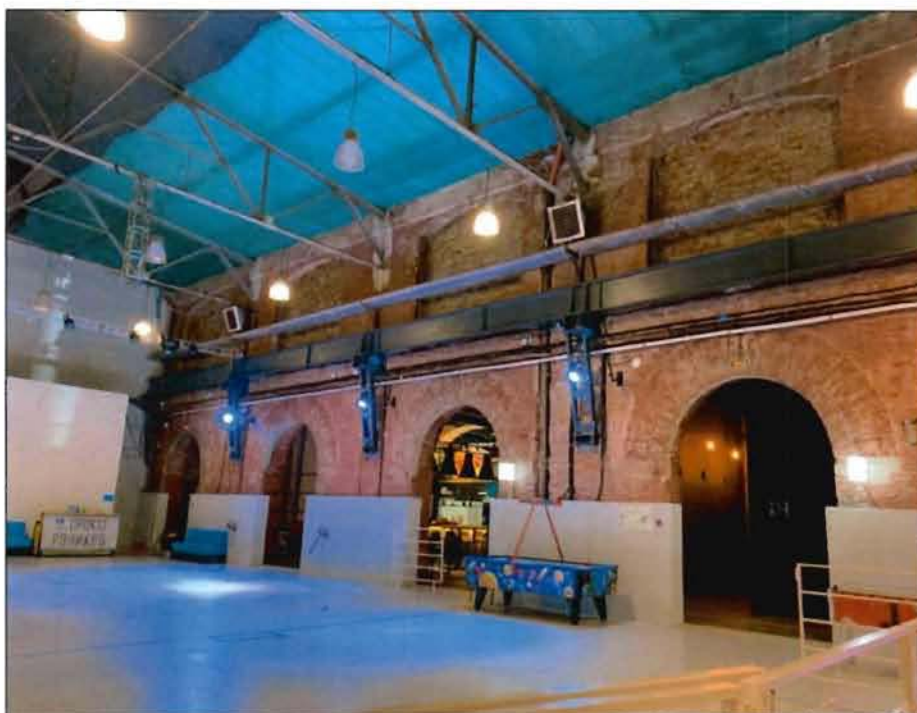
5. Фрагмент восточного фасада (бывшего дворового, расположенного внутри современного цеха) объекта культурного наследия.