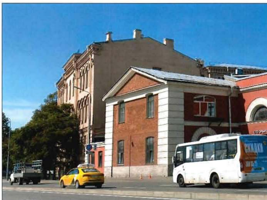
1. Южный и восточный фасады объекта культурного наследия.

Фотографическое изображение объекта культурного наследия регионального «Материальные магазины» (корпус 2-а) - склады, расположенного по адресу: Санкт-Петербург, улица Комсомола, дом 2, литера А, входящего в состав объекта культурного наследия регионального значения «Арсенал» (фотофиксация выполнена 10.08.2021).