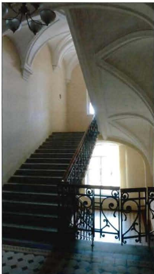
9. Лестница в основном объеме здания. (пом. 1-Н (39)).