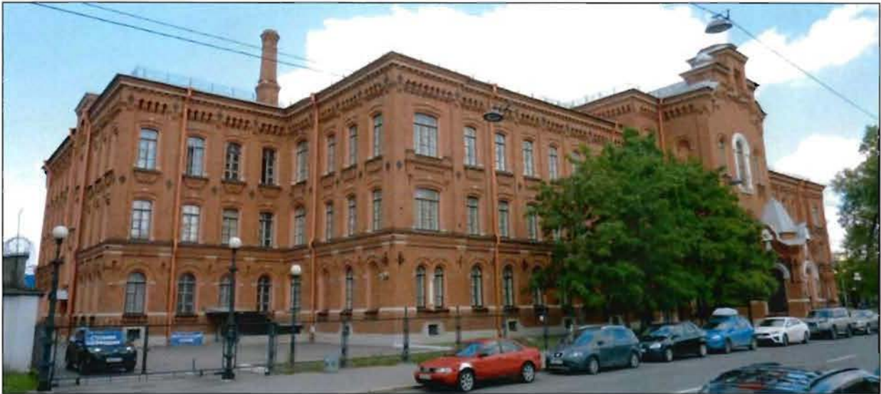
1. Объект культурного наследия. Перспектива здания по Косой линии. Вид с юго-востока.

Фотографическое изображение объекта культурного наследия регионального значения «Богадельня», расположенного по адресу: г. Санкт-Петербург, Косая линия, дом 15а, литера А, входящего в состав объекта культурного наследия регионального значения «Особняк, фабрика и богадельня «Торгового дома Брусницыных» (комплекс зданий с территорией, оградой)» (фотофиксация выполнена 01.06.2021)