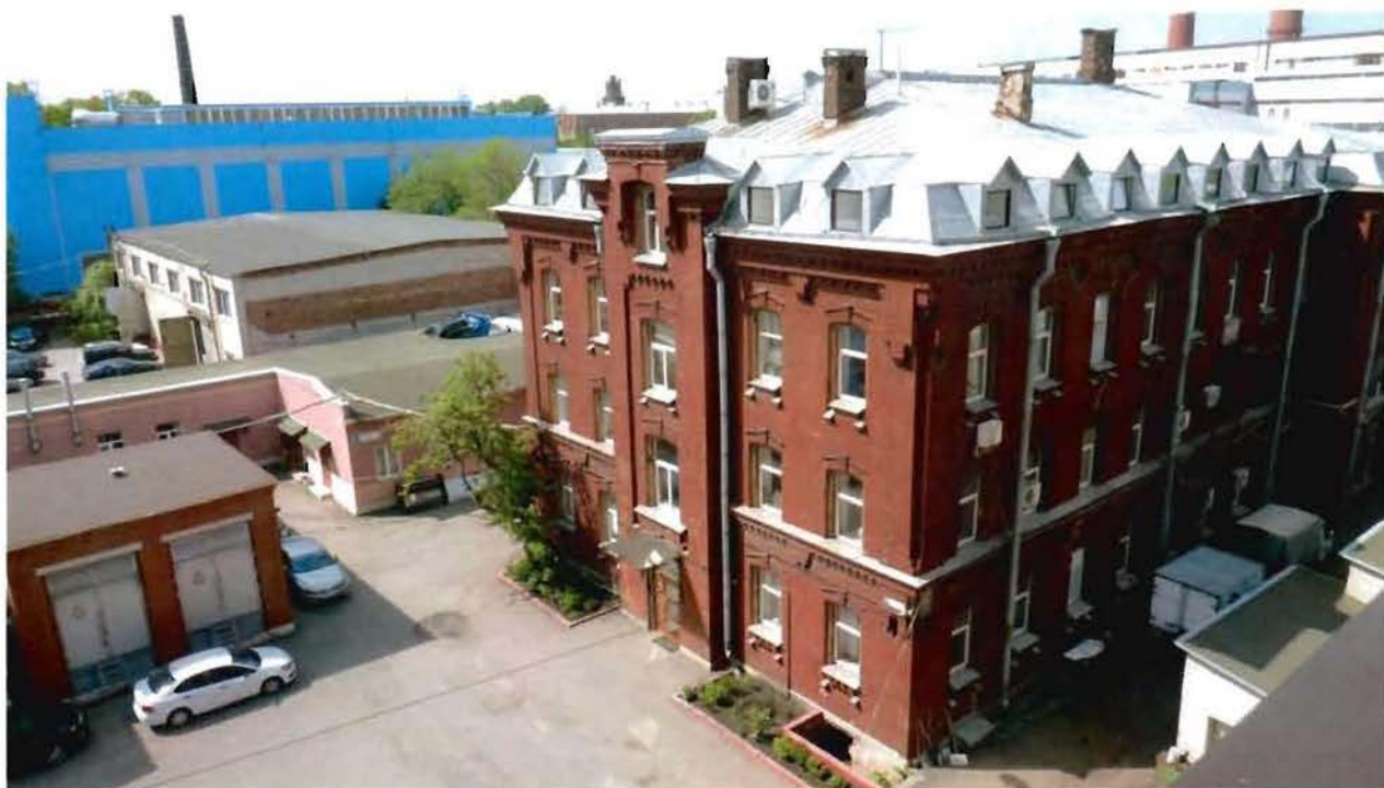
23. Фрагмент территории объекта культурного наследия (северный участок, южная часть). Вид с севера.