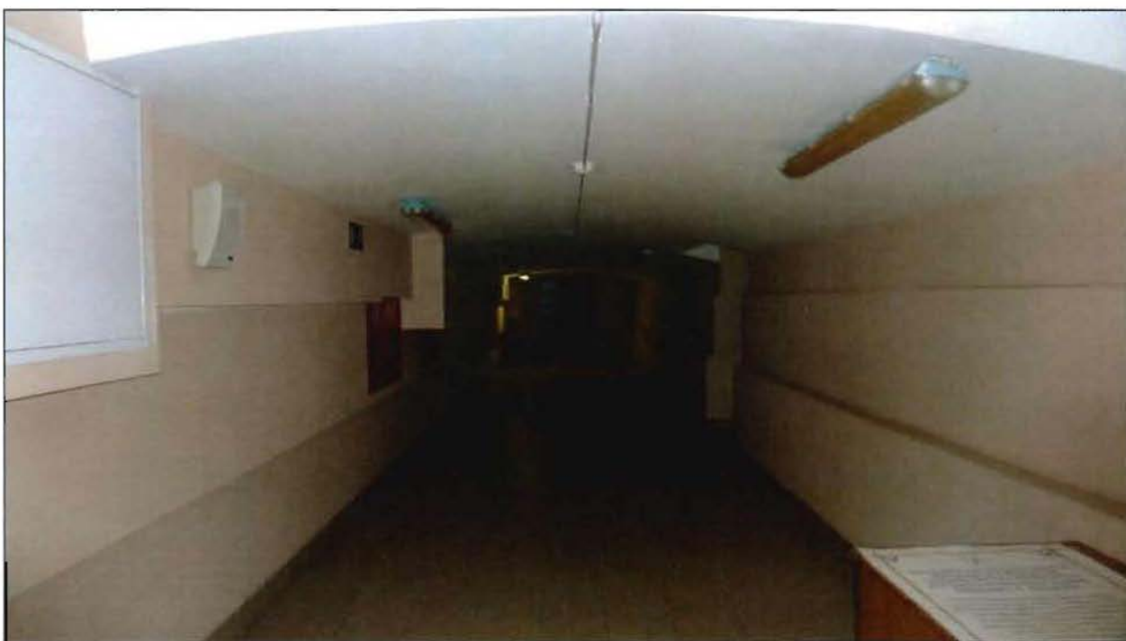
7. Коробовые своды подвала (пом. 1-Н (93)).