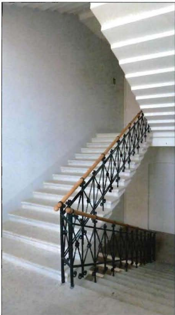
11. Лестница северного флигеля (1-Н (124)).