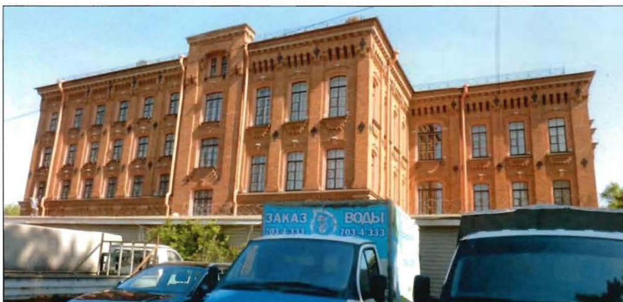
4. Объект культурного наследия. Южный фасад.