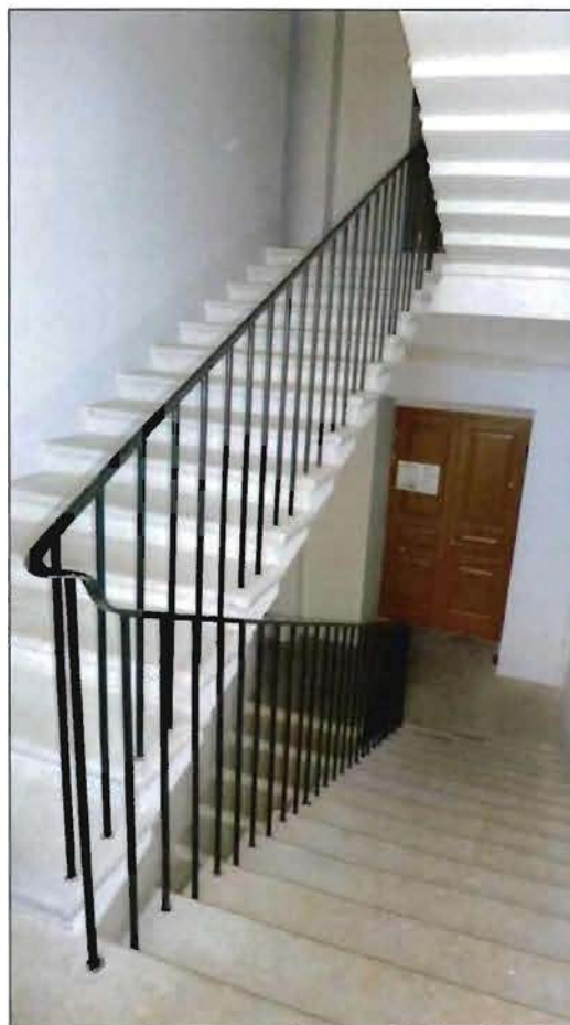
10. Лестница северного флигеля (пом. 1-Н (109)).