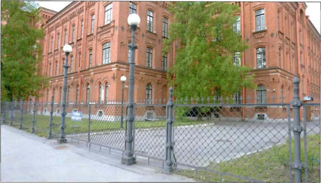
17. Часть объекта культурного наследия «Ограда», входящего в состав объекта культурного наследия регионального значения «Особняк, фабрика и богадельня «Торгового дома Брусницыных» (комплекс зданий с территорией, оградой)». Ворота и калитки со стороны Косой линии. Вид с запада.