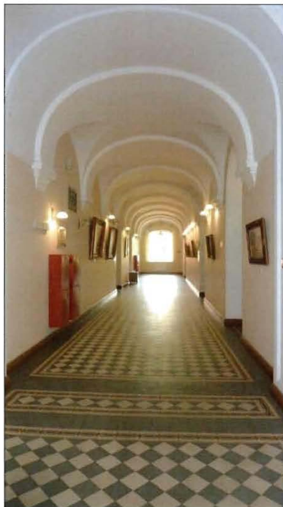
12. Коридор 1-го этажа (пом. 1-Н (17)).