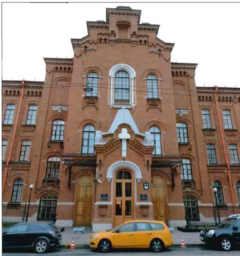
2. Объект культурного наследия. Западный фасад. Центральный ризалит с тамбуром главного входа. Вид с востока.