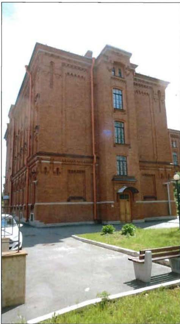
5. Объект культурного наследия. Западный фасад северного флигеля.