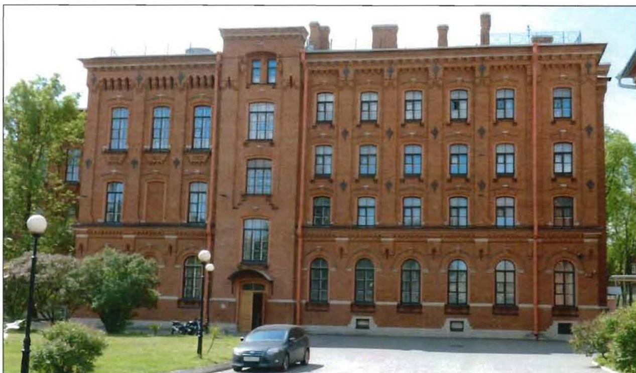
3. Объект культурного наследия. Западная часть северного фасада.