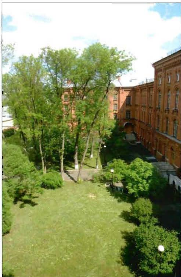
20. Фрагмент территории объекта культурного наследия (северный участок, западная сторона). Вид с юга.