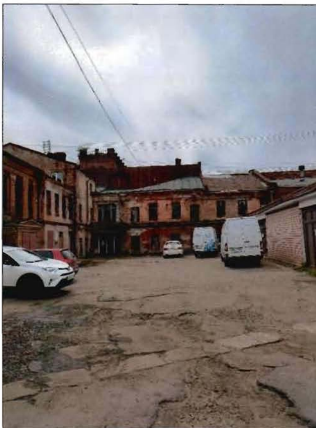
22. Фрагмент территории объекта культурного наследия (центральный участок). Вид с севера.