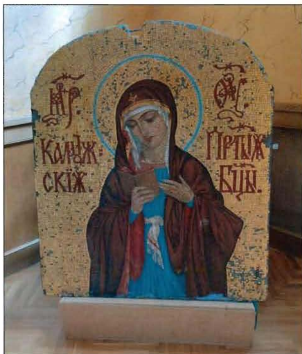
16. Мозаичная икона «Богоматерь Калужская».