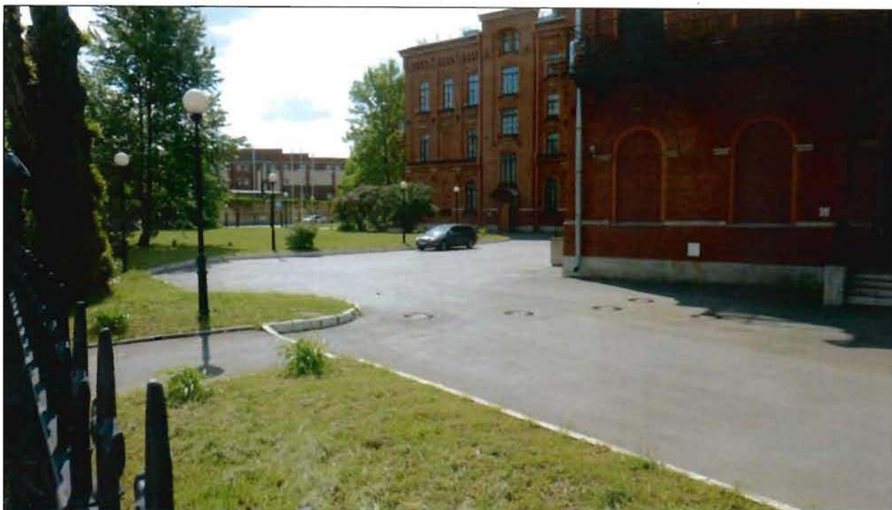
19. Фрагмент территории объекта культурного наследия. Северная часть. Вид с севера.