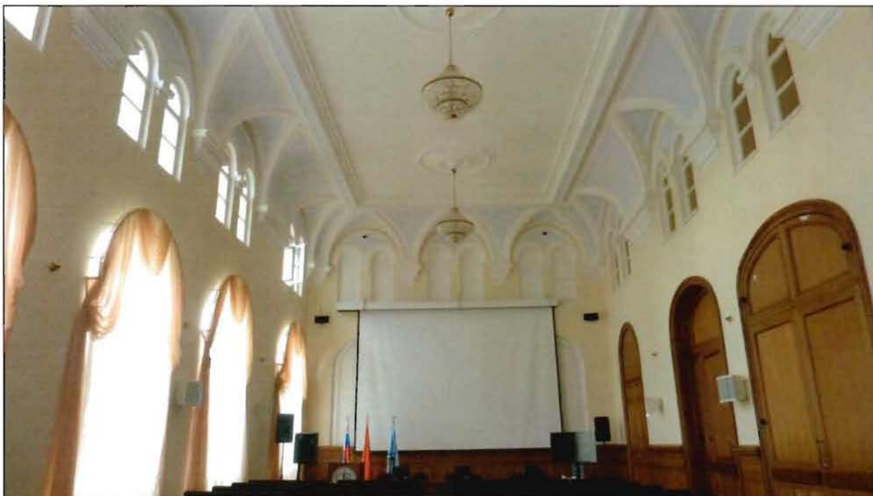
13. Актный зал (пом. 1-Н (217)).