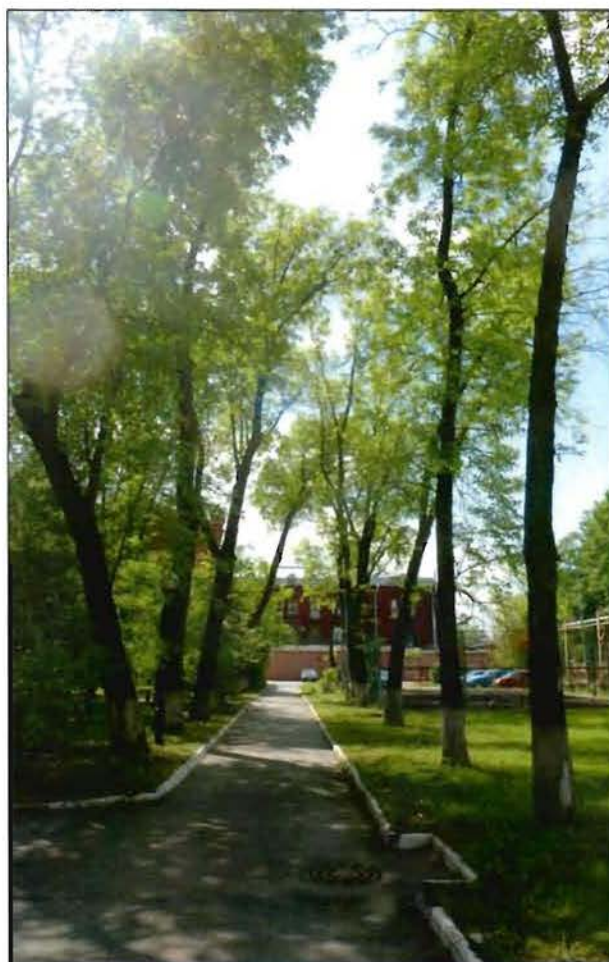
21. Фрагмент территории объекта культурного наследия (северный участок, западная сторона). Вид с севера.