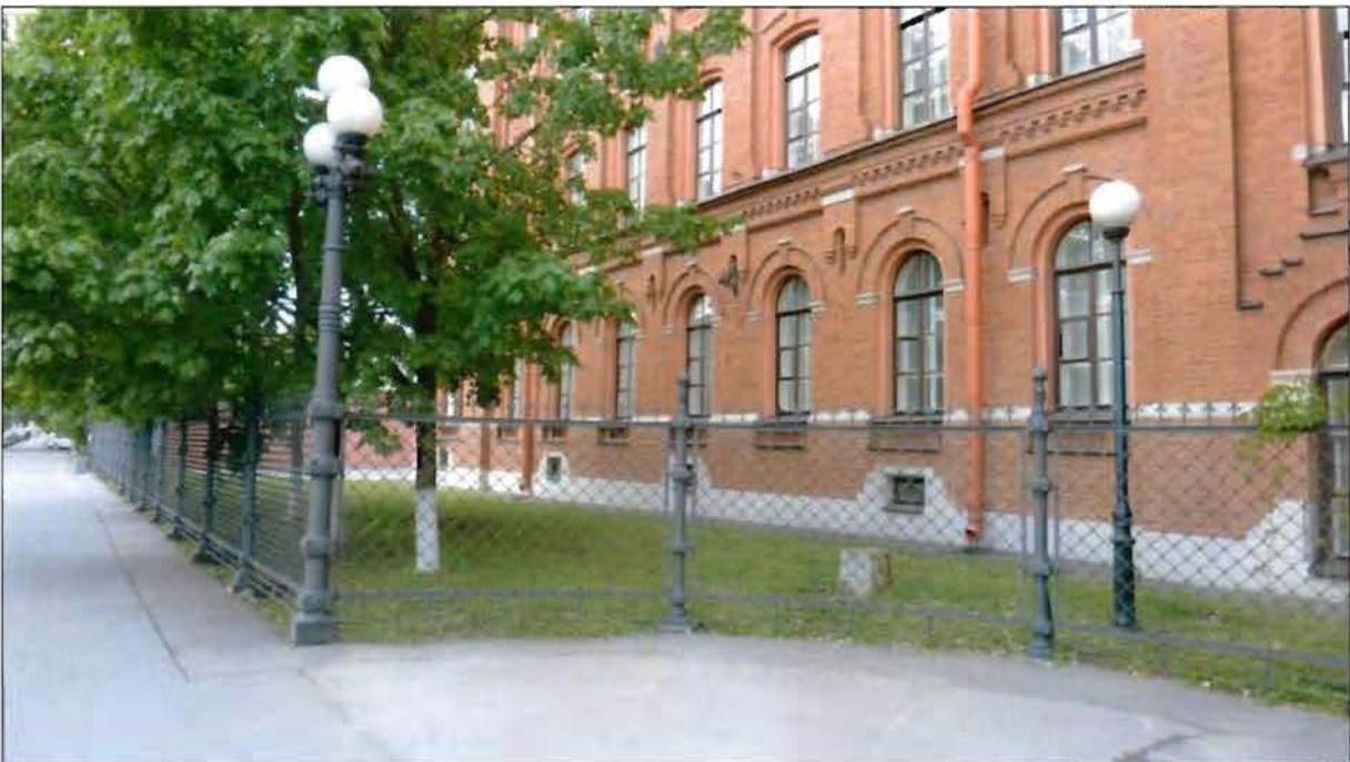
18. Часть объекта культурного наследия «Ограда», входящего в состав объекта культурного наследия регионального значения «Особняк, фабрика и богадельня «Торгового дома Брусницыных» (комплекс зданий с территорией, оградой)». Фрагмент ограды и территории по Косой линии. Вид с юго-запада.