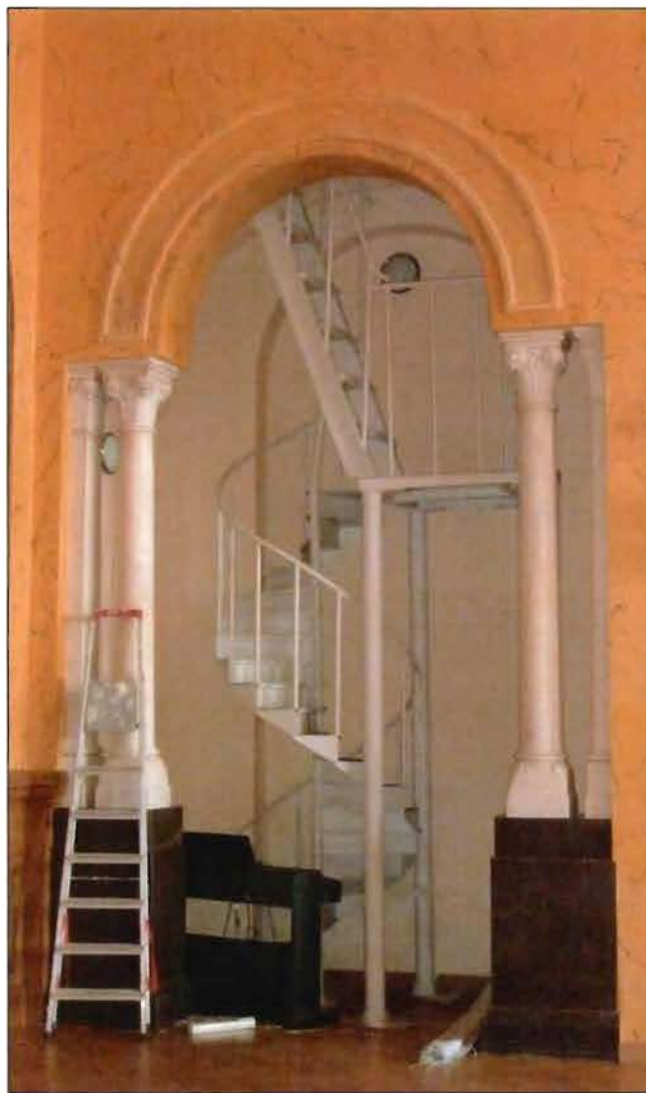
15. Церковный зал (пом. 1-Н (218)). Оформление арочного проема и лестница на хоры.