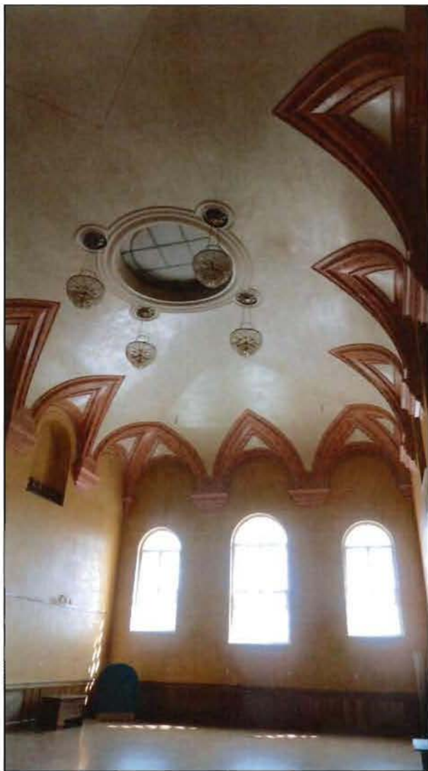
14. Церковный зал (пом. 1-Н (218)).