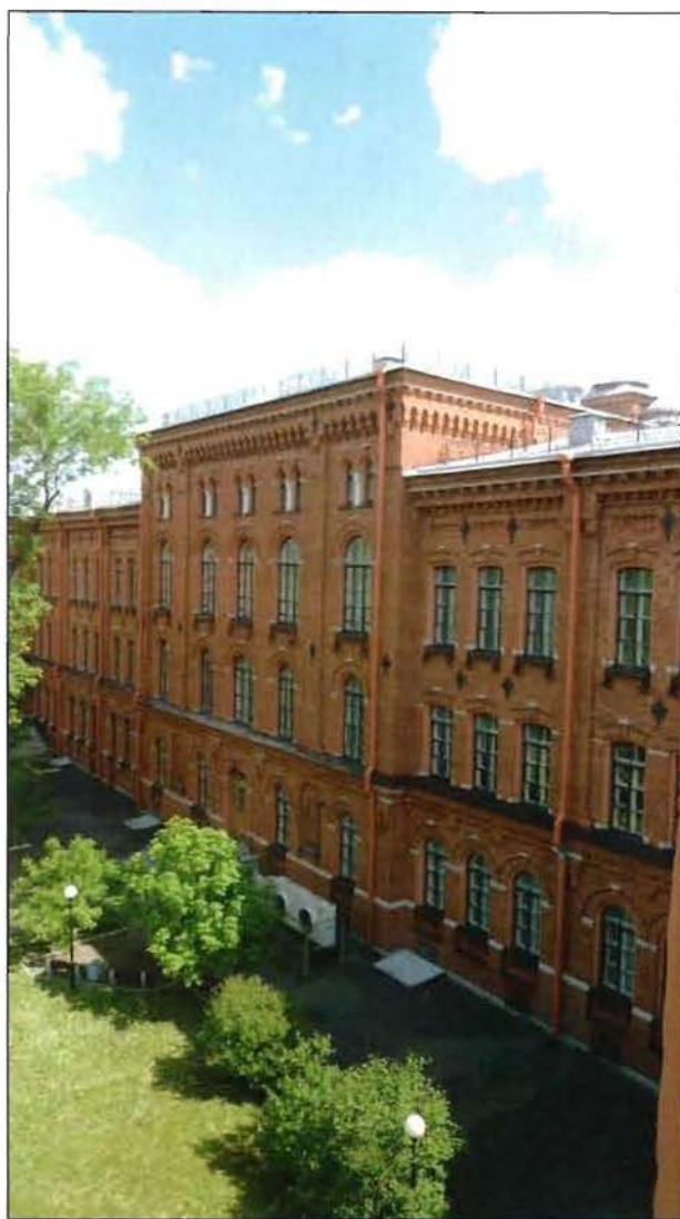
6. Объект культурного наследия. Дворовый (западный) фасад. Вид с юго-запада.