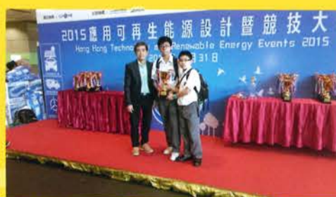
2015應用可再生能源設計暨競技大賽

我參加了這次比賽之後，學到了很多東西。當中，我明白到隊友之間合作的道理，學會了合作與溝通的技巧。如果不是就很難完成一項令人滿意的工作。還有，我相信努力一定得到收穫。