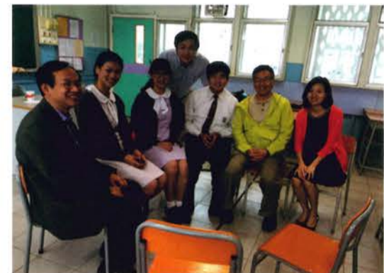
九龍工業學校校友會傑出學生獎學金 (14/11/2015)