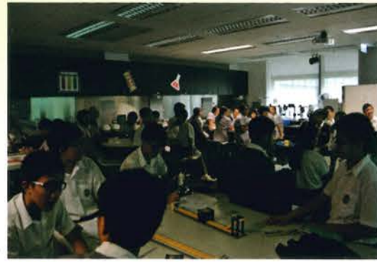
創新科技嘉年華工作坊 (03/11/2015)