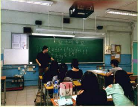
韓文班 (2015年10月開始授課)