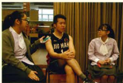
小記者——歐陽師兄專訪