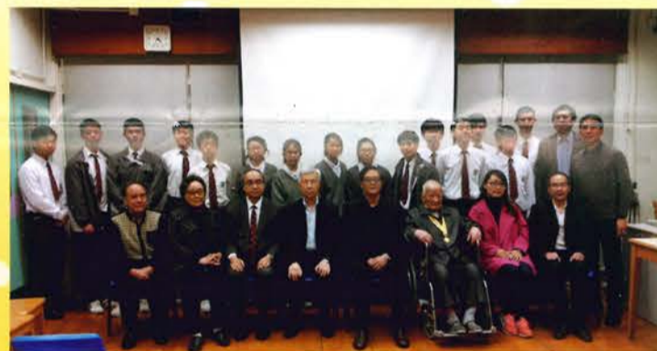
嘉賓與黃校長、老師、同學合攝