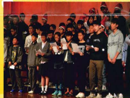
聖誕聯歡歌唱比賽 (22/12/2015)