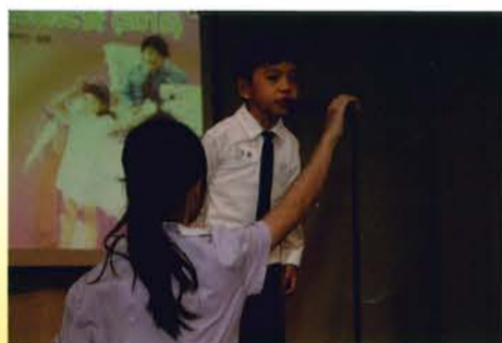
義工大使——後台支援

我很榮幸能擔任大型比賽的司儀。做好司儀的工作，我要集中精神，亦要做好事前的準備功夫，更要設想活動中可能會發生的事情及其解決的方法。經過老師的悉心栽培，我發覺自己已練得一身好武功，又學懂分身術，一面要聽從評判老師的指示，一面要控制大局，真是十分刺激。