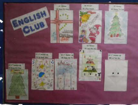
Congratulations to all Winners!

All students enjoyed this creative and yet language rich activity.