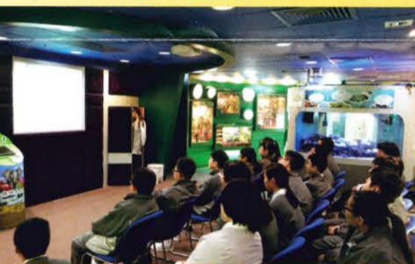
參觀瀕危物種資源中心活動 (21/12/2015)