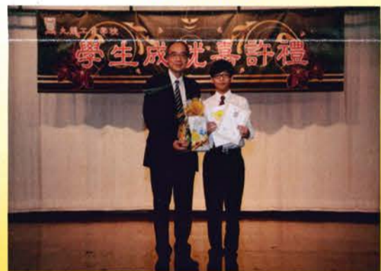
高中學生成就嘉許禮 (03/12/2015)