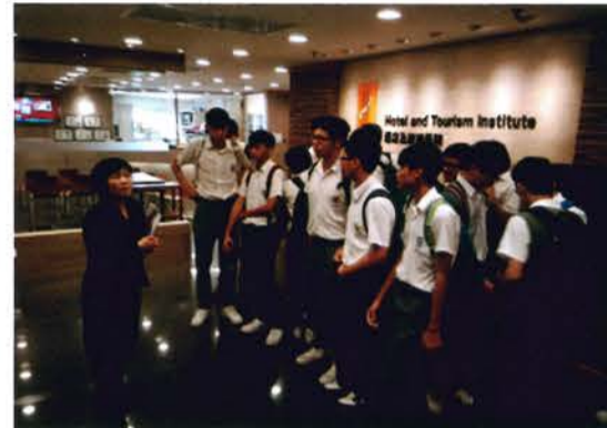
APL Taster Program of Hotel Operation (11/11/2015)