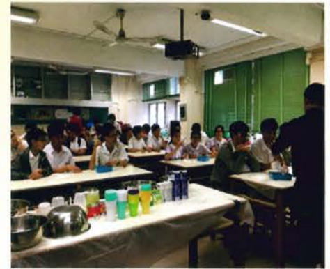
液態氮雪糕製作工作坊 (5/11/2015)