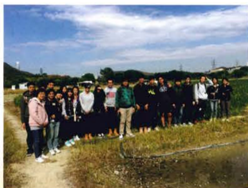
中六地理考察——獎金香港業活動 (26/11/2015)