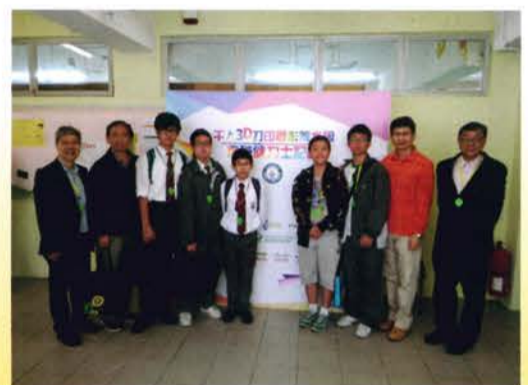
「千人3D打印解水困」齊破健力士世界紀錄活動 (28/11/2015)