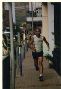
投入於環校跑的師兄