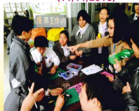
午間活動——皮革工作坊 (26/11/2015)