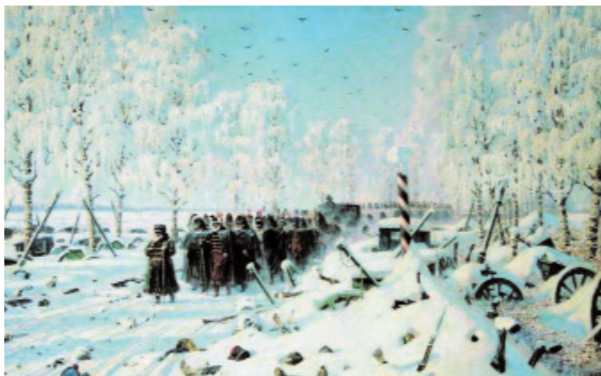
Бегство армии Наполеона

Что же такого секретного сообщал своему государю его представитель во Франции? Например, он нарисовал психологические портреты почти всех наполеоновских маршалов, участвовавших в походе на Россию. Раскрыл намерение Бонапарта разгромить русских в первом же генеральном сражении (желательно еще в приграничной полосе) и продиктовать условия мира, которые обязывали бы Александра I возобновить континентальную блокаду Англии и заставляли русских принять участие в замышлявшемся походе в Индию. Дал точную и подробную характеристику состояния французской армии. Наконец, пересылал в Петербург со срочным курьером сводку самых полных данных о численности и дислокации вооруженных сил Франции.