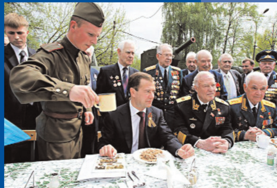
Д.А. Медведев на встрече с ветеранами

А всем людям младших поколений хотел бы сказать только одно, нам нужно брать пример с тех, кто когда-то отстоял нашу страну ценой неимоверных усилий. И помнить о тех, кого нет только потому, что они отдали свою жизнь за наше будущее.