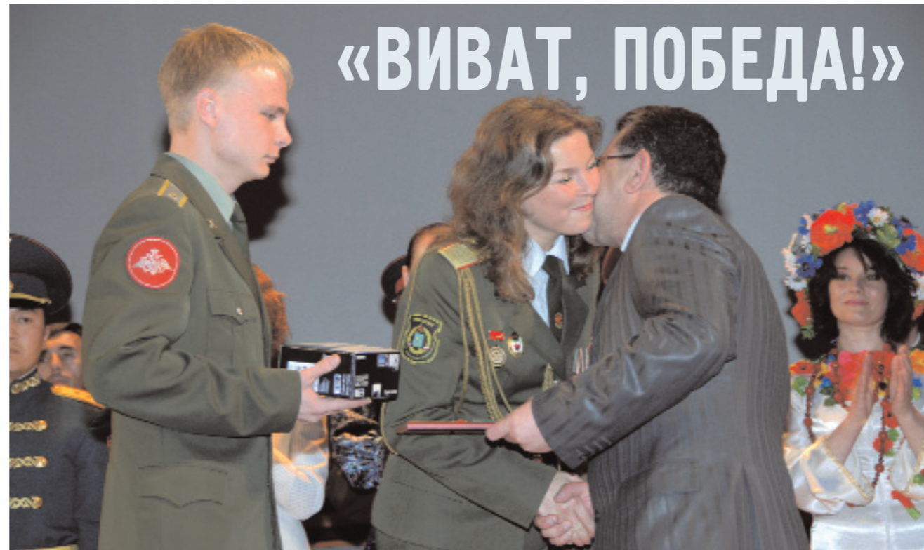
В Москве под эгидой Секретариата Совета министров обороны СНГ состоялся XII Московский международный фестиваль армейской песни.

Московский международный фестиваль армейской песни «Виват, Победа!» проведен на концертных площадках Зеленоградского административного округа Москвы в рамках мероприятий, посвященных 66-летию Победы в Великой Отечественной войне 1941-1945 гг. В двенадцатый раз здесь соревновались в исполнительском мастерстве творчески одаренные военнослужащие вооруженных сил стран Содружества Независимых Государств.