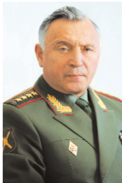
Генерал армии Н.Е. Макаров