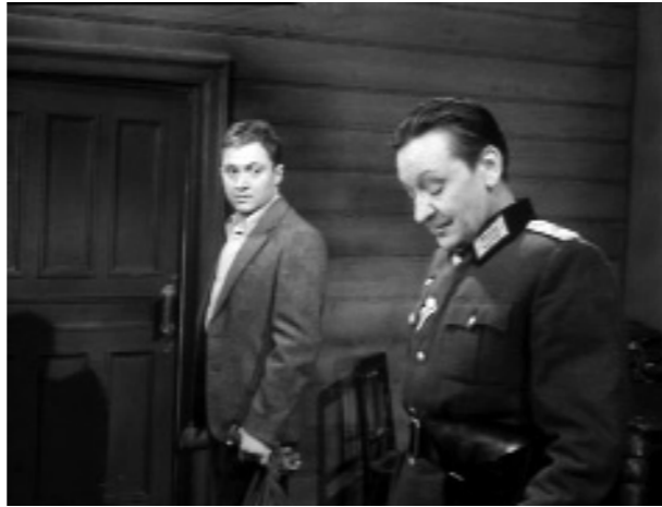
Допрос. Кадр из кинофильма «Майор Вихрь»