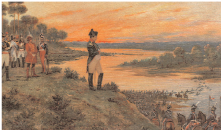
Переход армии Наполеона через Неман