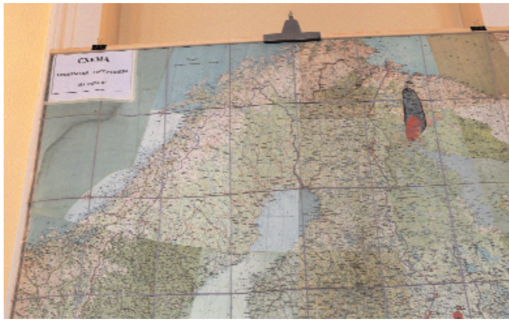
Схема прикрытия госграницы на западе