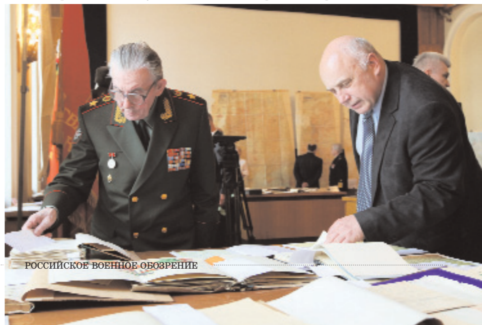
РОССИЙСКОЕ ВОЕННОЕ ОБОЗРЕНИЕ

После этого министр пропаганды третьего рейха Йозеф Геббельс заявил, что советская авиация совершенно разгромлена, а главнокомандующий германскими люфтваффе Герман Геринг на весь мир похвалялся: «Ни одна бомба никогда не упадет на столицу рейха». 26 июля нарком Военно-морского флота адмирал Н.Г. Кузнецов, который был на приеме у Сталина вместе с командующим авиацией ВМФ генерал-лейтенантом С.Ф. Жаворонковым, предложил провести ответные бом-