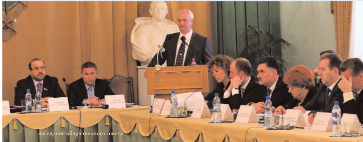
Заседание общественного совета

ских отношений, создание более благоприятных условий для развития и расширения взаимных контактов граждан договаривающихся государств, углубления гуманитарного обмена.