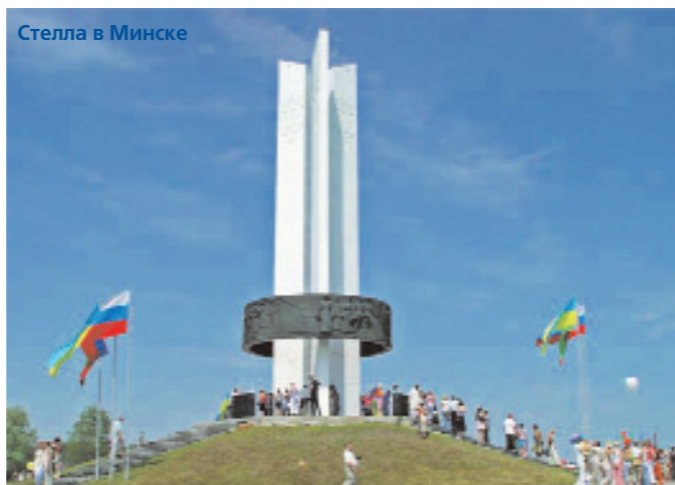
Стела в Минске

Что особенно значимо с исторической точки зрения, в колонне представлен Совет министров обороны государств – участников Содружества Независимых Государств. Военная символика СНГ означает бережное отношение к нашей общей исторической памяти, к нашей общей Победе, завоеванной кровью всех народов, населявших в XX веке Советский Союз.