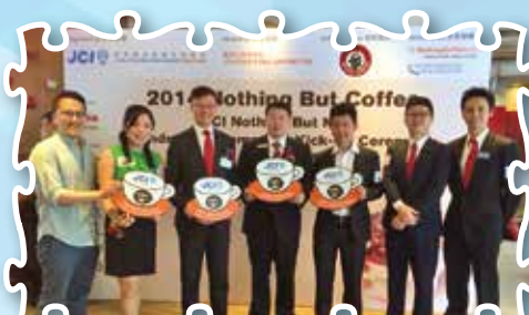
Nothing But Coffee籌款活動