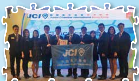
國際青年商會副會長 Senator Altanbagana Shiituu 歡迎接待晚宴