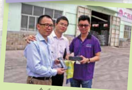
會長致送錦旗給新勝利農資集團代表