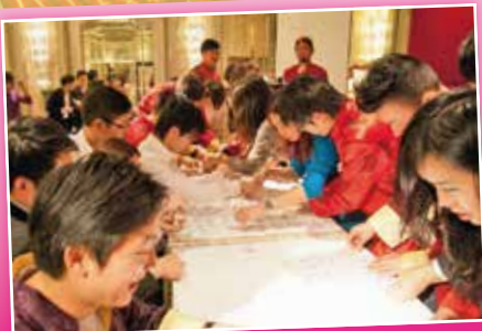
會友投入參與熱烈遊戲