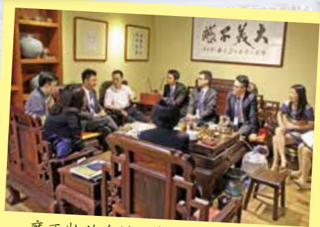
廣西壯族自治區青年聯合會代表與本會茶聚交流