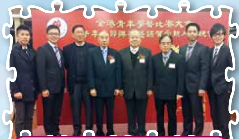
全港青年學藝比賽大會甲午年春茗