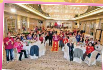
一眾會友與大會的舞獅合照