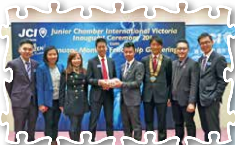
維多利亞青年商會