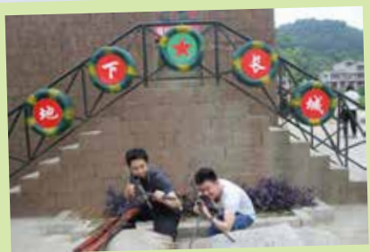
會長與上屆會長帶領團友參觀中越戰爭時興建的地下長城