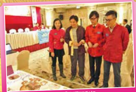
攤位遊戲「幸運擲彩虹」