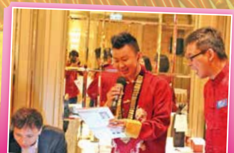
會長在「懷舊估歌仔」環節中高歌一曲