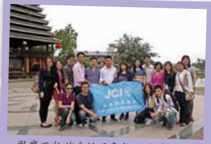
與廣西壯族自治區青年聯合會代表於廣西民族村合照