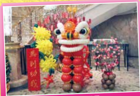
會友設計的汽球佈置

晚宴前先有四個懷舊攤位遊戲包括「幸運擲彩虹」、「勁射九宮格」、「飛環擲千樽」及「粒粒中麻雀」，讓會友熱烈參與其中。