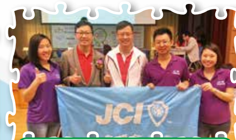
皇者之皇-青商知識及常識問答比賽