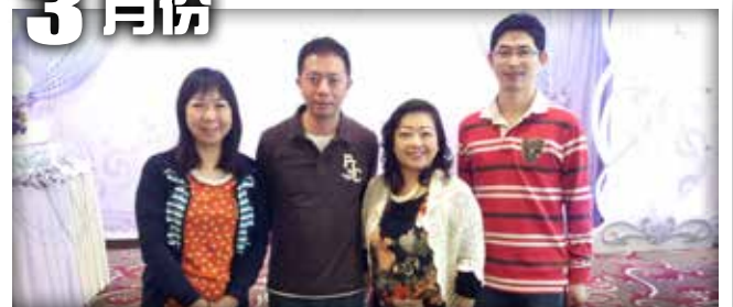
總會資深青商會3月份茶聚