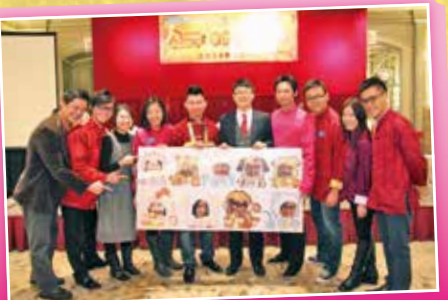
執行董事局大合照