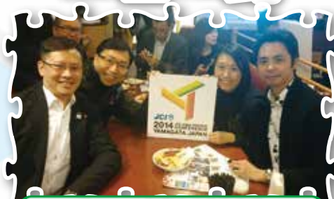
赴2014山形亞太大會啟動禮