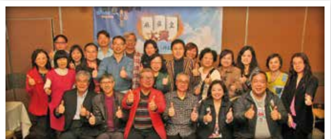
總會資深青商會麻雀皇大賽