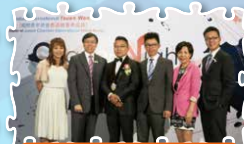
荃灣青年商會創會之夜