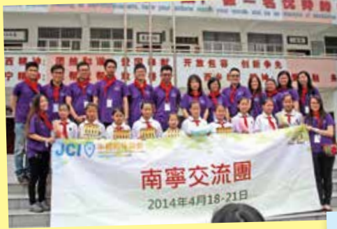
團友給學生們送上關懷，大家一同拍照留念