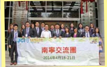
拜訪廣西壯族自治區青年聯合會合照