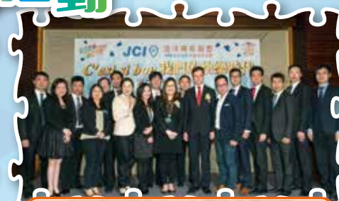
浩洋青年商會二十七周年會慶晚宴