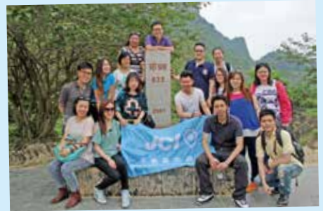
於德天瀑布後方之中越邊界大合照

此行會友亦遊覽國家級旅遊景點，號稱亞洲第一大跨國瀑布之德天瀑布（橫跨中國、越南）。我們乘坐竹筏近距離感受瀑布的澎湃氣勢。還參觀了全長三公里的地下長城，感受當年中越戰爭奮勇抗敵之歷史。團員可能感受了軍人的勇氣，更挑戰地道菜 - 炸黑蜂。