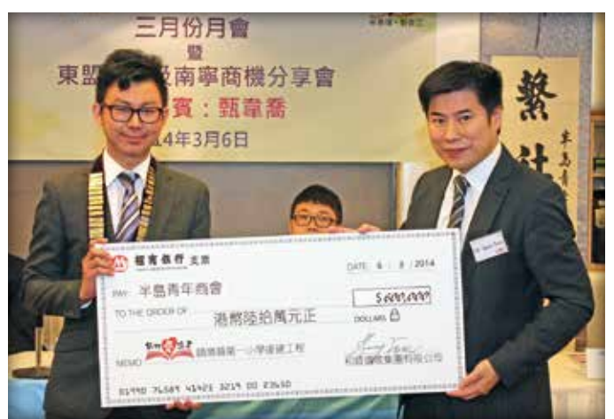
於三月份月會上進行支票移交儀式