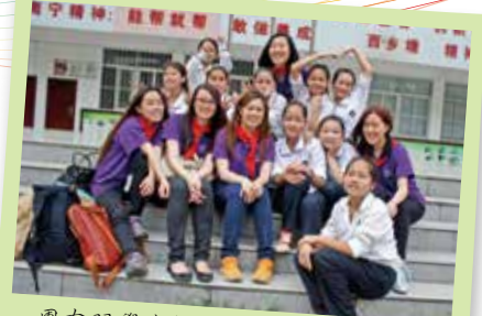
團友跟學生們打成一片，樂也融融