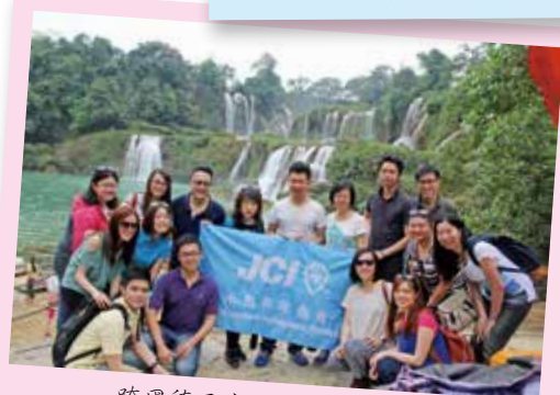
跨國德天大瀑布，一同體驗廣西山水之美

是次交流讓會友更加深入認識祖國，透過商務考察與當地青年領導交流及考察社區環境，親身感受南寧及東盟之發展面貌及當地文化。今年亦首次與南寧市青年企業家協會簽訂友好意向書，為未來的交流建立基礎，可謂任重而道遠。如會長所言，希望這次交流只是一個序幕，一個好的開始，日後還有更多合作機會，能夠做到互惠互贏，攜手合作的長遠夥伴關係。