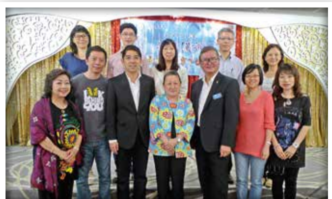
總會資深青商會 5月份茶聚