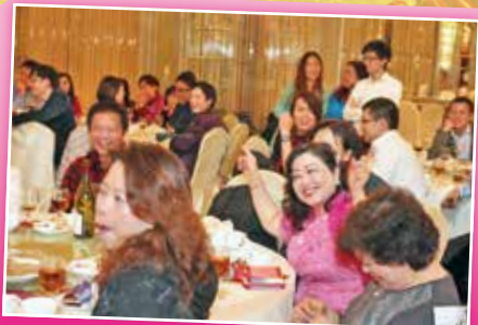
會友投入參與晚宴遊戲