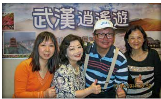
總會資深青商武漢逍遙遊