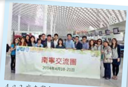
4日3夜南寧交流團由深圳機場出發