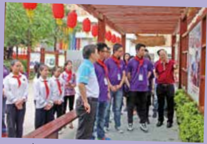
探訪孤兒學校「明天學校」