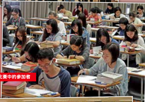
努力比賽中的參加者