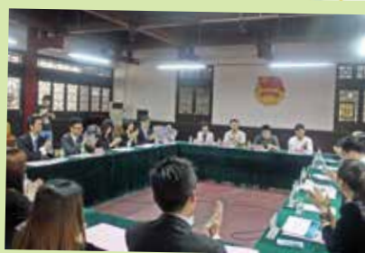
兩會於青企協會址進行官式拜訪及交流

第二天到訪南寧市規劃展示館，令會友增加對南寧歷史及未來發展方向的認識。其後參觀當地一間民資企業——「新勝利農資集團」，很榮幸得到廠長熱情招待並帶我們參觀廠房，闡述肥料等產品的生產過程、公司客戶群及未來發展方向。午飯過後，再探訪當地一間孤兒學校——「明天學校」。校方向我們介紹學校的歷史及發展，並訓勉學生要存著感恩的心。當籌委會送上簡單的日用品予學生的時候，他們都露出燦爛的笑容，連番道謝。大合照過後有自由活動的時間，團友和學生無分彼此，一起打籃球、跳大繩和玩橡皮筋繩，樂也融融。