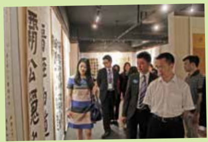
參觀 2014 廣西青年書法展