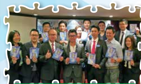
總會商務協進交流聚會