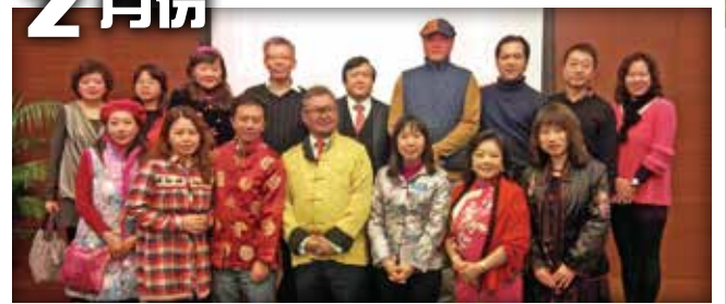
總會資深青商會甲午新春團拜