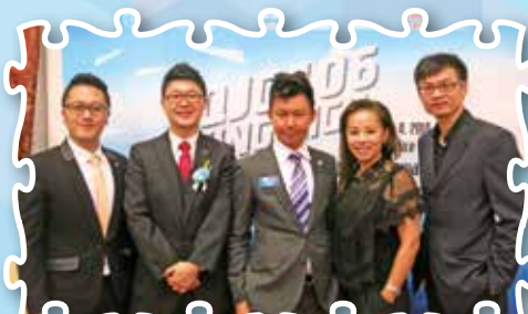
經緯青年商會三十周年會慶晚宴