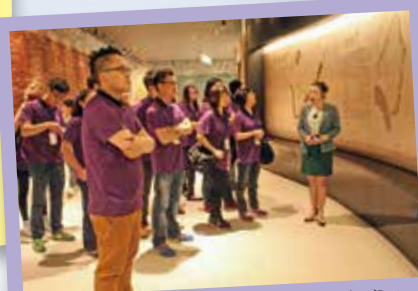
參觀南寧市規劃展示館，了解南寧之過去及未來發展規劃