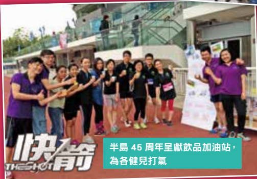
半島 45 周年呈獻飲品加油站，為各健兒打氣