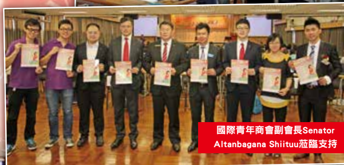
國際青年商會副會長 Senator Altanbagana Shiituu 蒞臨支持