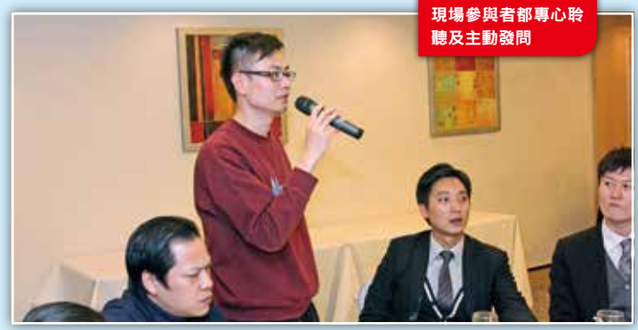
現場參與者都專心聆聽及主動發問