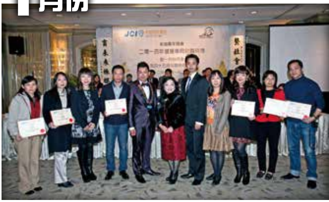
半島資深青商會常務委員會就職