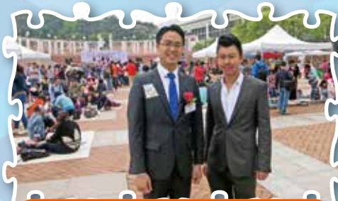
海港青年商會第三十五屆國際兒童繪畫比賽暨公開攝影比賽