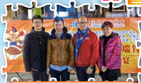
元朗青年商會新春九大盞盆菜宴