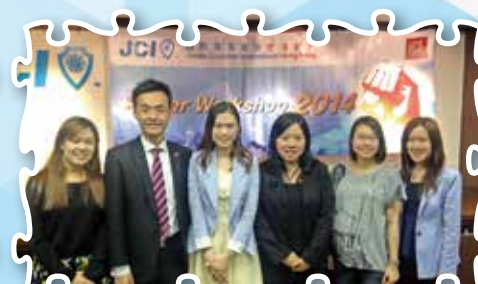
Power Workshop III