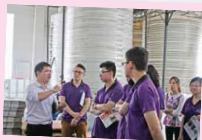
新勝利農資集團代表用心解釋液體肥料生產過程