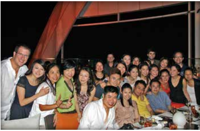
2012 年和頓香港區辦事處公司旅行，攝於泰國曼谷，藉此讓同事們彼此了解，增進感情，亦是對員工的獎勵