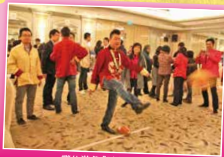
攤位遊戲「勁射九宮格」