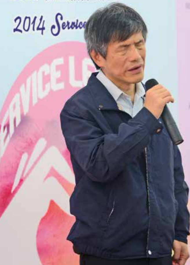
澳門大學服務學習計劃 2014 社區服務展覽會