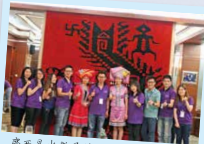
廣西是少數民族之最，團友們一起品嚐地道民族菜式