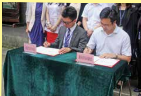
兩會會長代表簽訂友好意向書儀式，展開合作交流之第一步