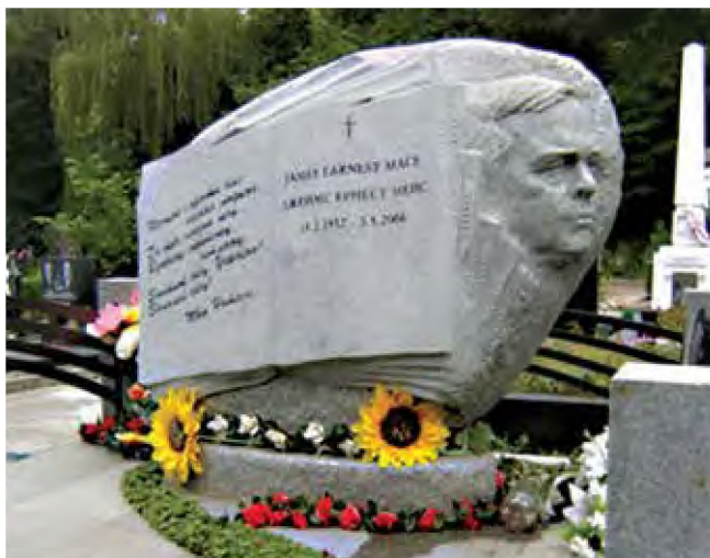
Могила Дж. Мейса на Байковому кладовищі

У 2005 р. вдова Наталя Дзюбенко-Мейс, виконуючи заповіт свого чоловіка, почала передавати до Наукової бібліотеки НаУКМА книжкову колекцію та архів Джеймса Мейса. Спочатку «київську» частину колекції, а в листопаді 2006 р. за сприяння колег та друзів дослідника до НаУКМА прибула «американська» частина.