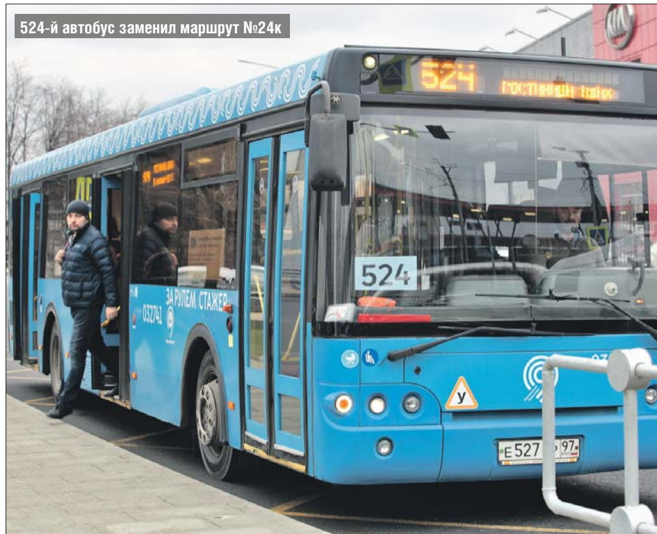
524-й автобус заменил маршрут №24к

Все маршруты разделили на три группы: магистральные, районные и социальные. Первые — это автобусы, которые идут в центр или через центр города, а также экспрессы. Они должны приезжать на остановки не реже чем раз в 10 минут. По номеру маршрута можно понять, с каким интервалом он ходит.