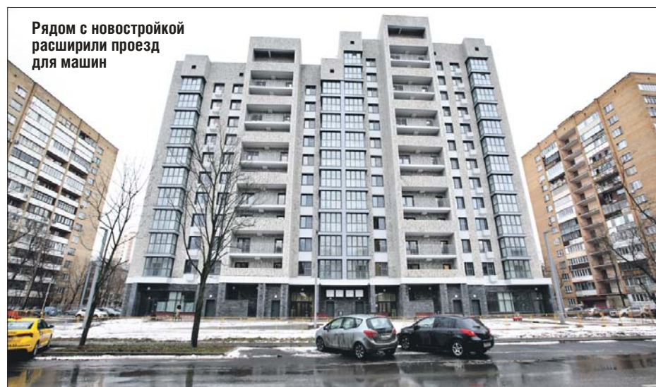
Рядом с новостройкой расширили проезд для машин