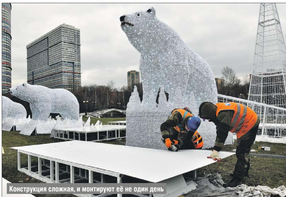
Конструкция сложная, и монтируют её не один день

Для того чтобы композиция круглосуточно светилась яркими огоньками, по всей площади фигур рабочие за-