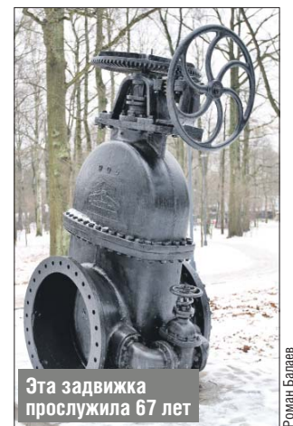
Эта задвижка прослужила 67 лет