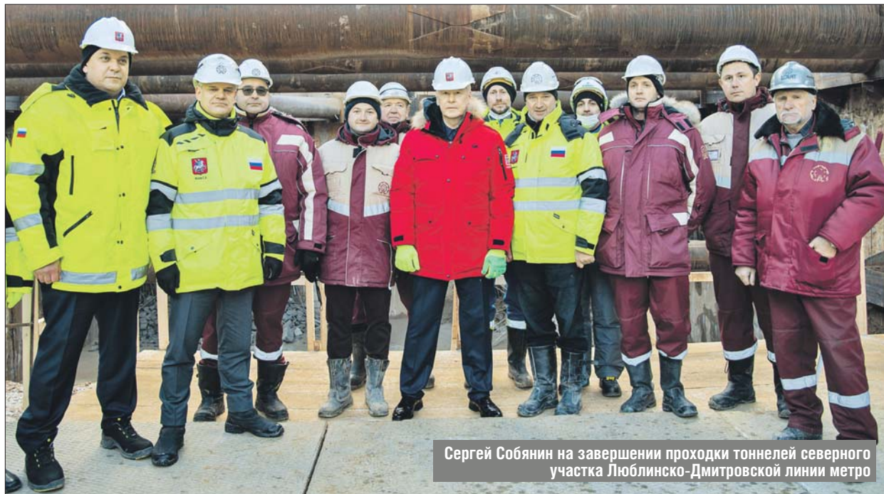
Сергей Собянин на завершении проходки тоннелей северного участка Люблинско-Дмитровской линии метро

По словам столичного градоначальника, продление Люблинско-Дмитровской линии метро и строительство станции «Физтех» улучшит транспортное обслуживание районов, в которых проживают около полумиллиона москвичей. Для жителей районов Лианозово, Северный, Восточное Дегунино, Дмитровский и Бескудниковский, а также