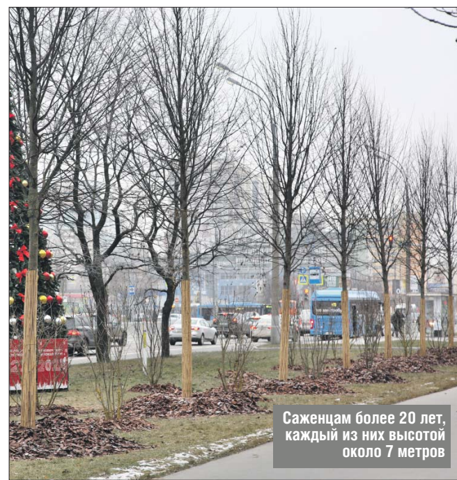
Саженцам более 20 лет, каждый из них высотой около 7 метров