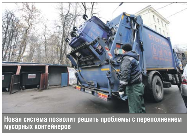
Новая система позволит решить проблемы с переполнением мусорных контейнеров

Это относится и к договорам, заключённым напрямую с ООО «Хартия». Несмотря на то что оно по-прежнему непосредственно будет заниматься вывозом отходов в Северо-Восточном округе, договор необходимо переза-