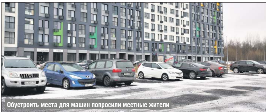
Обустроить места для машин попросили местные жители

У дома 5, корп. 2, на бульваре Академика Ландау обустроили дополнительные парковочные места. Как рассказала глава управы района Северный Екатерина Потапенко, стоянку разместили на месте пустыря. Парковаться здесь могут 150 автомобилей.