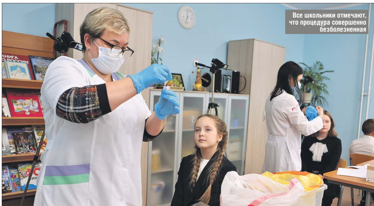
Все школьники отмечают, что процедура совершенно безболезненная

Буквально пара минут — и урок продолжается