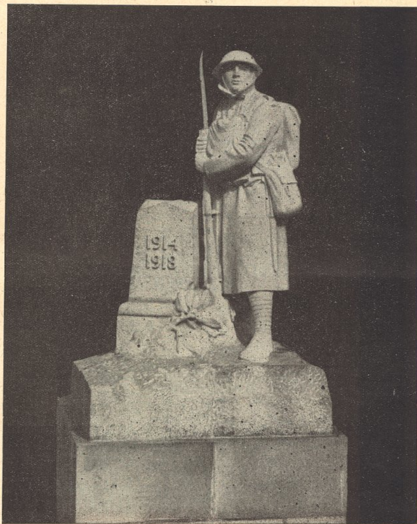
CÓVILHÃ — Monumento aos mortos da Grande Guerra