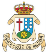
AYUNTAMIENTO SANTA CRUZ DE BEZANA CONCEJALÍA DE DEPORTES Y JUVENTUD