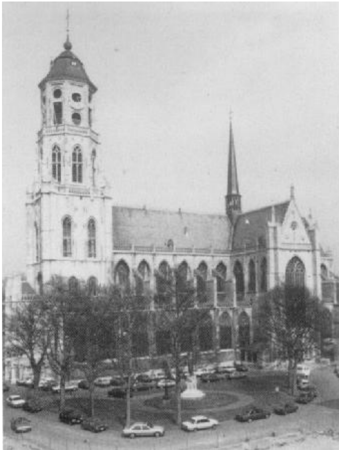
De Sint-Gummaruskerk van Lier, zetel van het kapittel dat te Lille een eigen rechtbank bezat. De karakteristieke (de 'Peperbus') dateert van 1754.