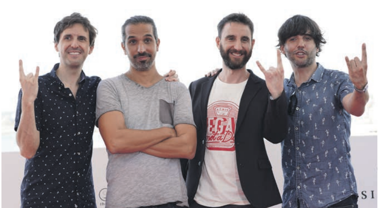
L'equip de Superlópez