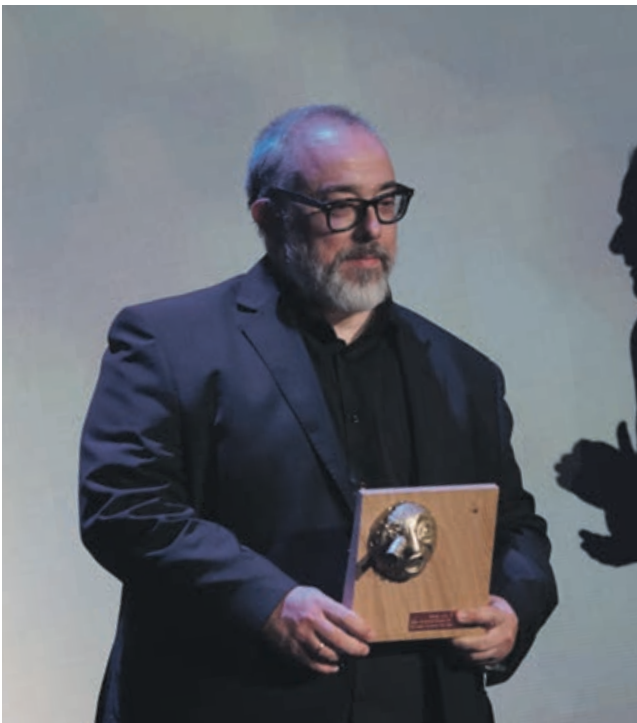
Álex de la Iglesia: Premi Meliès