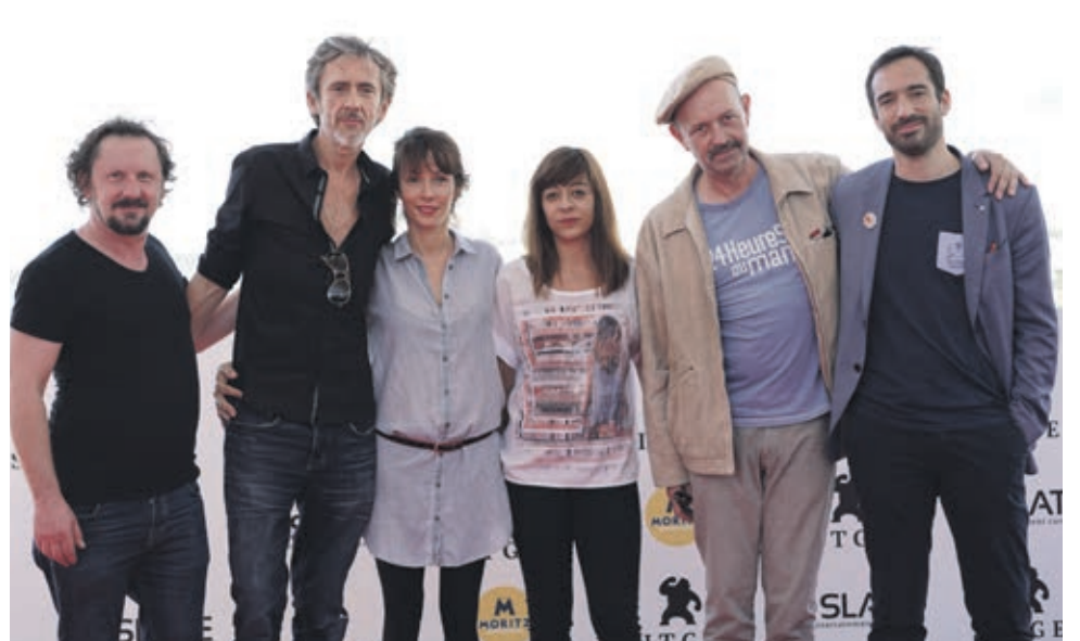
L'equip de Tous les dieux du ciel

ESPACI FNAC AL FESTIVAL DE SITGES - FESTIVAL INTERNACIONAL DE CINEMA FANTÀSTIC DE CATALUNYA -