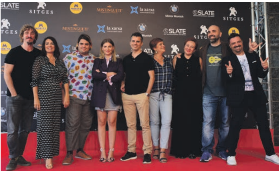
L'equip de L'any de la plaga