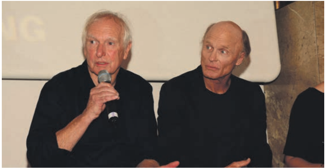
Peter Weir i Ed Harris: El show de Truman