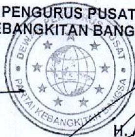
H. Abdul Kadir Karding Sekretaris Jenderal