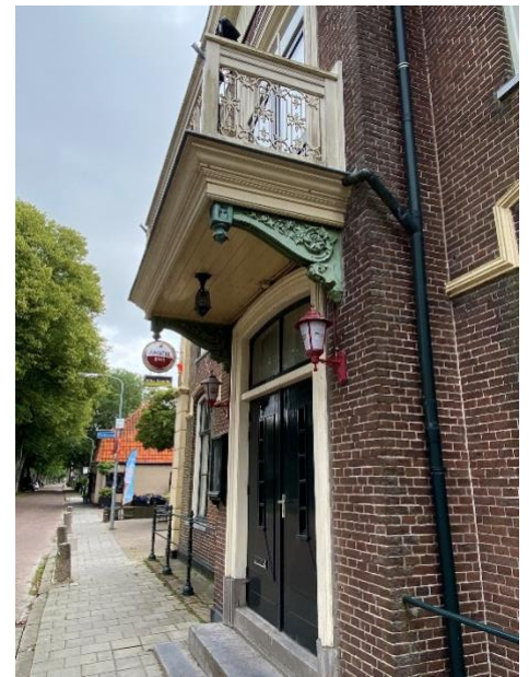
Voorgevel en detailfoto van het balkon