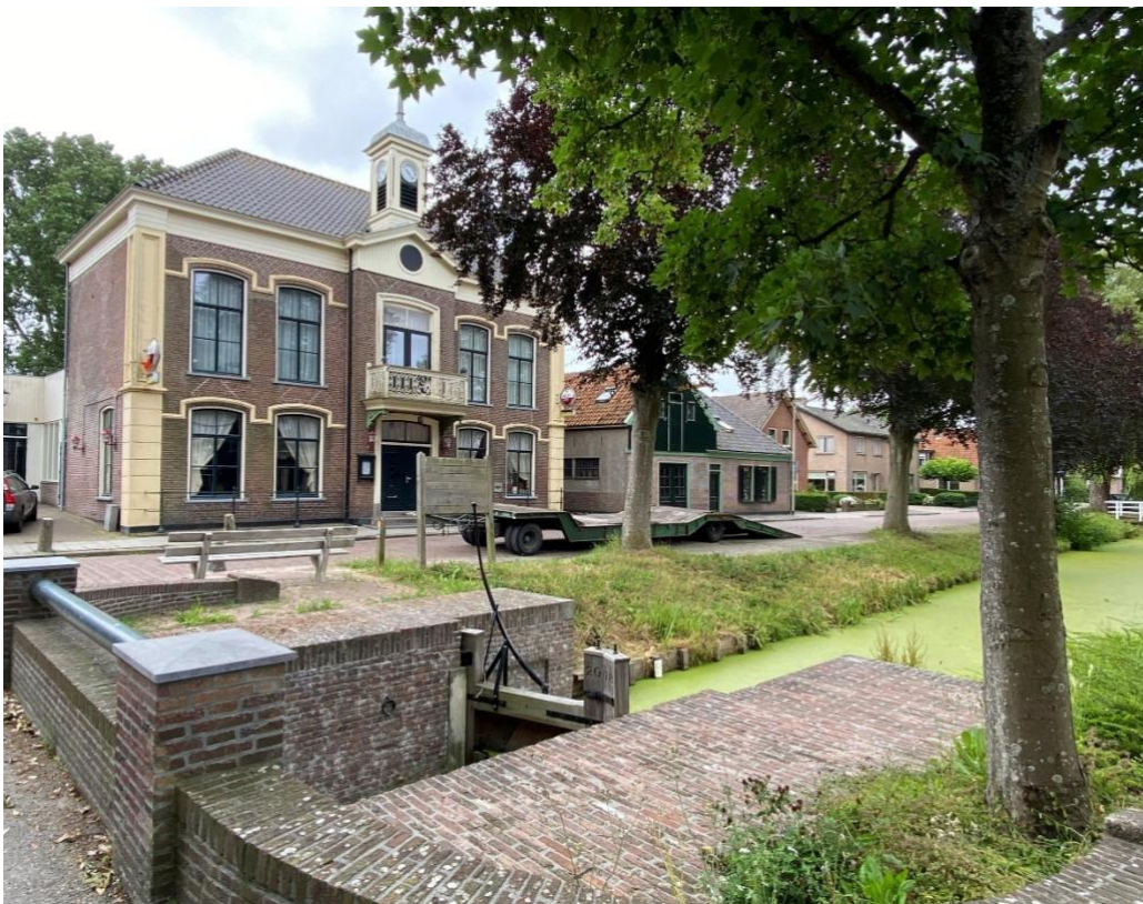
Het pand in zijn omgeving gelegen tussen de lintbebouwing met aan de voorzijde de voorsloot met schutsluis.

Het pand bevindt zich aan de noordzijde van een langgerekte kavel en ligt met de voorgevel (west) aan het trottoir. Het pand heeft aan de voorzijde een hardstenen stoep met smeedijzeren hekwerk. Links (noord) van het pand ligt een verhard pleintje op de locatie waar ooit het café 'Prins Maurits' stond. Rechts (zuid) van het pand ligt de verharde oprit die toegang biedt tot het erf en een doorzicht geeft over het achtergelegen open weidelandschap. Aan de achterzijde (oost) van het pand ligt de tuin.