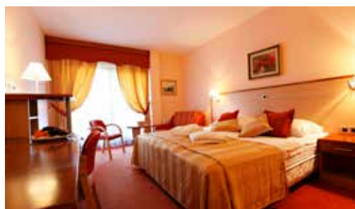
Dvoposteljna soba Hotel Zeleni gaj