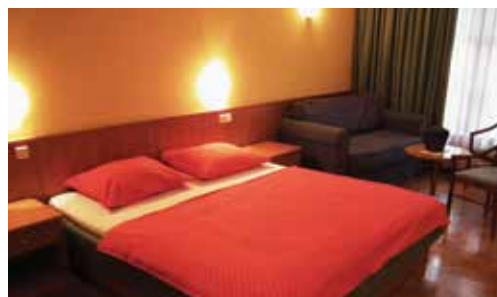
Dvoposteljna soba Hotelsko naselje Zeleni gaj