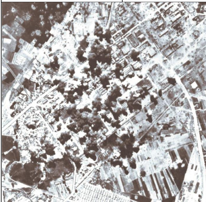
岡山大空襲中，慘遭美軍轟炸的岡山市街

台灣沖航空戰爆發，日本戰敗，其航空軍力受到極大打擊。空戰期間，美軍出動百餘架被日本人稱之為「地獄火鳥」的 B-29 轟炸機空襲岡山軍事設施，使得岡山機場與 61 航空廠遭受毀滅性破壞，而空襲亦波及岡山市街，造成傷亡財損。