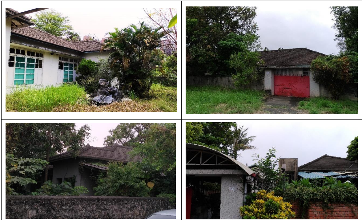
現在的樂群村眷舍