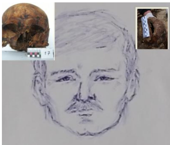
Предположительно череп Новоселова из захоронения на Павловском тракте в г. Барнауле. Реконструкция по черепу, 2010г.