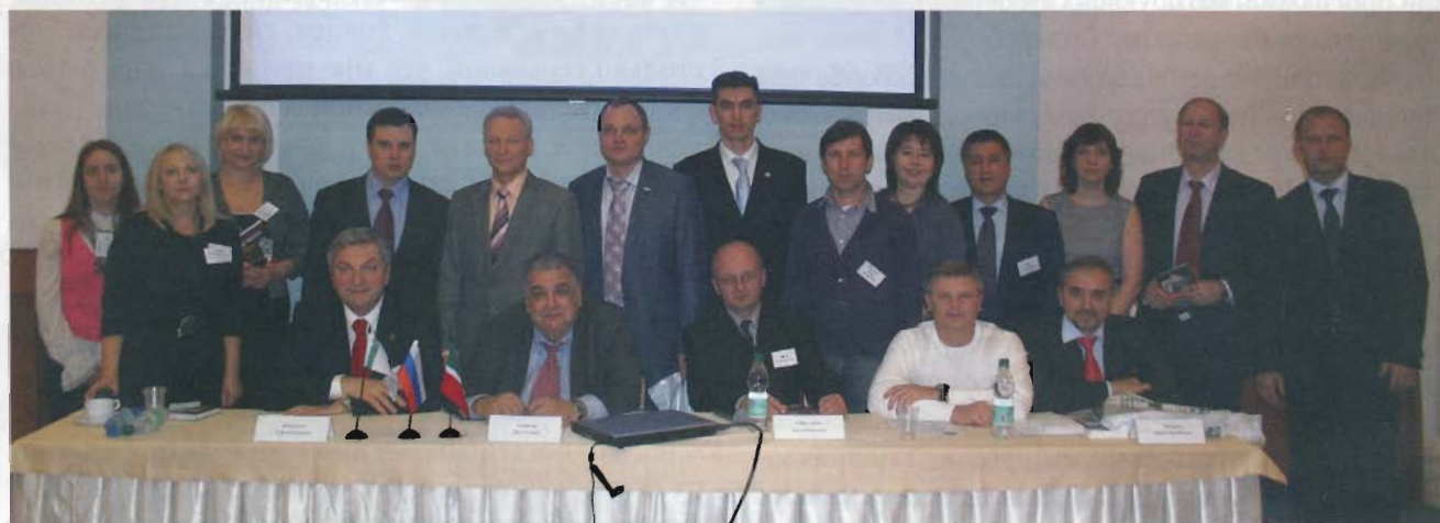
Встреча с выпускниками ВШКУ в Республике Татарстан

Хозрасчетные структуры в это время возникли в других высших учебных заведениях. Причём руководство этих высших учебных заведений