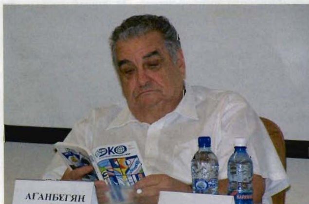
Со своим детищем – журналом «Эко»

Между тем наши экономико-математические исследования расширялись и крепились. И нам потребовалось создать сильную внедренческую организацию. В период Совнархозов мы создали НИИСистем – крупный хозрасчетный институт под нашим