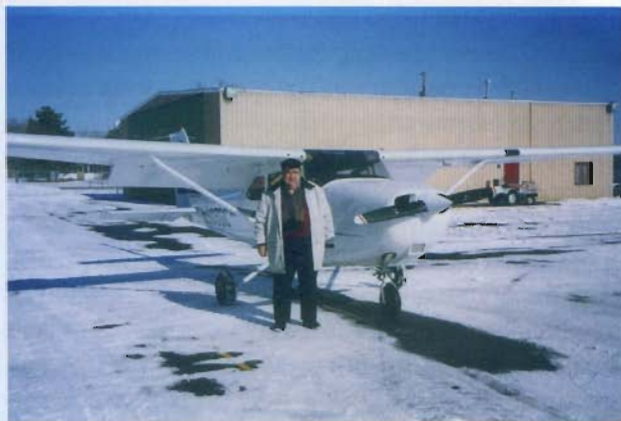
Академик А.Г. Аганбегян много летал на этом самолете в США

и друзей значительно расширился и пополнился представителями совсем других специальностей, национальностей. Благодаря этому и взгляд на жизнь очень изменился. Появилось умение концентрироваться, спокойно реагировать на непредвиденные ситуации, получать удовольствие от созерцания природы и окружающей действительности.