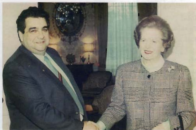
Встреча академика РАН А.Г. Аганбегяна с премьер-министром Великобритании Маргарет Тэтчер в резиденции на Даунинг-стрит, 10. (Лондон, 1987 г.)

рвы. Потребовалось выделение денег, в том числе личных, на оплату адвокатов для защиты и т.д.