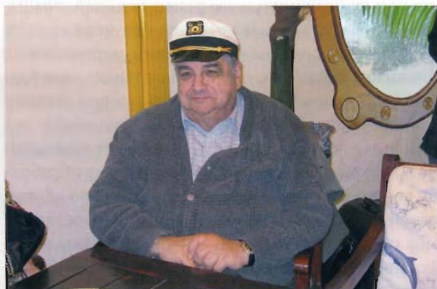
Слет выпускников и слушателей ВШКУ, морской клуб «Адмирал»