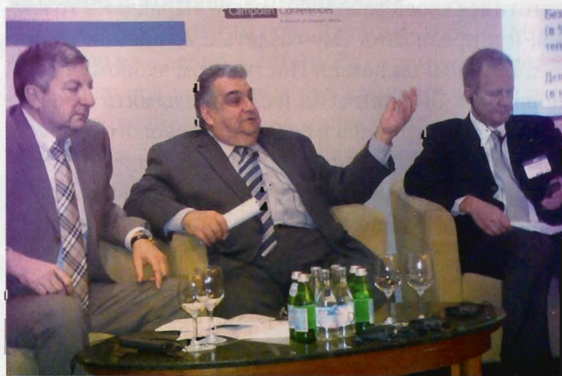
Конференция «Семейный бизнес в России». Гостиница «Балчуг Кемпински», г. Москва