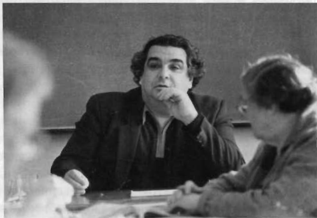
Во время работы в Новосибирске

Институт экономики в те годы размещался в нескольких комнатах в центре Новосибирска (на ул. Советской, д. 20), в огромном здании вместе с другими институтами и службами Сибирского отделения. Квартиру мне могли бы найти в Новосибирске, во всяком случае, обещали. Но ведь я хотел сформировать научный коллектив лаборатории, привезти из Москвы своих товарищей, с которыми там начал что-то делать, но для них в городе не было жилья. Поэтому я принял решение создать лабораторию в Академгородке и ездить в город в явочные дни два раза в неделю.