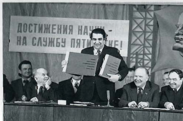
Выездное заседание Научного совета по проблемам Байкало-Амурской магистрали