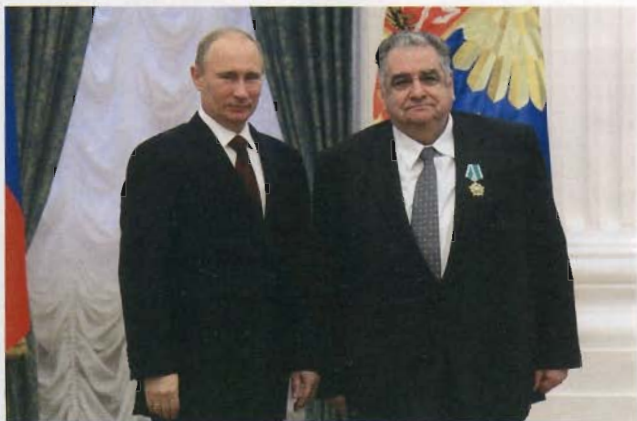
Президент России В.В. Путин вручил орден Дружбы академику РАН А.Г. Аганбегяну

нения медициной, частые поездки в разные места для того, чтобы узнать что-то интересное, в этом плане дают новое ощущение жизни, по сравнению с сидением на одном месте: в одно время, по расписанию вставать, в одно время ложиться, одним и тем же делом заниматься и т.д.