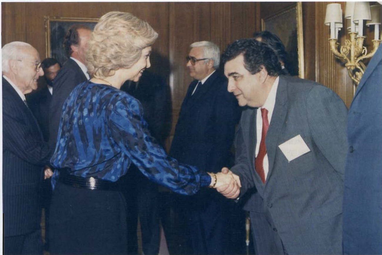
С Королевой Испании Софией