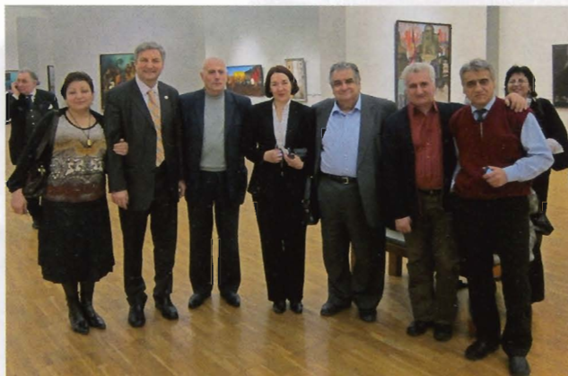
Выставка Мартироса Сарьяна в Москве

Самым приятным занятием для меня является работа с большим фактическим материалом, с анализом динамики, структуры, взаимосвязи разных экономических показателей, с выявлением причинно-следственных связей, значимости тех или иных показателей и т.д. У меня нет помощников, которые помогали бы мне проводить обработку такого материала, все делаю я сам, а по итогам такой работы обычно пишу статьи. Последняя моя статья, например, «Преодоление депопуляции России: впервые за последние 20 лет рождаемость достигла смертности», или другая, чисто экономическая тема: «Растущий внешний корпоративный