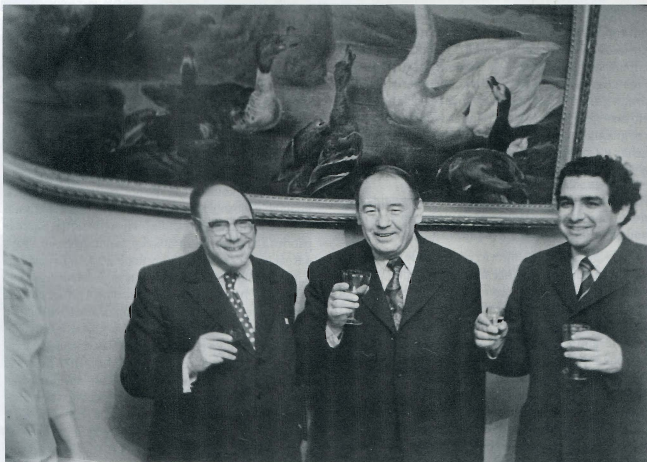
Академики: Л.В. Канторович и Н.П.Федоренко поздравляют А.Г. Аганбегяна с избранием академиком АН СССР, 1974 г.