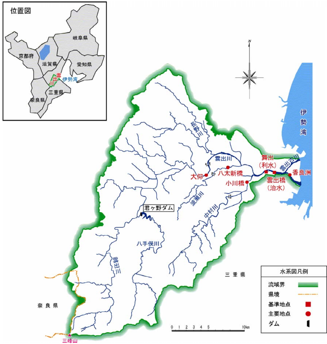
(参考図) 雲出川水系図