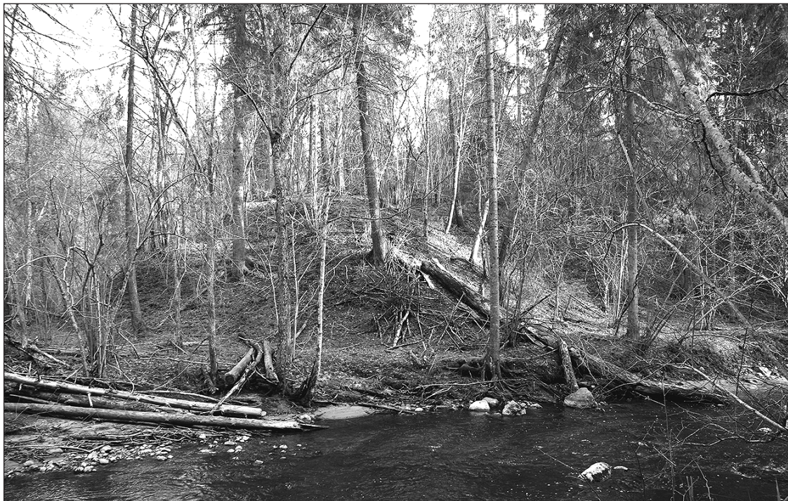
Doļu pilskalns.

Lielceļš ieslīdēja Amatas lejā, bet es jau kalnā nogriezos „Doļu” mājas ceļā, tālāk gar mājas stūri. Kur tālāk iet, nezināju. Bridu pāri miežu laukam. Maldījos, tomēr pilskalnu atradu. Tas atrodas Amatas kreisajā krastā... Doļu pilskalns ir biezu mežu noaudzis, senatnes apvējots Amatas krasts. Sākas ar padziļu graviņu, kādas Amatas krastos iegriežas ne mazums. Ja nezinātu, ka apmēram te jāatrodas pilskalnam, es varēju to noiet kā kuru katru diezgan skaistu krasta izcilni, pavisam nezinot, ka graviņa ir senais aizsarggrāvis. Pilskalns atrodas uz paaugsta krasta izlaiduma, ko no trim pusēm aptek Amata. Pilskalna virsa noklāta ar lielajā vētrā izgāztiem kokiem. Tuvāk uz pašas dzegas malas turas liela egle, kurai vairs tikpat kā nav nekāda pamata zem kājām. Ja tikai drusku aizsāpjosies, nolidos atvarā. Tālāk cita egle, arī jau pavisam uz nelaimes robežas. Tās augstās saknes jau veltīgi grābstās gar grūstošo krastu. Doļu pilskalns sākas ar vēl padziļu raktu gravu vai pat divām un arī beidzas ar gravu.