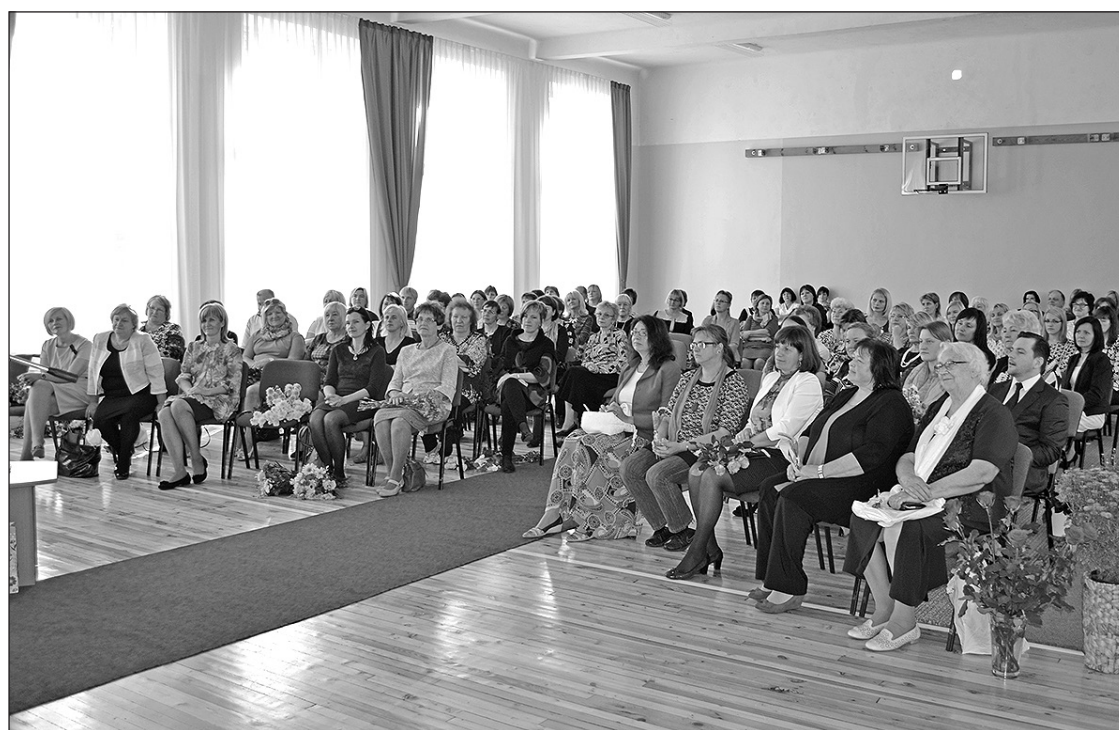
Skolotāju dienas svinības Ieriķos.

Līdz šim Amatas pamatskola atradās divās ēkās – vēsturiskajā ēkā Amatas pagastā un ēkā Ieriķos, bet šajā gadā veiktās