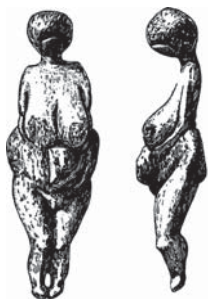
Venuša z Kostonek