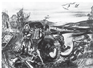
Mamut zo Zotzovej knihy

Neboli to Zotzove klamstvá, veda rýchle napredovala. Slovenská archeológia zažívala rozmach ako