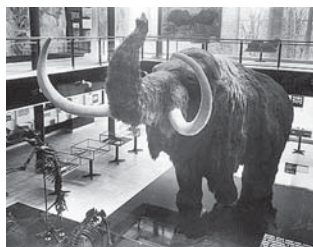
Dokonalá rekonštrukcia v brnianskom múzeu Antropos

rýchlo, že si nestačili vziať ani to najcennejšie. Asi ušli pred nepriateľmi, ktorí sa potom zmocnili ich obydlí a aby zneškodnili ochrancov kostönského táboriska, rozbili posvätné sošky žien, venuše.