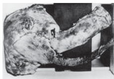
Zdochlina konzervovaná sibírskym mrazom