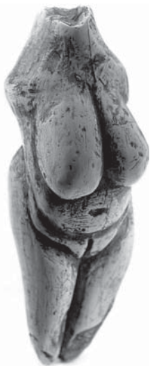
Prvá dáma nášho praveku

mí Slovenska a súčasne dôkaz, že moravianski lovcí mamutov poznali tajomstvo výroby keramiky.