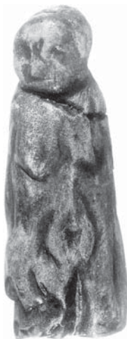
Druhá Věstonická venuša, táto dáma je skutočne falošná