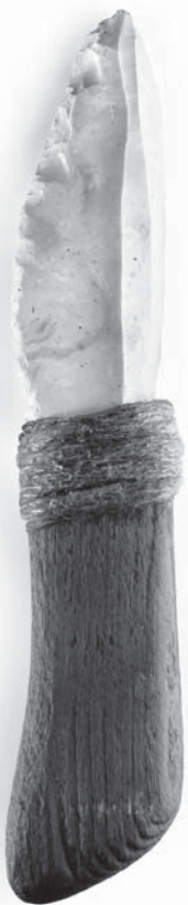
Hrot z Banky pri Piešťanoch upravený zberateľom

Vek neznámej ženy, ktorá podľa miesta náleziska dostala prezývku Moča, určili len veľmi približne na 35 až 55 rokov. Antropológov zaujali jej horné zuby tak-