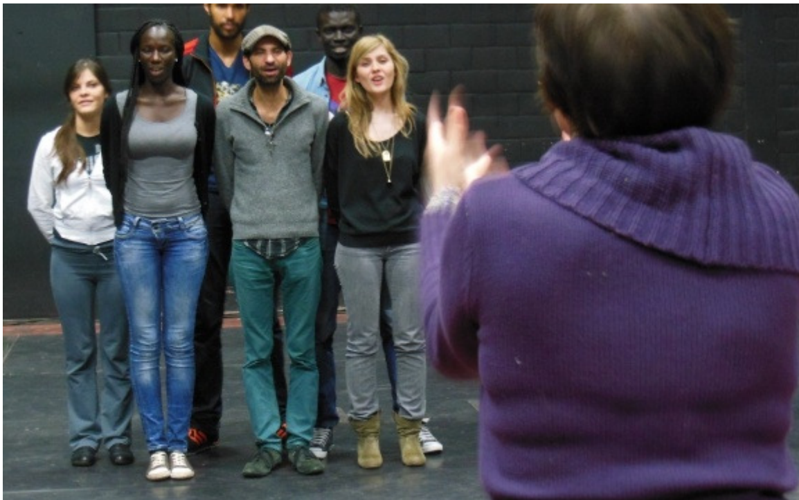
De deelnemers en de regisseur aan het werk.

Afgelopen herfst maakten we al kennis met een woordenboek dat Schaarbeekse multiculturele uitdrukkingen bevat. In deze Brusselse gemeente hoor je talloze talen op straat. En dat inspireerde de mensen van theatertraject GEN2020.