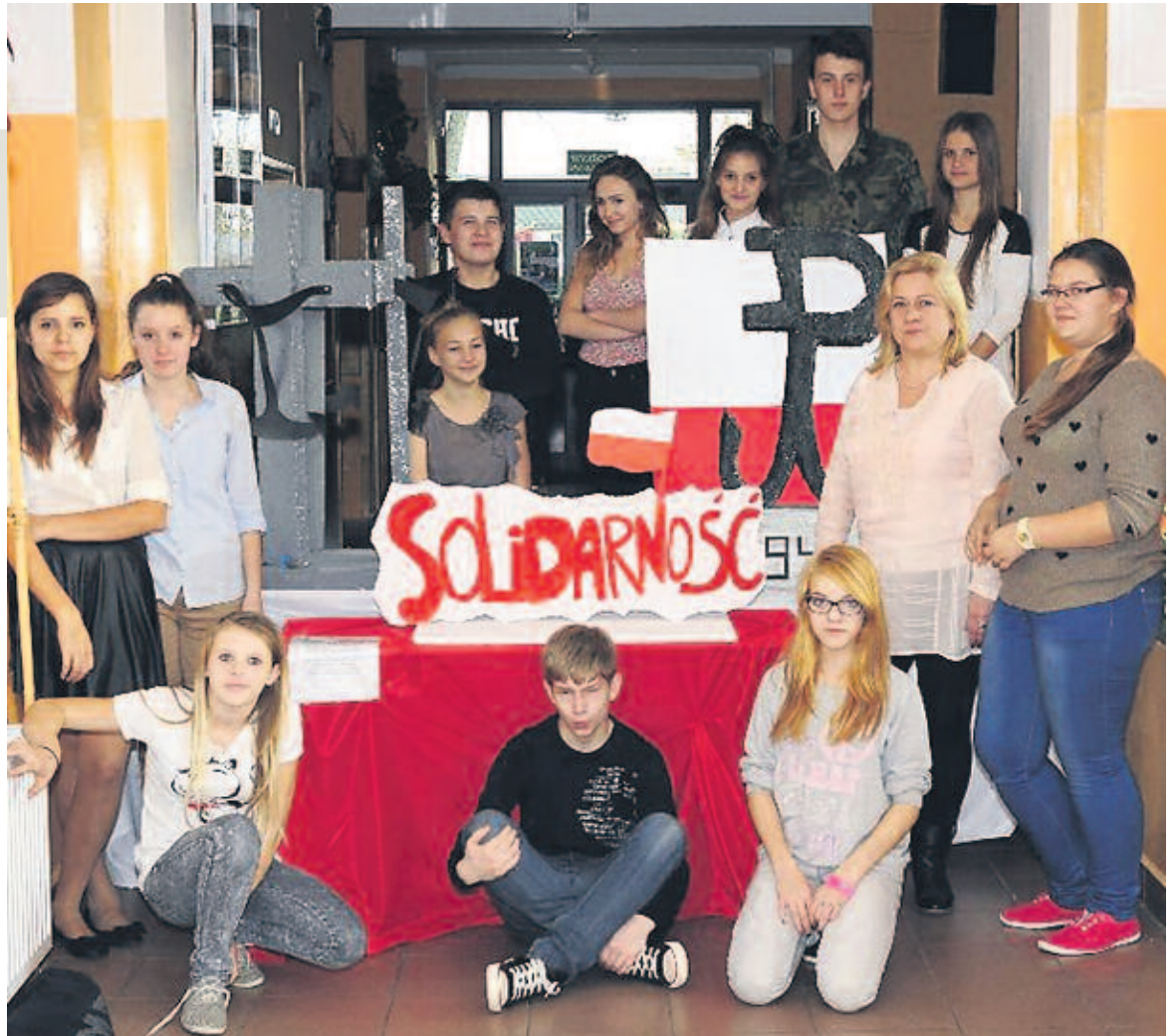
Konkurs plastyczny „Wolność, Kocham i Rozumiem”

Przedsięwzięcie zostało zrealizowane dzięki dotacji uzyskanej od Fundacji Rozwoju Lokalnego Parasol z siedzibą w Bytowie. ■