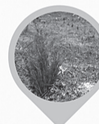
ATBALSTU MEŽA ATJAUNOŠANAI UN KOPSANAI