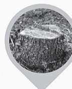
KOKU CIRŠANAS ATĻAUVU